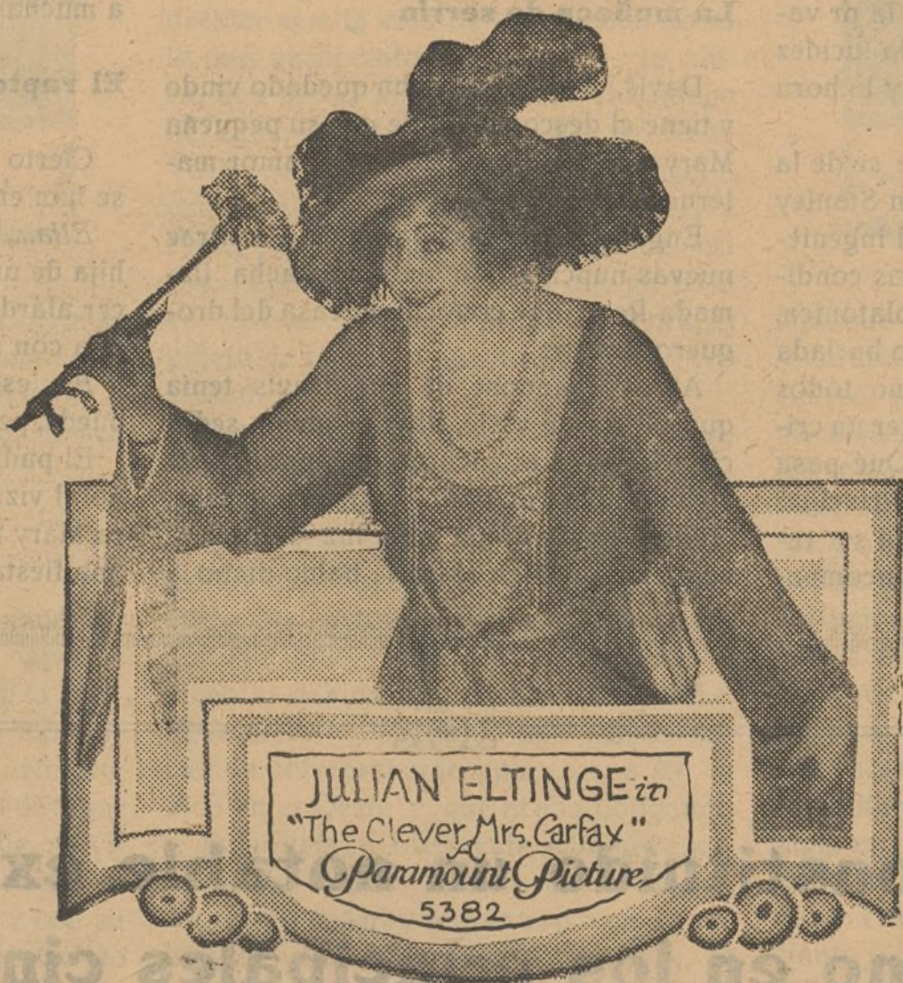
JULIAN ELTINGE in "The Clever Mrs. Carfax" Paramount Picture 5382

Mustafá, un servidor mulsumán del Príncipe, que es a la vez un filósofo y un hombre bueno, le aconseja que vaya a visitar a los desgraciados de la ciudad y contribuya a aliviar su horrible miseria.