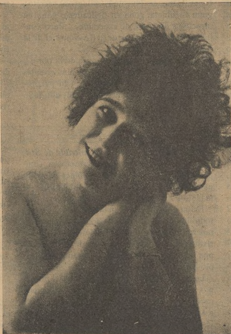
La notable cancionista NINÓN

Nosotros creemos que de los diferentes matices que cultiva sobrepasa en veracidad el de la chulilla madrileña—porque madrileña es—que canta sus dolores y sus alegrías. Sus dolores un poco bravíos y sus alegrías ingenuas sin basteos ni chavacanerías de baja estofa, que algunas otras artistas hacen que se hermane tipo tan simpático como son estas