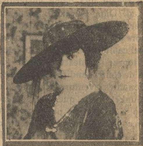
ALICE BRADY IN "THE WHIRLPOOL" SELECT PICTURES

La princesa Astrea, es un alma fuerte y noble en un cuerpo de atleta. Ha tomado bajo su protección a los hijos del marqués de San Germán que está desterrado por conspirador y cuya asistencia está constantemente amenazada por el barón