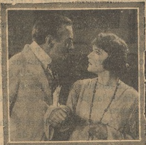
LEWIS J. SELZNICK PRESENTS CONSTANCE TALMADGE "WHO CARES?" SELECT PICTURES

en casa del cura, y fuera sí de alegría se prepara a darles su bendición, cuando se enteran del verdadero estado civil de El... , que es el de vagabundo y el más fresco de los nacidos.