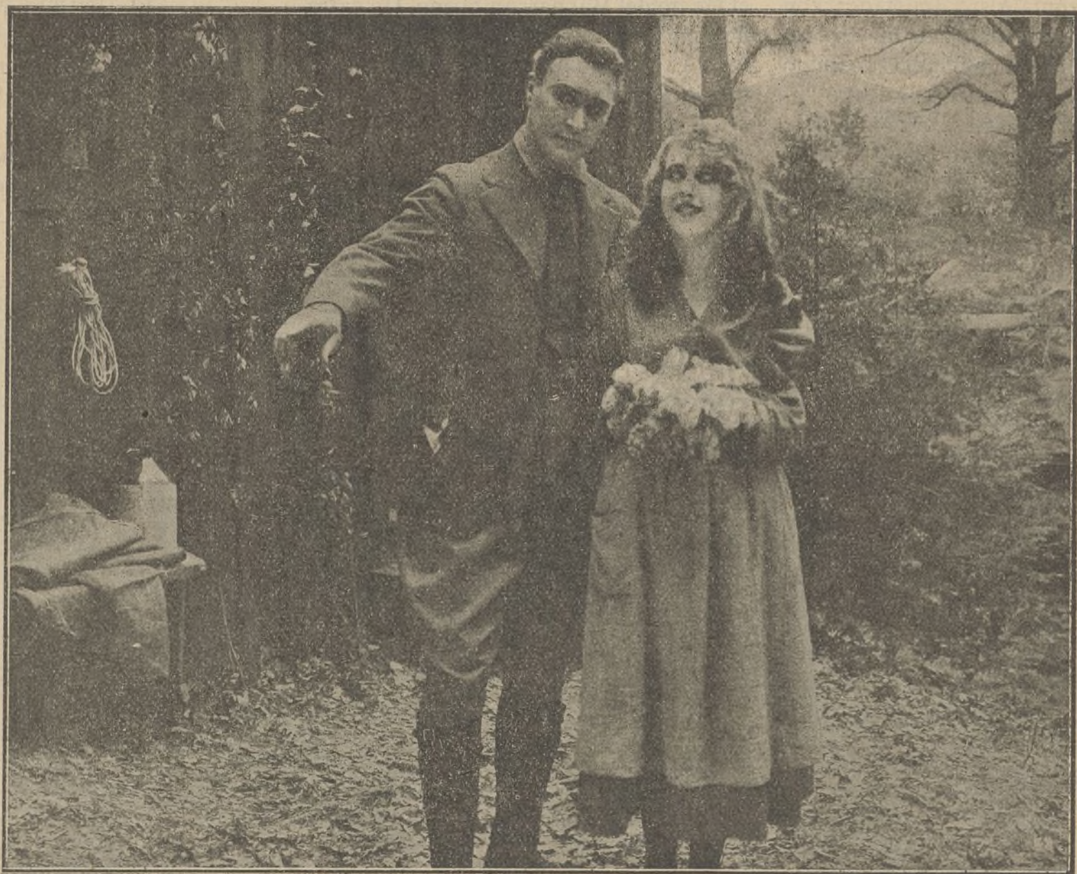
Una escena de la película «La Señorita Feliz»

Después de un vuelo atrevido por encima de las posiciones enemigas y de copioso derroche de proyectiles, el avión francés se dispone a volver al aerodromo, cuando se encuentra cogido dentro de los remolinos de las cortinas del fuego de artillería.