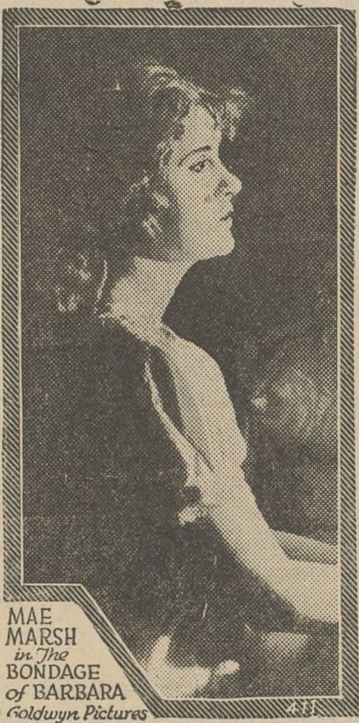
MAE MARSH in The BONDAGE of BARBARA Goldwyn Pictures

Su compañía, que antes nos resultaba una cosa oscura, indigno marco de su glorioso primer actor, está, decididamente, mejoradísima de conjunto. La aparición de las nenas Morano en la escena le da una nota gaya y luminosa; la adquisición de Paquito Fuentes, cada día más deficiente y más acertado; la del mismo Llorens; en fin, la reforma del cuadro artístico, que tan necesaria era, han convertido a la compañía del gran cómico