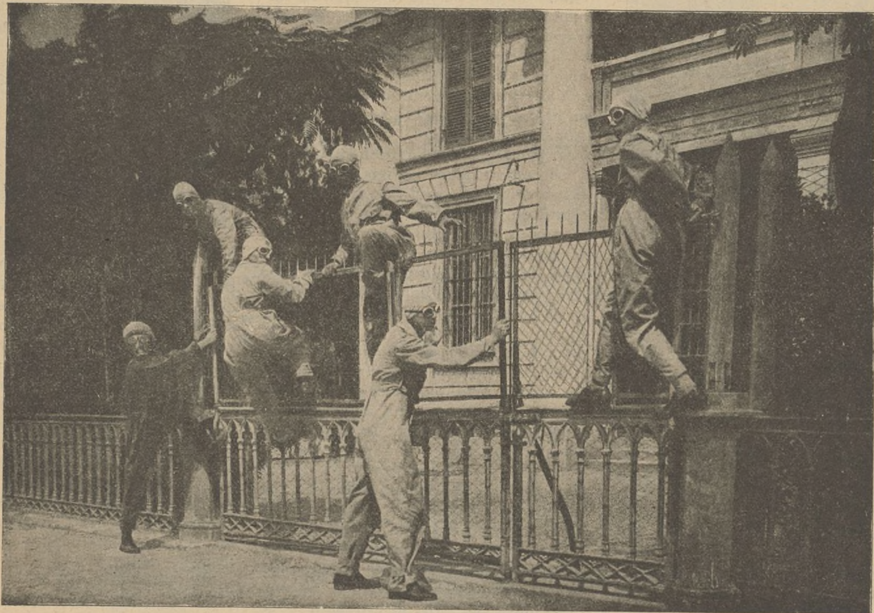
Una escena de la película «Sanson y los raptos»

vir de intermediarios entre la casa anunciadora y las señoritas que deseen solicitar el ingreso en dicha casa, nuestra única misión consiste en hacernos cargo de cuántas cartas y retratos nos sean remitidos, los que a su vez entregamos a la casa de referencia, siendo ésta la encargada de la selección y de facilitar a las elegidas cuántos datos sean necesarios y que nosotros ignoramos.