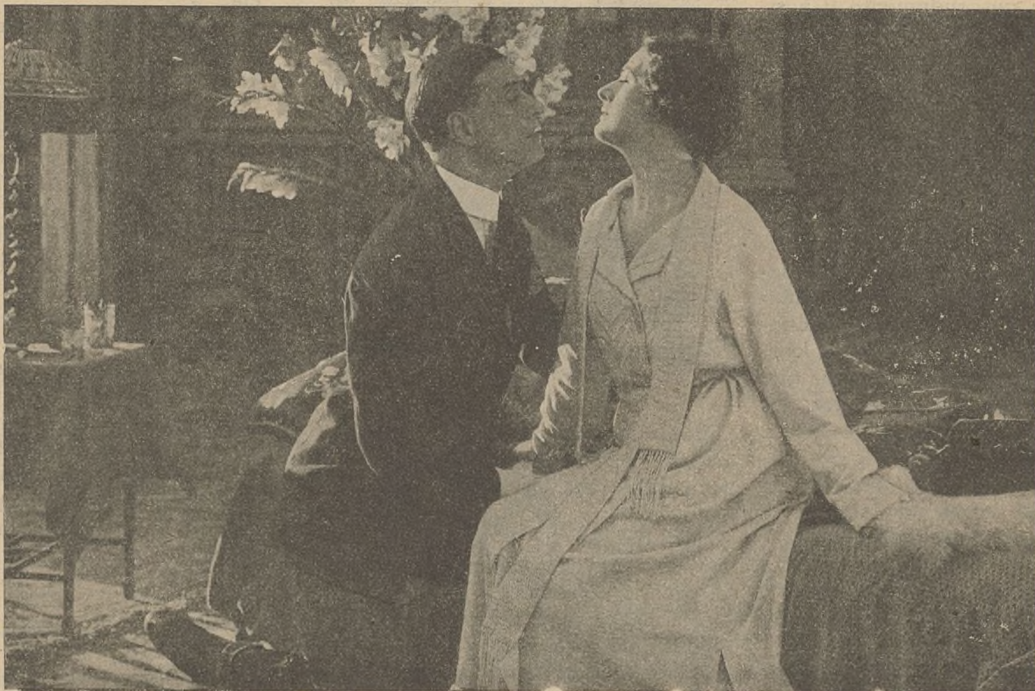
Una escena de la película «Lina Flerión»

Conocedor el banquero del espantoso complot que contra la vida de Jesús tramaban sus enemigos, salió de la ciudad y fué a avisar a María; y, en medio del silencio de la noche, aquel alma apasionada parte hacia Jerusalén, decidida a toda costa a salvar a su Maestro.