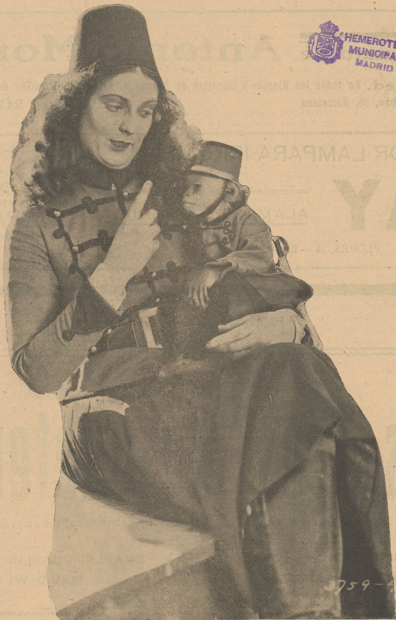
PRISCILLA DEAN La notable estrella de la Universal en la super-joya "Bajo dos Banderas" cuyo estreno se efectuará la semana próxima en el Palace-Cine.