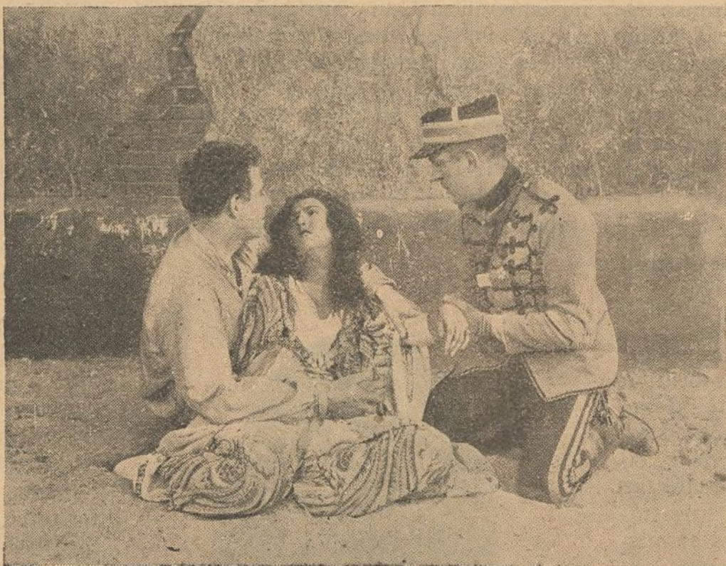
Una escena de la película «Bajo dos banderas»

sis económica tal, que Pierrette se ve obligada a volver a su antiguo oficio de florista. Los cuadros de Mario no se