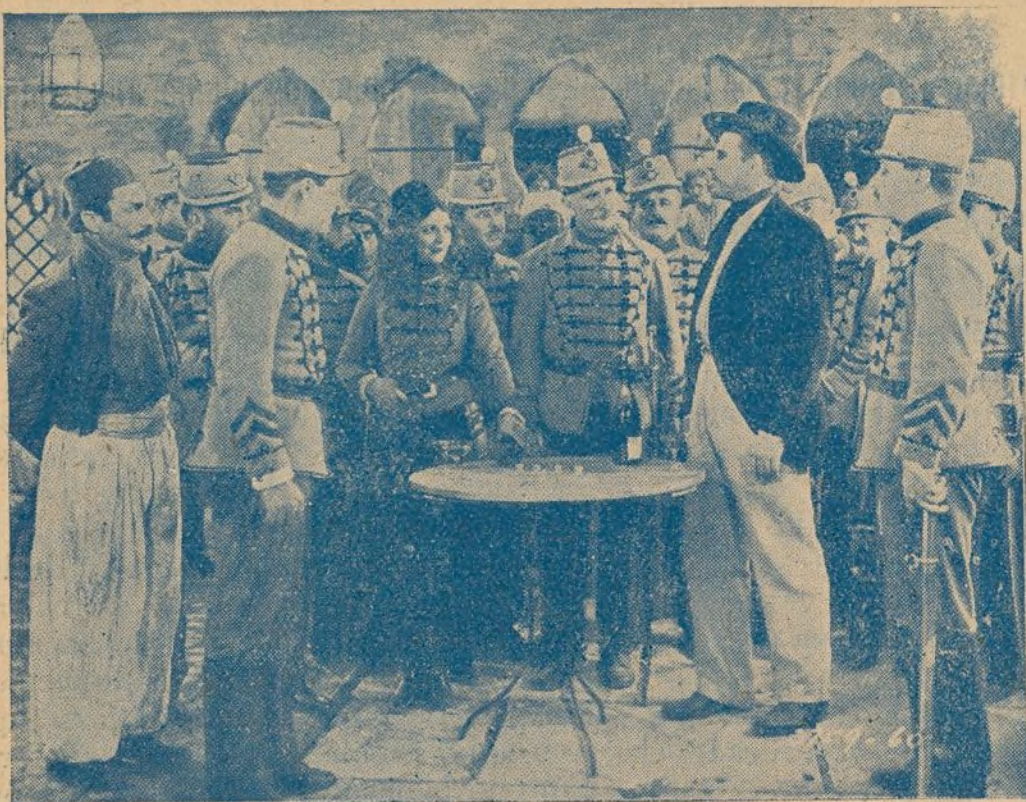
Una de las más culminantes escenas de «Bajo dos banderas»