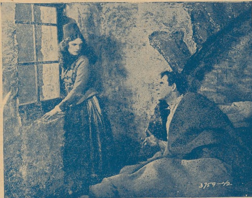
Una interesante escena de «Bajo dos banderas»