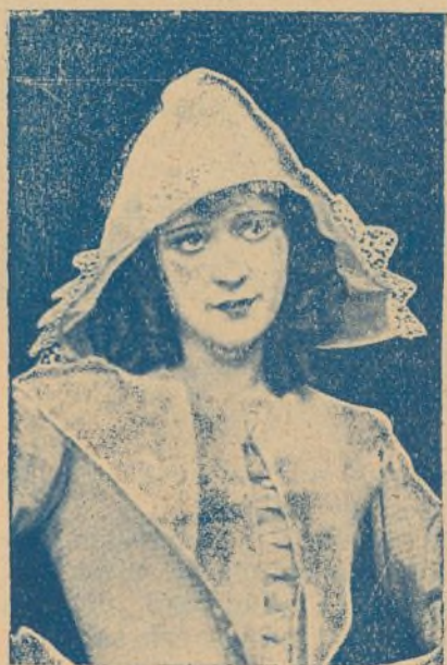
MARGUERITE DE LA MOTTE

cula «Arizona», Marguerite trabajó con Jack Pickford en la producción que lleva por título «In Wrong».