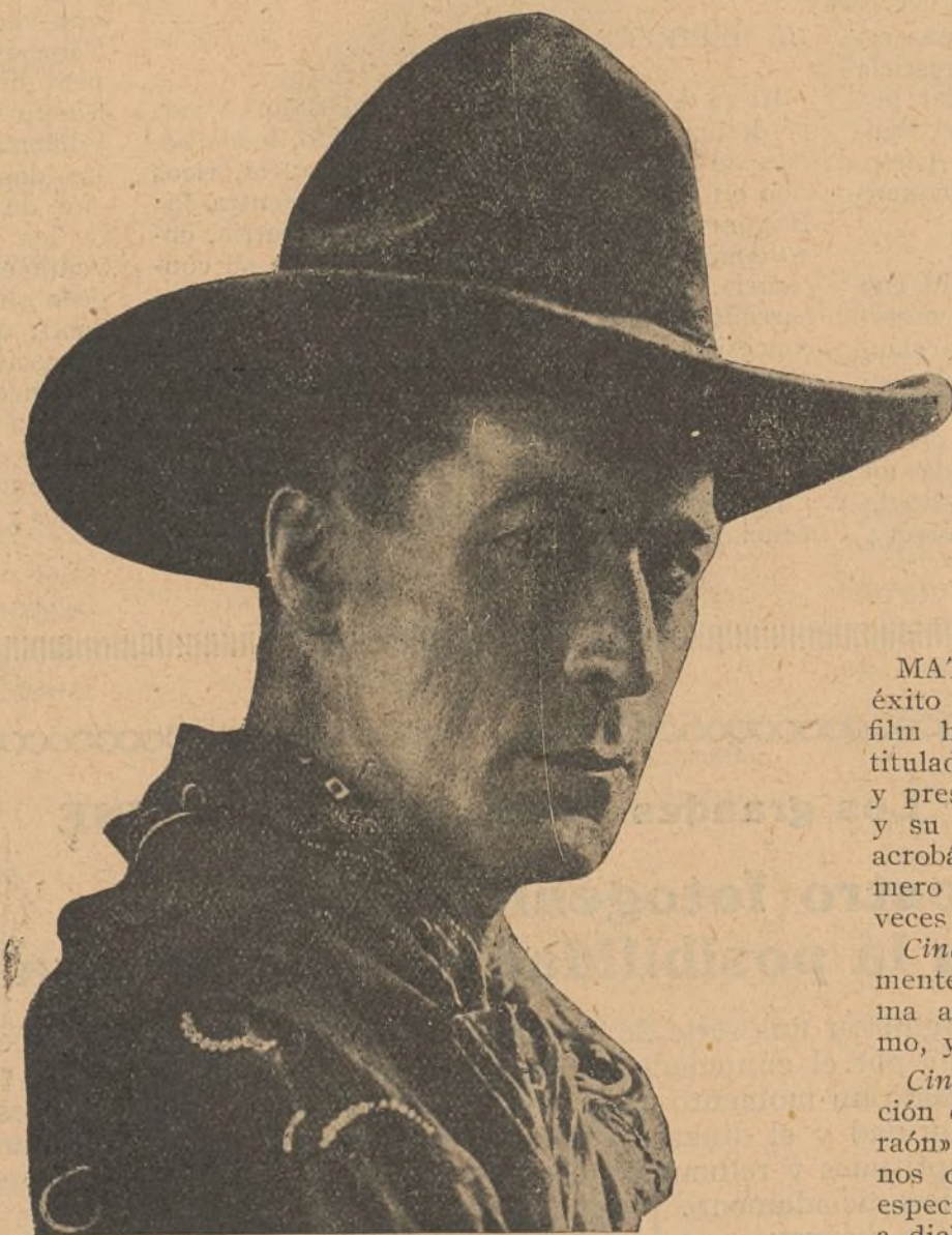
WILLIAM S. HART

El programa Verdagner ha sido enriquecido con dos nuevas superproducciones de la cono-