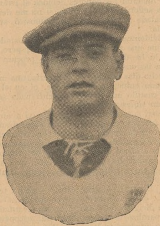
El guardameta internacional, Ricardo Zamora, contusionado en un accidente de automóvil

Los campeones del año pasado tienen un once fortísimo de gran valía, dominan la técnica del balón y poseen un juego brillantísimo, pero a los ases azul-grana les falta ya aquel entusiasmo y aquella fe ciega en la victoria