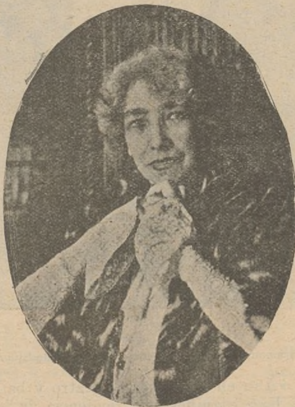
Ultimo retrato de Sarah Bernhardt

Rui Blas, Británicus, Hernani, Fedora, La Dama de las Camelias, Nana-Sahib, Tosca, Theodora, V'la Muerta, Teresa