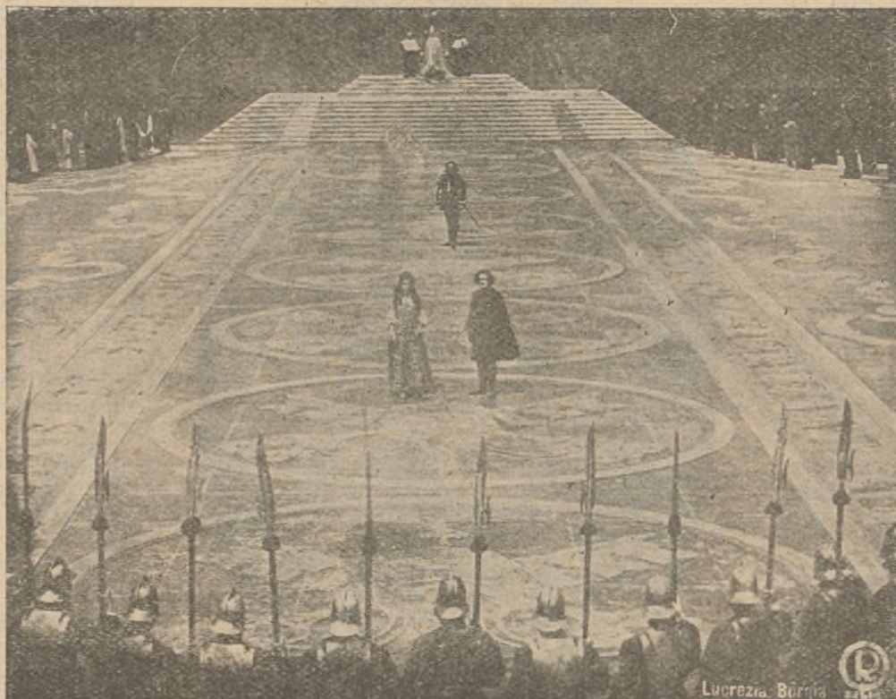
Una escena de la película «Lucrecia Borgia»

Y Lucrecia Borgia, la hermosa prima de ambos hermanos César y Juan, la sobrina