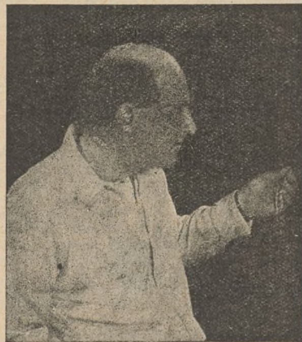
CECIL B. DE MILLE

tes, lo que permite elegir luego la que resulta mejor. Cada noche, después del trabajo, el director y sus principales colaboradores asisten a la proyección del film ejecutado la víspera, lo que permite modificar desde el comienzo, los errores, modificar, si es preciso, el maquillaje de los artistas. Cuando la película está concluida y después de proyectada ante un cierto número de personas, especie de presentación