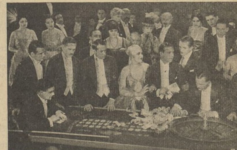
Una escena de la grandiosa versión cinematográfica modernizada de «La Dama de las Camelias» perteneciente al famoso programa «Capitolio» y cuyo estreno tendrá lugar en uno de los salones más favorecidos por el público de Barcelona

Junto a esta esplendidez y magnificencia, no desmerece, sino que más bien los supera, la interpretación genialísima que al personaje de la emperatriz «Theodora» ha sabido imprimir la ya célebre artista Rita Jolivet. En sus bellas facciones, hallan fidelísimo reflejo, las más opuestas pasiones en que se desarrolló la vida de esta soberana, toda refinamiento y pasión. Un éxito, en resumen, rotundo y definitivo, por el que felicitamos sinceramente a «Empresas Reunidas».