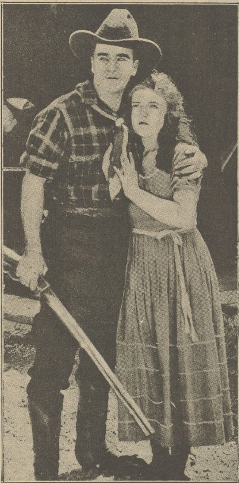
Una escena de la film-serie «Los peligros de Yukon»

Arrojado al espacio. — Merrill logra escapar a tiempo para salvar a Olga que ha caído al agua. Sandy salva a Merrill que es perseguido por un oso salvaje. Merrill lleva a Olga a tierra. Merrill dice a Petrof que se ha apoderado del mapa. Sandy llega, llevándose el mapa,