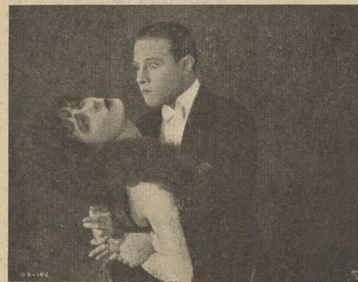
Nazimova y Valentino en su interpretación de Margarita y Armando de «La Dama de las Camelias»