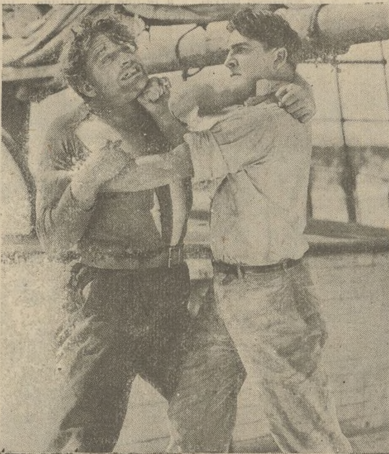
Una escena de la película «Los peligros de Yukon»

Piñiendo un ligero parentesco, Ralph Gor-