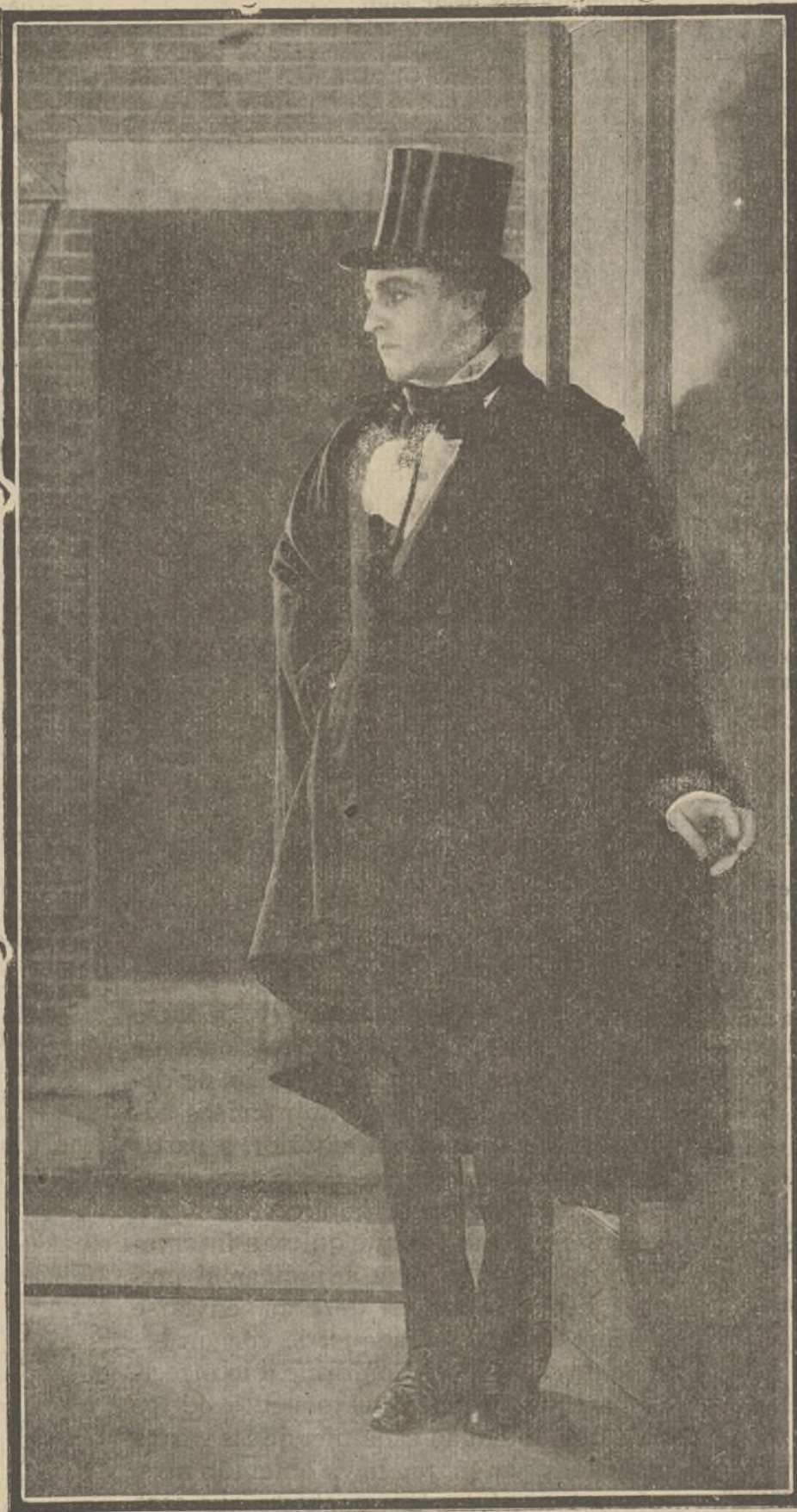
JOHN BARRYMORE en la película «El hombre y la bestia»

Un hombre misterioso. — Para ayudarles en sus planes, los extremistas cuentan con un brujo llamado Marnee, el cual tiene secuestrado a un muchacho, al que hace objeto de constantes malos tratos. El chico en un supremo