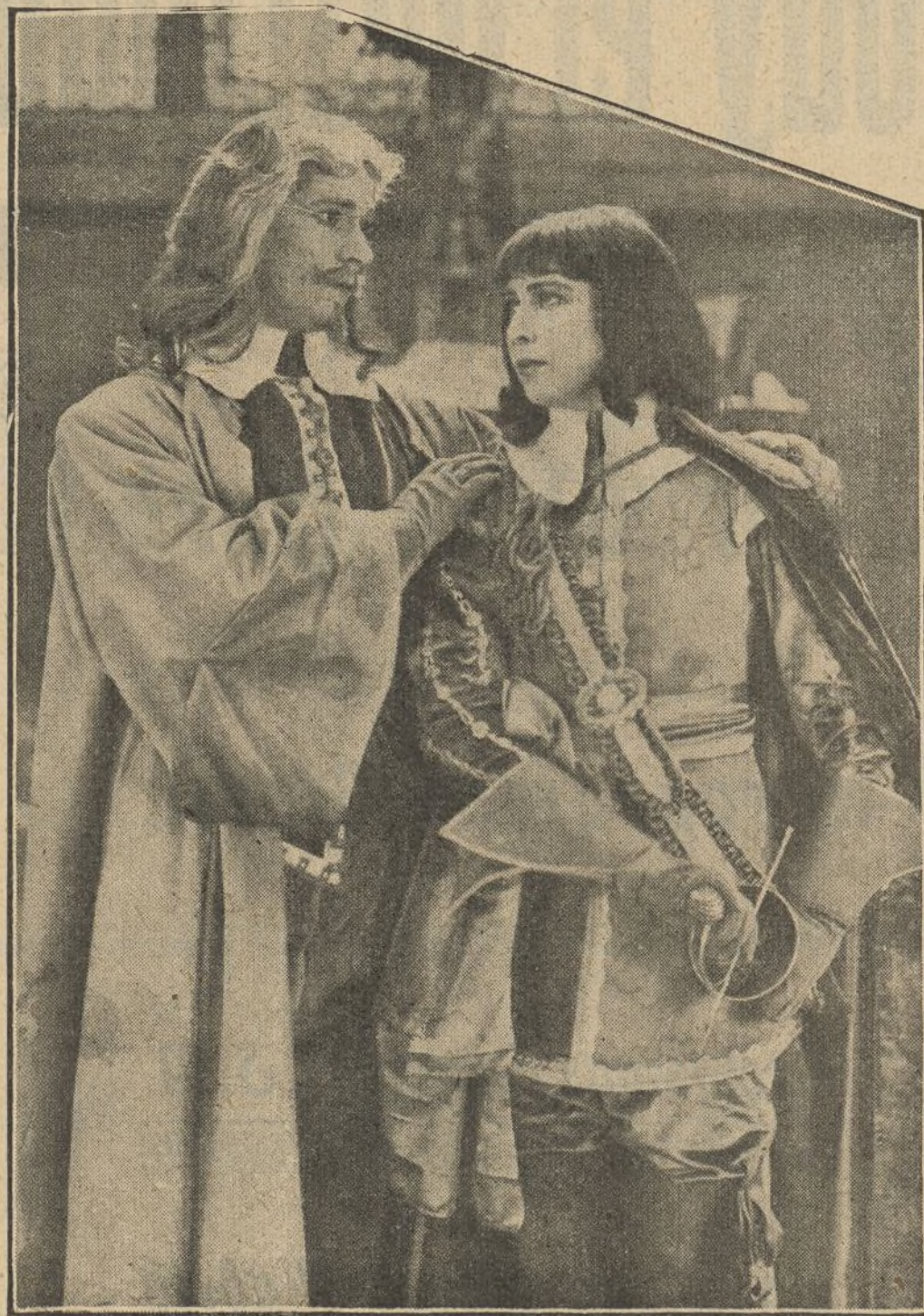
Athos y el Vizconde de Bragelonne en una de las escenas más interesantes de VEINTE AÑOS DESPUÉS

Cuyo éxito en el REAL CINEMA, de Madrid, en el PATHE-CINEMA, de Barcelona y en el CINE MODERNO, de Valencia ha superado a toda ponderación