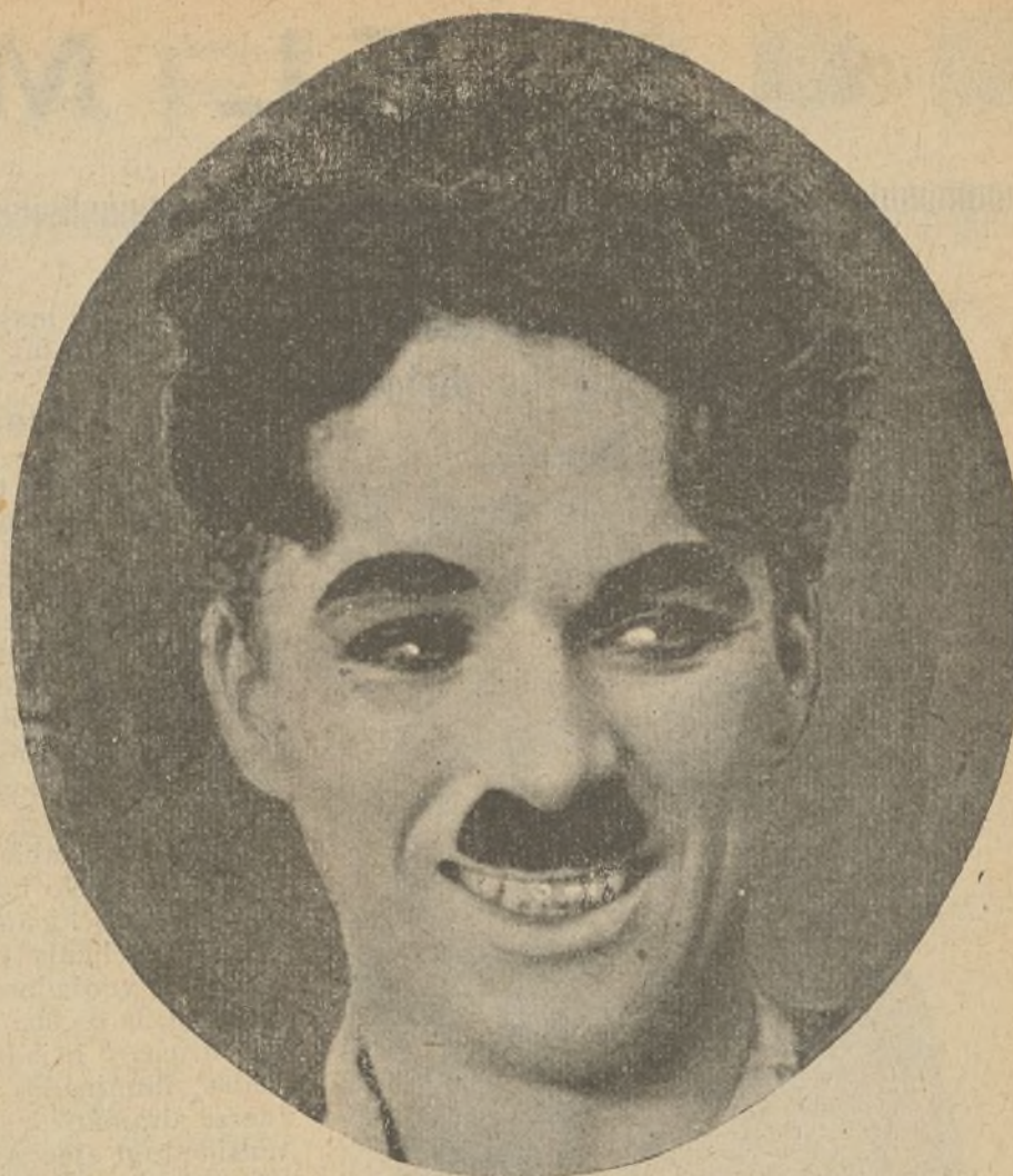
He aquí a Charlot caracterizado en la forma que tanto hace reír al mundo entero

Soy multimillonario, millares y millares de espectadores se regocijan diariamente ante las películas por mí impresionadas y que, dicho sea