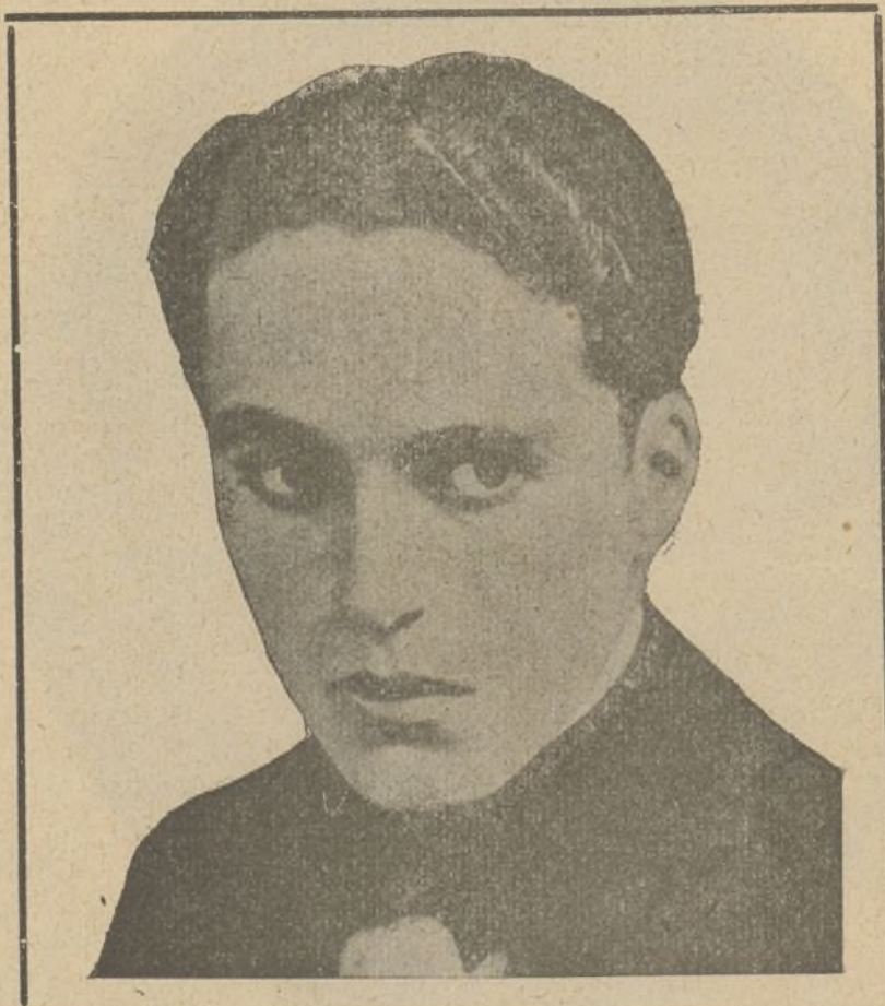
En cambio, Charlie Chaplin sin caracterizar, parece un pastor protestante