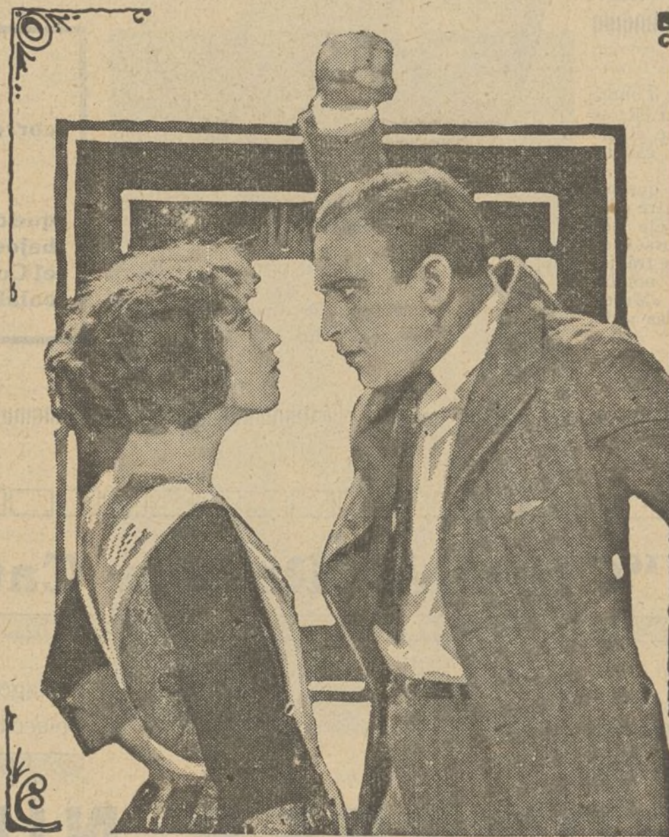
FRANK MAYO en "THE FLAMING HOUR" A UNIVERSAL ATTRACTION

Mamie Convoy estaba alegremente en la terraza de su casa de huéspedes, situada a la sazón al lado del palacio del millonario Gregory. La joven heredera de Gregory le vió, le sonrió y se hizo muy amiga de la dependiente del «Bon Ton». Una noche dos ladrones entraron a la mansión del millonario y Mamie los vió desde la terraza de su casa. Corrió hacia allí y entró; los ladrones creyendo era la heredera trataron de forzarla. Llegan el abuelo Gregory y su nieta, y se le ocurrió al primero la idea de decir a Mamie de que desde este momento sería su nieta. Los periódicos anunciaron que partía a la casa de campo del millonario. Mamie pasó grandes apuros, dándose cuenta de que el tener millones por un día es una cosa nada agradable. Fué arrestada por haber escondido las joyas, para salvarlas, pero el abuelo Gregory sale en su defensa y es puesta en libertad por el joven detective.