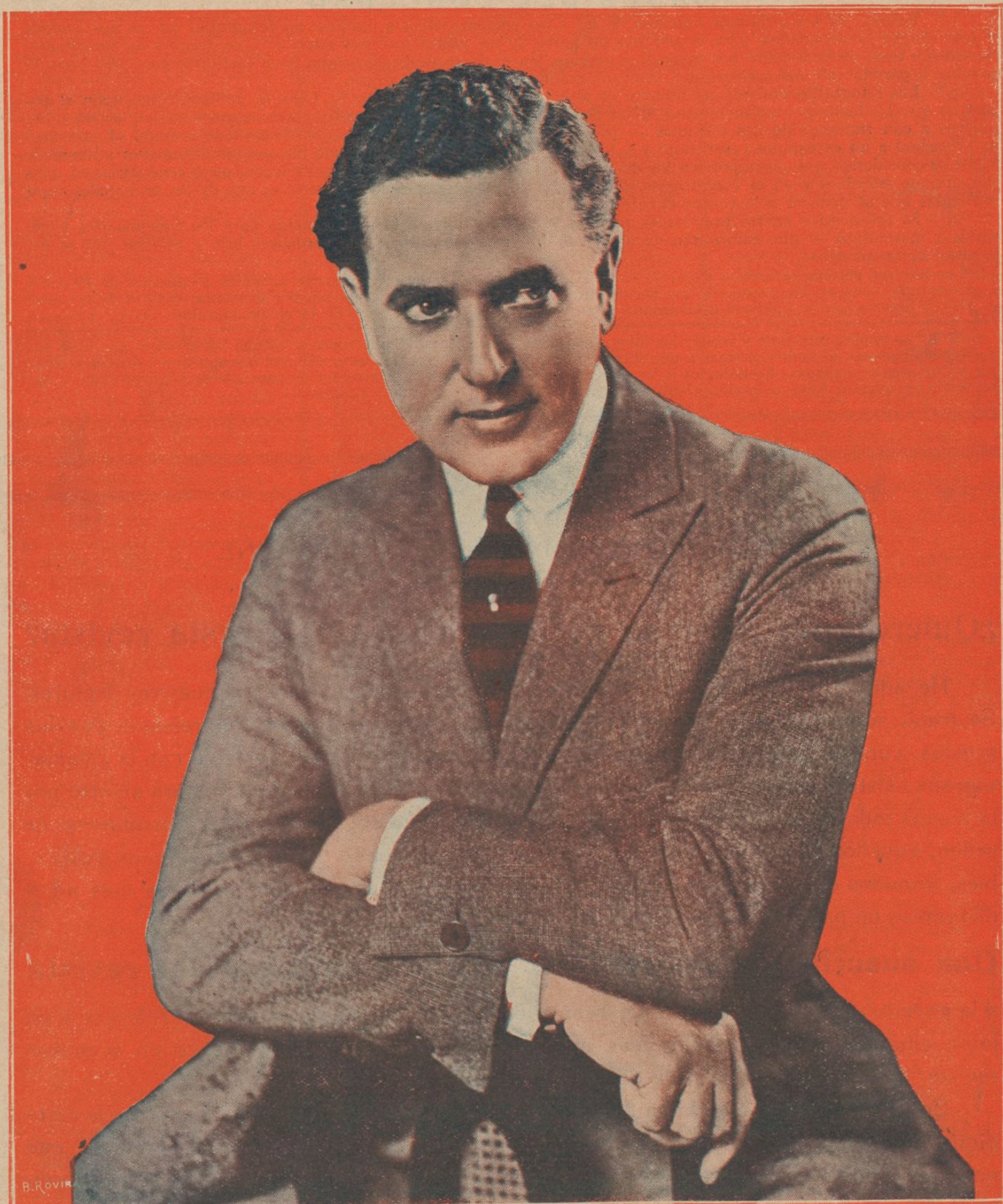
HERVERT RAWLINSON Protagonista de los grandes films, marca Universal, "El automóvil rojo" y "La gran noche" próximas a estrenarse