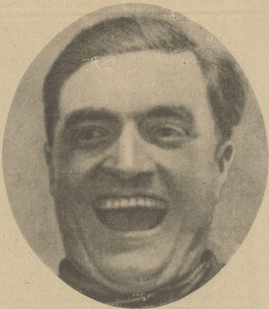
El gran Tom Mix, protagonista de tantas películas de aventuras y caballerista excelente, muestra a nuestros lectores en una caricajada, la blancura de sus dientes de lobo.

Un congreso de indios navajos o pielrojas, debe ser una delicia para el cacique que lo preside y un negocio detestable para los fabricantes de campanillas.