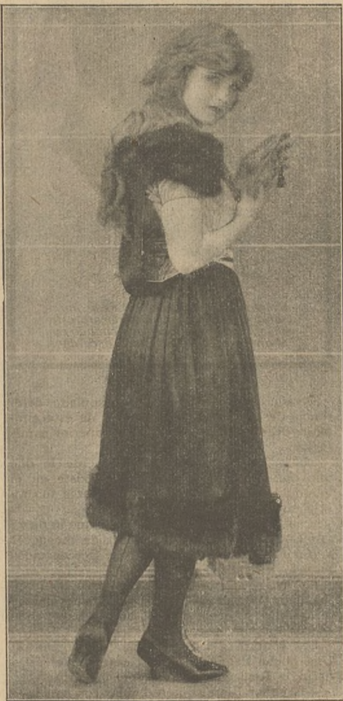
Mary Miles Minter, luciendo un original traje de calle

sación que experimentan cuando en un film una mujer y un hombre, se besan. Y yo confieso sinceramente que el alma se me ha caído a los pies escuchando revelaciones y casi, casi estuve por compadecerlos.