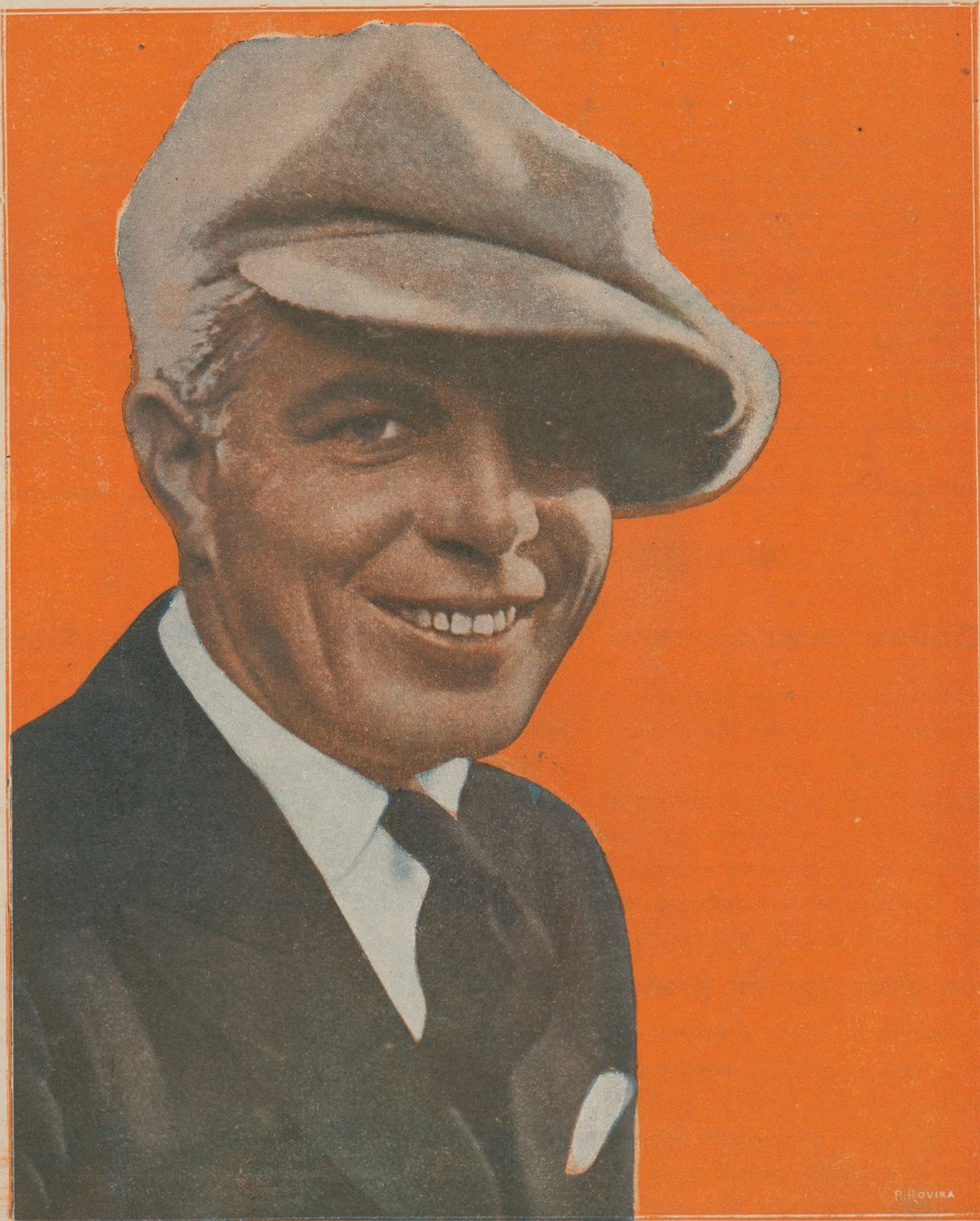
EDUARDO (HOOT) GIBSON

Uno de los más populares artistas de la Universal, al que muy pronto tendremos ocasión de admirar en sus nuevas creaciones «El valiente», «Acelera» y «El gatito montés»