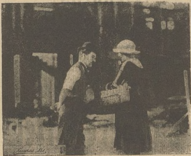
Charlot inicia una aproximación, que no es precisamente una aproximación diplomática, con la hija del Capataz

En esto presentóse su costilla, más dura de roer cada día, y Charlot se decidió a lanzarse a la calle de nuevo; pero al recoger las escon-