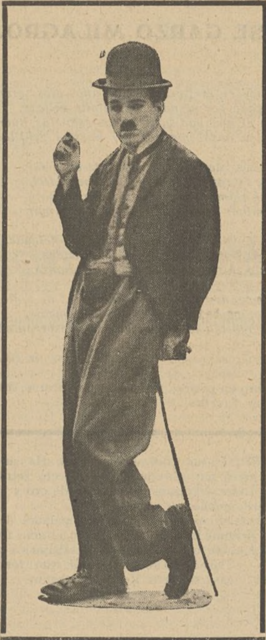
Charlot, que en la película «Día de paga» demuestra una vez más su enorme vis cómica

ver que el capataz le había escamoteado un dólar; y, aunque rechazado no muy melosamente al reclamar, tornó a ajustar la cuenta, sumó cuatro veces dos, que en su aritmética hacen nueve, y reclamó otra vez, logrando ser atendido merced a su labia y a unas cariñosas palmaditas en el abdomen del capataz. Al salir triunfante, restó el dólar que con tanto grajejo había sumado de más, y lo ocultó en la badana de su hongo. Mas ¡ay! que esta operación fué sorprendida por su consorte, una libreta viviente de la Caja de Ahorros, quien