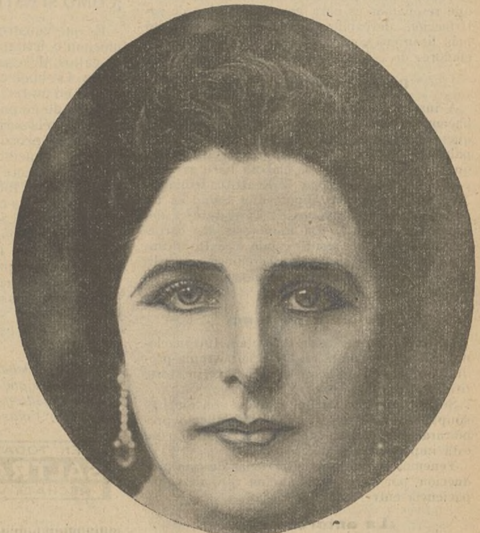
Geraldine Farrar, la genial intérprete de «Juana de Arco», de cuyo mérito y de cuya belleza tendremos en breve nuevas demostraciones, según parece.

Viola Dana, Geraldine Farrar y Mabel Normand, alcanzaron resonantes éxitos en sus