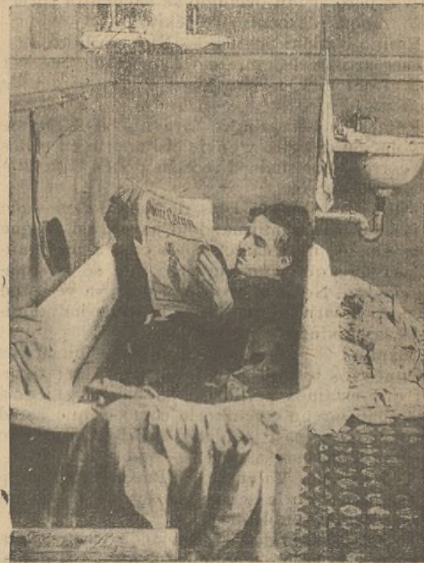
La tiranía de su esposa obliga a Charlot a buscar en la bañera el reposo que le es negado en el lecho conyugal

Eugenio va a casa del cura de la parroquia y le cuenta todo lo ocurrido. Por mediación del