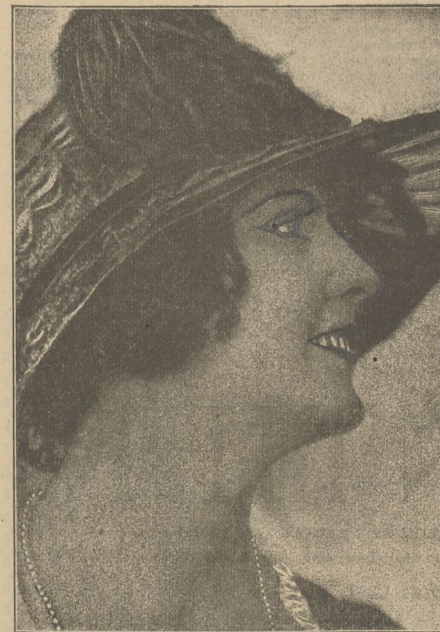
Priscilla Dean, la famosa estrella de la Universal que después de su éxito en «Bajo dos banderas» ha filmado otras dos hermosas películas, «La llama de la vida» y «Tigre Blanco».

Recordamos que, hace años, un amigo que tenía en su casa un aparato cinematográfico para entretener a sus hijos, exagerados aficionados al arte mudo, recurrió a nosotros para que le recomiésemos un mecánico que le arreglase el estropeado aparato. Otro amigo nos presentó a un modesto empleado de cierta entidad pelicular muy competente en cuanto se relacionase con cinematografía. Nuestro recomendado cumplió a maravilla su cometido. De las pocas palabras que cruzamos con él, dedujimos que si continuaba con sus proyectos en pro del cine, triunfaría en la lucha por la vida: hablaba con entusiasmo del séptimo arte