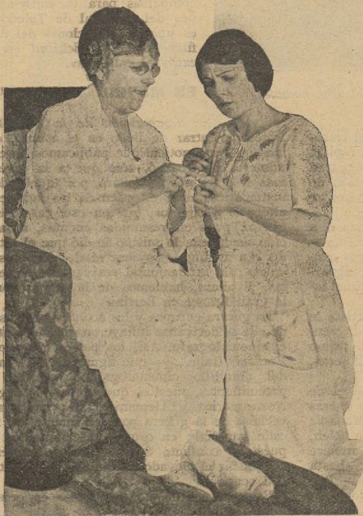
La bella estrella americana Joy Leatrice es en la intimidad del hogar una hija amante y laboriosa

Leatrice Joy, con su pelo negro y sus ojos pardos, con toda la gracia peculiar de las hijas de los Estados del Sur de la confederación norteamericana, ha pasado con menos violencia del papel de señorita de su casa al de estrella de la pantalla universalmente aplaudida. Nació Leatrice en Nueva Orleans, e hija de una familia de la clase media, fué educada exquisitamente en uno de los colegios de la misma ciudad. Siempre acompañada de su madre, a la que le une también el natural afecto, Leatrice Joy trabajó por primera vez para la pantalla con la empresa Nola Film Company, también de Nueva Orleans; pasó después a la Paramount, en Nueva York; trabajó más tarde en Los Angeles con el actor Frank Lloyd; pasó a San Diego, donde permaneció ocho meses en uno de los teatros de la ciudad, y por último, volvió a Hollywood, dedicándose de nuevo y ya sin interrupción, al arte mudo, dirigida por Cecil B. de Mille. En las últimas películas en que ha tomado parte, ha trabajado con el actor Thomas Meighan. Leatrice ha ordenado su vida con un «savoir faire» admirable, y vive con su madre rodeada de todas las posibles comodidades.