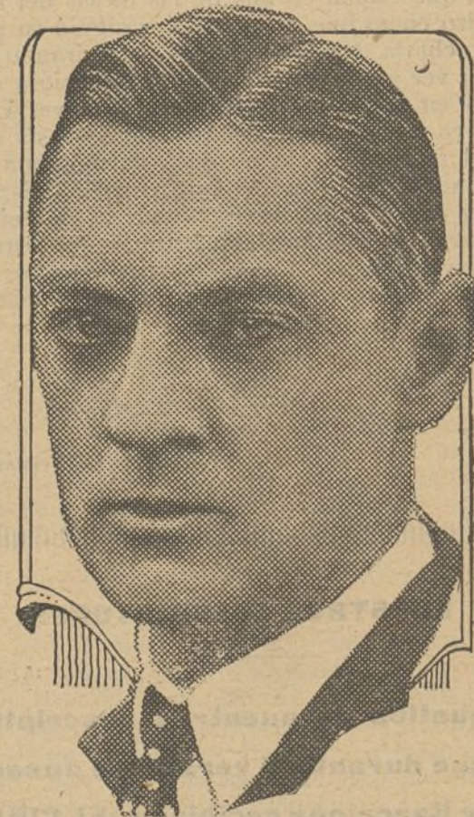
LIONEL BARRYMORE in PARAMOUNT-ARTICRAFT PICTURES Entre otras películas ha filmado últimamente la «Bestia humana» en la que hace una verdadera creación

Defectuosas y todo, preferimos las películas