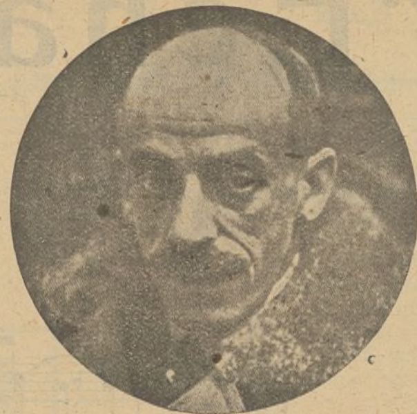
Gregorio Martínez Sierra

Su imaginación le sacaba de todos los apuros en que pudiera colocarle ante el Comité su de-