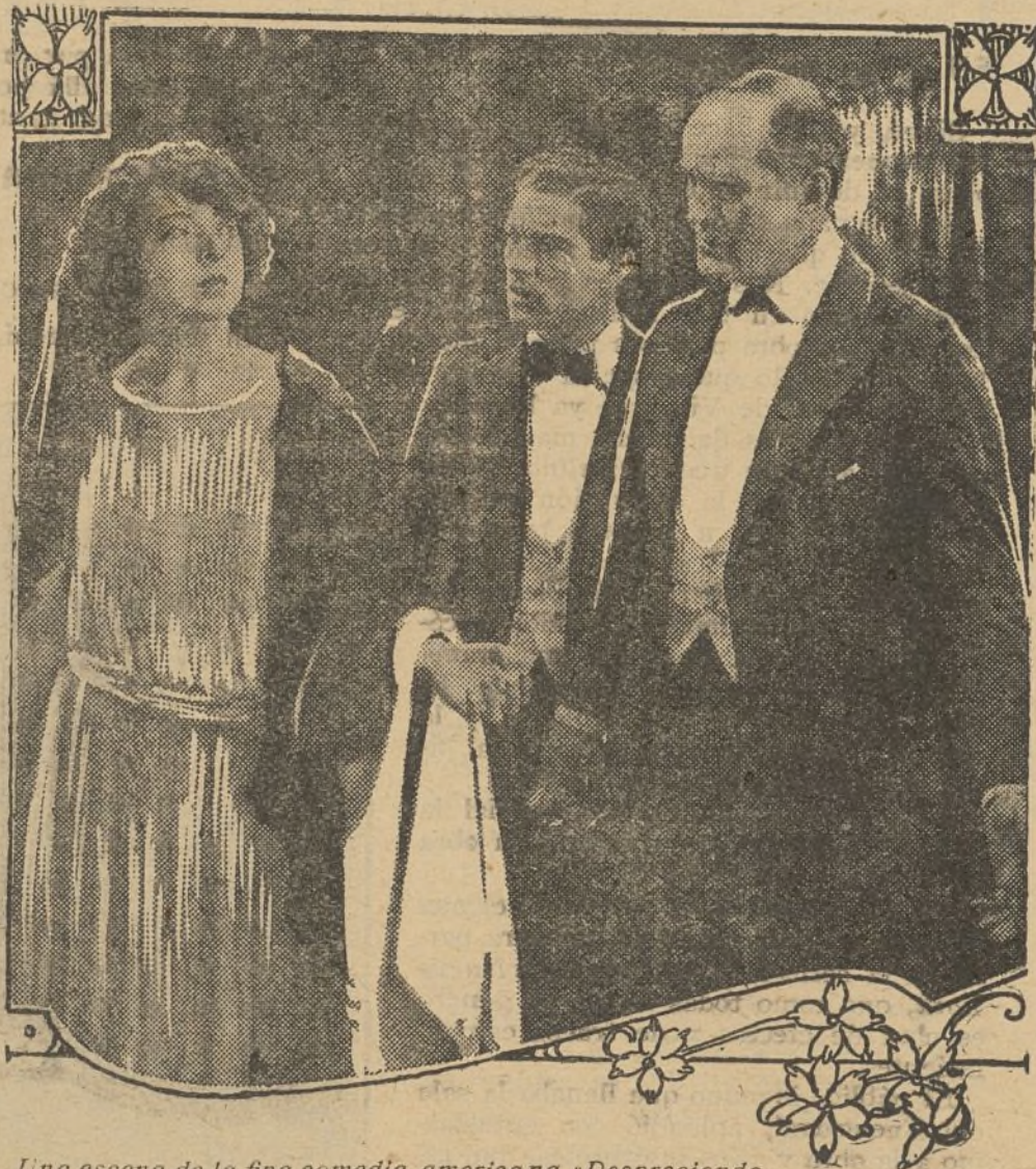
Una escena de la fina comedia americana «Despreciando a los demás» cuyo argumento damos en este número

Se le sugiere una idea salvadora... Carlos presentará a Estrell desde una cierta distancia, unos maniqués en cera, que él ha visto en un museo. Así, pues, roba tres de ellos y los coloca en su casa en una habitación con muy