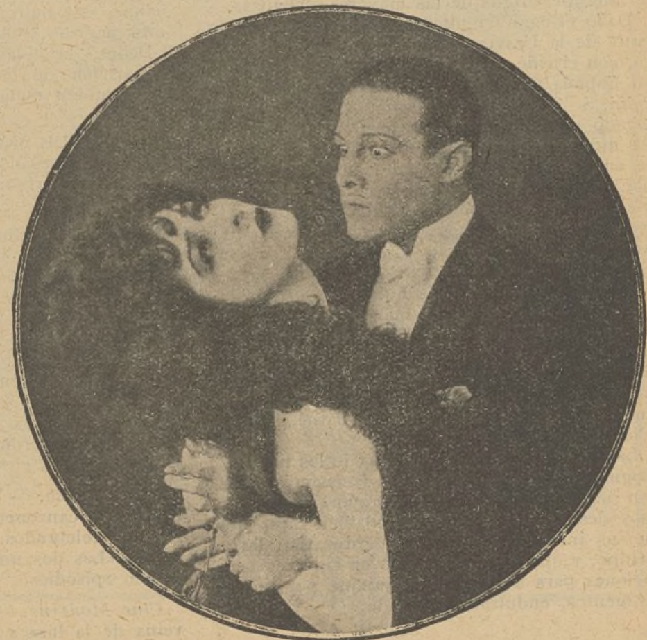
Alla Nazimova y Rodolfo Valentino, en una escena de «La Dama de las Camelias». El argumento de esta hermosa película lo ha editado «El Cine» y se vende en todos los kioscos y en nuestra Administración

Hoy Pathé-Cinema, a pesar de su gran caída, se ve lleno diariamente, siendo muchos los días que cientos de personas han tenido