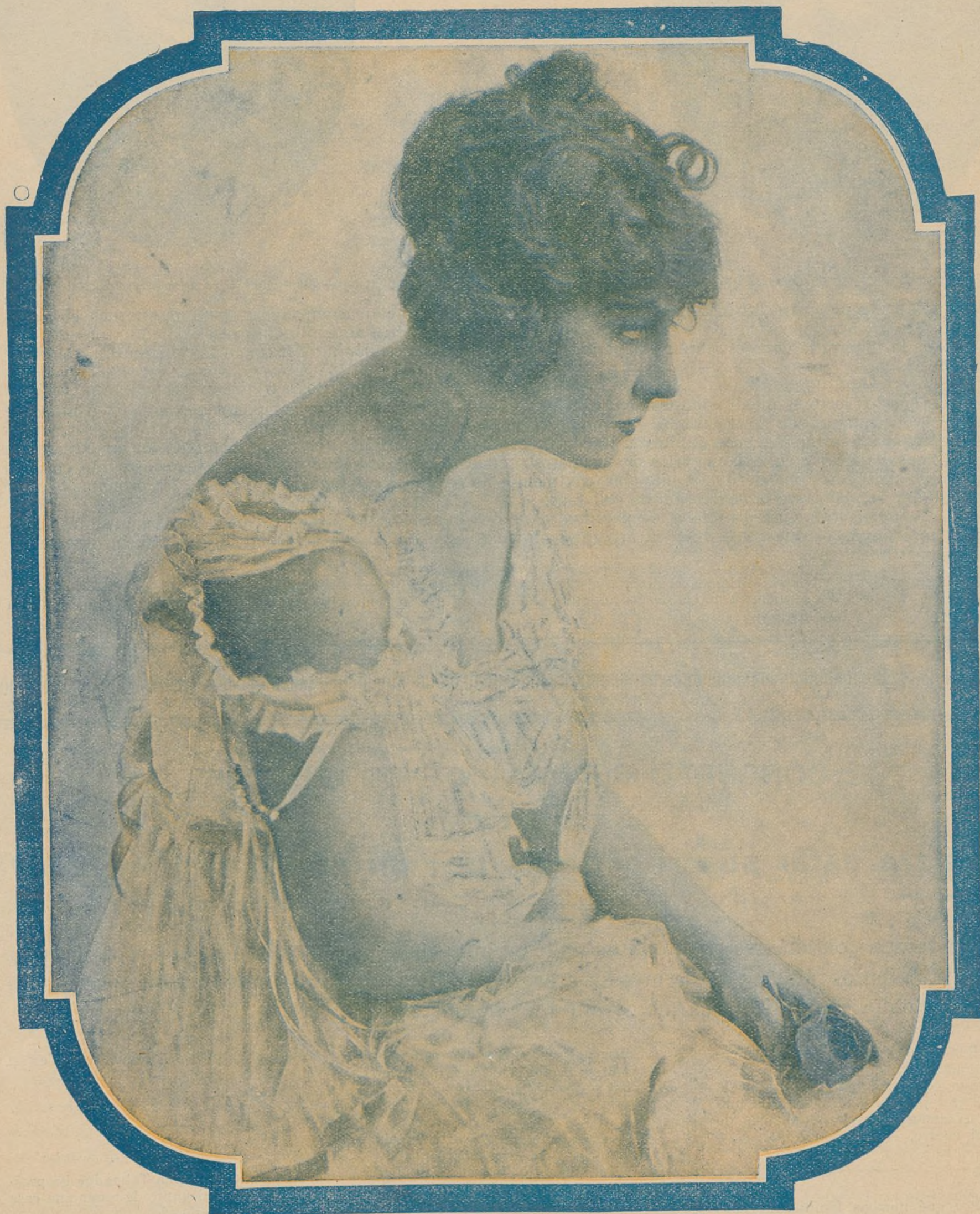
DOROTHY DALTON, hermosa intérprete de "Jaque-Mate" y otras muchas películas Paramount del PROGRAMA AJURIA.