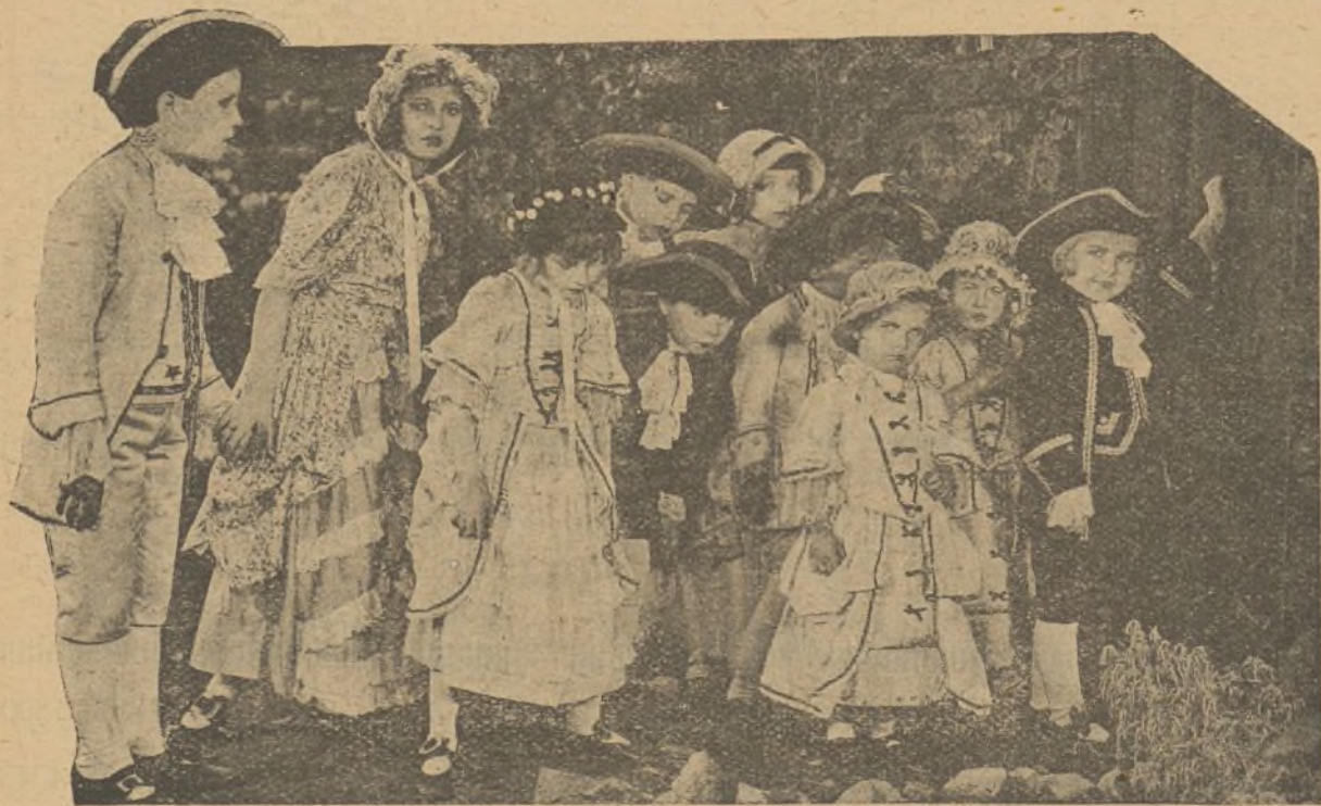
La compañía infantil de la Universal Film interpretando una escena de comedia

primer director de comedias, si me dejaría desempeñar un papel en una película en la que trabajaría en compañía de un perro amaestrado.