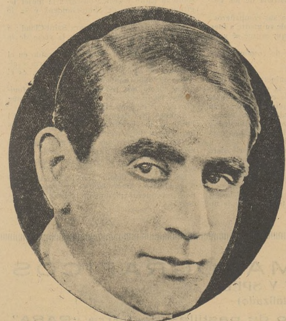
Eddie Polo, el popular artista cinematográfico

En el anuncio que en nuestro número anterior publicamos de la «Seleccine, S. A.», referente a las películas «Un novio demasiado perfecto», «La sombra del padre» y «Fatty en un día de campos», apareció en algunos números en lugar de la marca Paramount Pictures, otra que decía «Selecciones Capitolio».