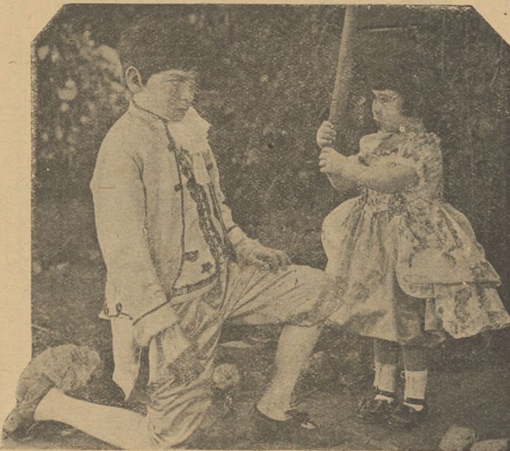
Baby es severa cuando su dignidad se lo impone y sabe poner una cara de circunstancias