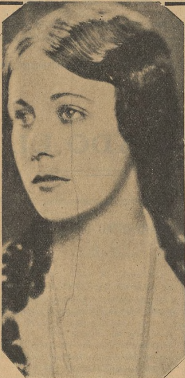
Virginia Valli, la gentil estrella americana

A los pocos minutos llegaba al aristocrático