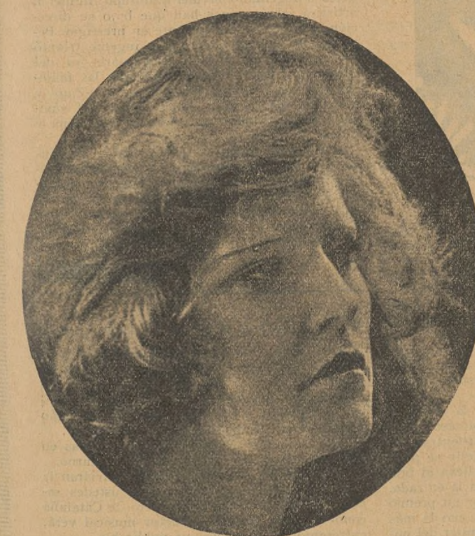
Un gesto admirable de la natabilísima estrella Mis Hansen

Desde que se ha inaugurado la temporada de verano, en los dos magníficos cinemas de la casa Vilaseca y Ledesma, y a pesar de la anomalía de las circunstancias, el público