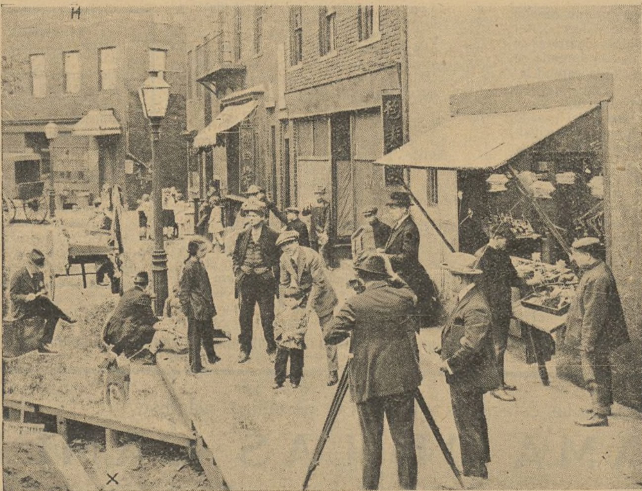
Toda esta calle, con sus tiendas, sus faroles, etc., ha sido construida para hacer una película. Véase (X) donde empieza la construcción

Claro es que si se trata de una película corriente, se apela a los trucos citados. Pero en otro caso, se llega frecuentemente a hacer hundir un barco, a destruir verdaderamente dos trenes, a quemar «de verdad» una casa construida para el caso.