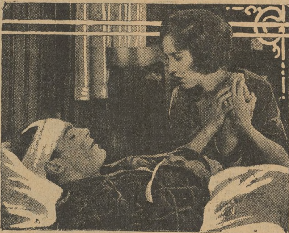
Una escena de la película en cinco partes «El policía fantasma»

Sale Nelly y se dirige a la casa del millonario, a donde llega en el momento en que la señora del millonario está ocupada probándose un abrigo de pieles que le acaban de traer. Como no le va bien, encarga a su doncella que lo entregue a la muchacha que lo ha traído, y