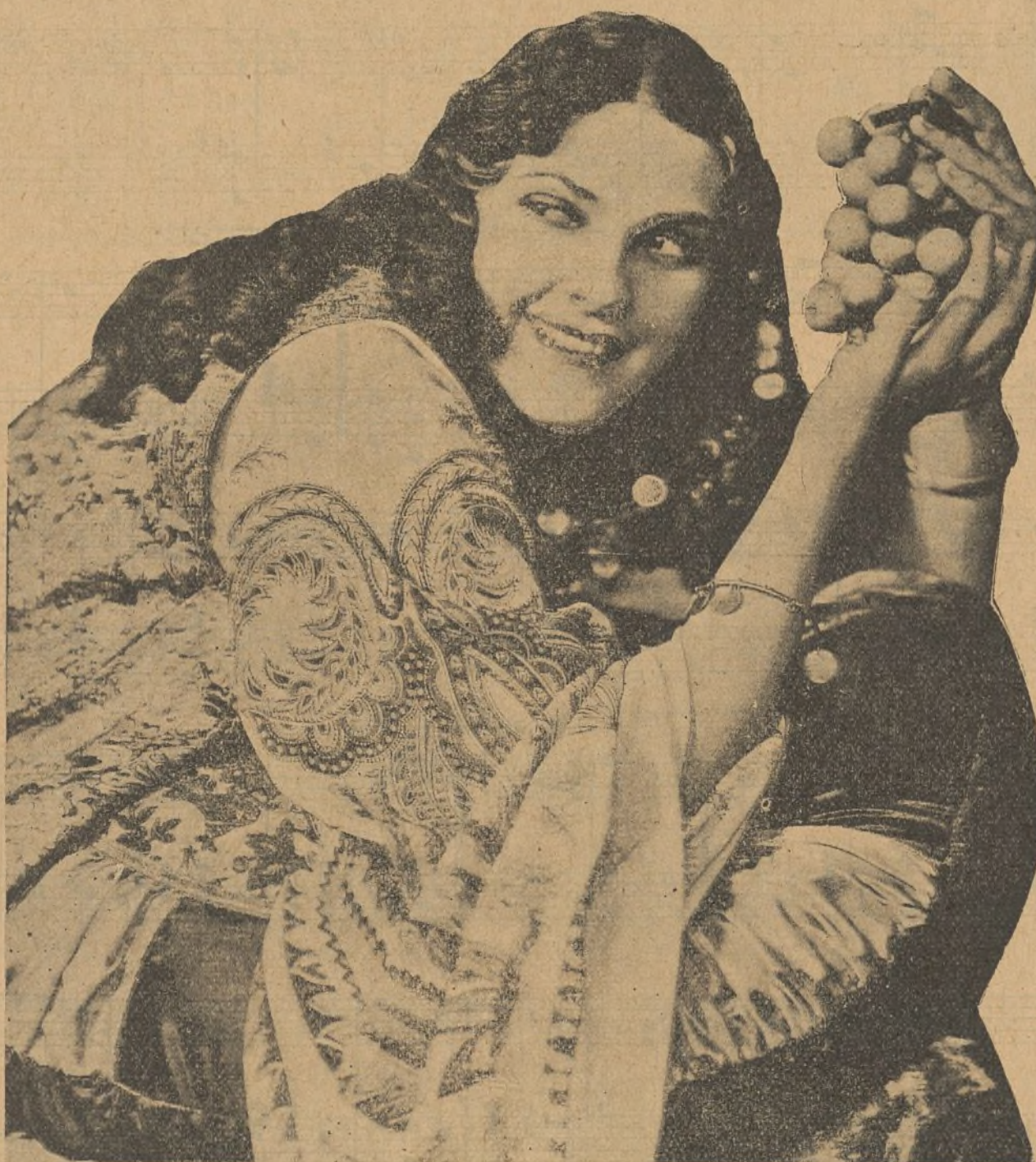
A la belleza de Priscilla Dean le sientan maravillosamente los atavíos orientales...

—Pero que le dieron también un marido... Priscilla Dean rompe a reír.