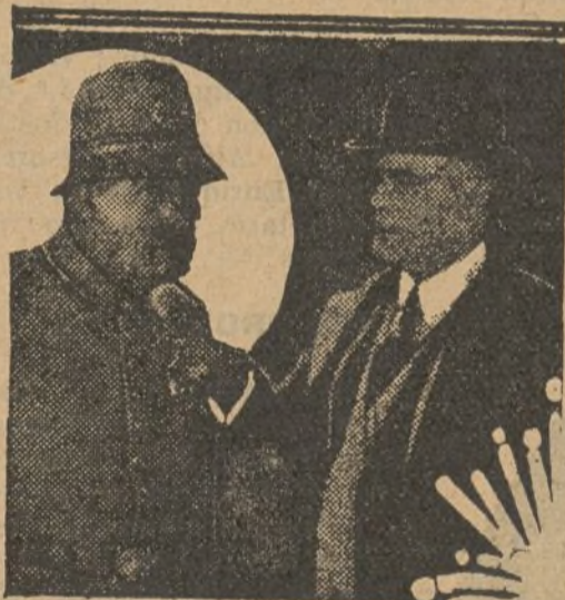
Los protagonistas de la película «El policía fantasma»

la doncella, confundiendo a Nelly con la chica del peletero, se obstina en entregarle el abrigo, que es magnífico. Nelly se resiste, pero la torpe doncella se obstina en que su señora le ha encargado que le dé el abrigo y Nelly acaba