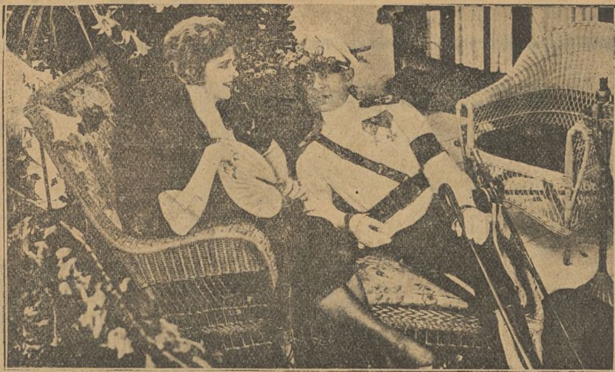
Miss Du Pont y Von Stroheim en una escena de «Esposas frívolas», a bordo del «Salem»

Se ha hablado mucho de como Von Stroheim autor, director y protagonista de «Esposas frívolas» (el hombre del gesto duro, el malvado de todos sus apasionantes cine-dramas, que ha logrado en-