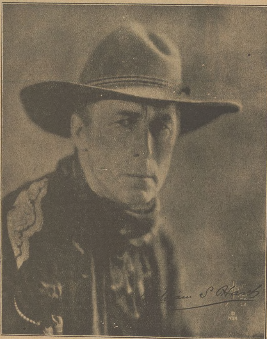
W. S. Hart, el artista americano que ha representado con más acierto los tipos de «cowboys».

Mr. Marcel L'Herbier ha creado un nuevo género de subtítulos muy originales. Las letras de un color rojo sobre fondo negro resaltan admirablemente y las palabras esenciales