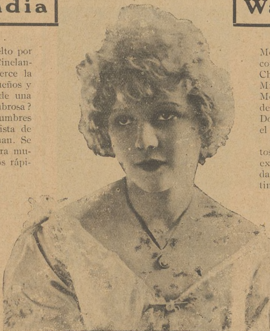
La encantadora artista Wanda Hawley