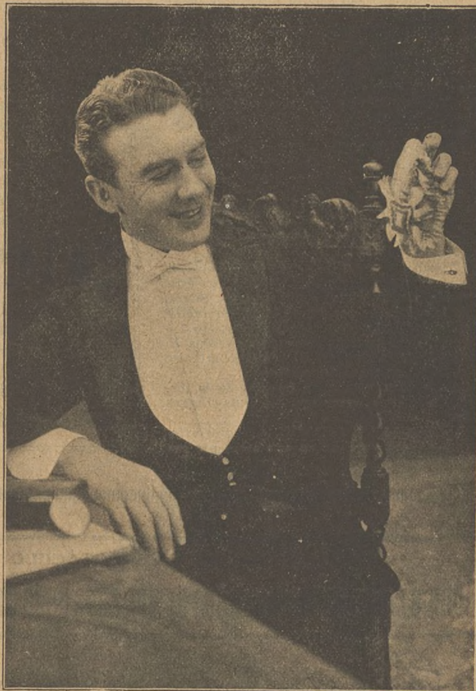
Tom Moore, primer marido de Mary Pickford y uno de los artistas más elegantes de la pantalla.