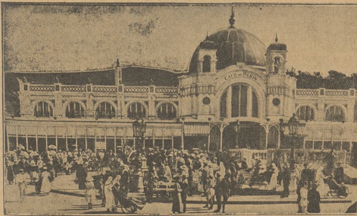
Vista de la plaza de Montecarlo con los edificios que se han reproducido con toda exactitud

Con todos estos datos puede comprenderse el éxito formidable que ha obtenido «Esposas frívolas» en aquellas capitales donde se ha presentado. Y puede comprenderse también cuán lejos estamos todavía de aspirar en España a una competencia con casas que como la Universal emplea en una sola película lo que no se gusta en la producción total española en varios años.