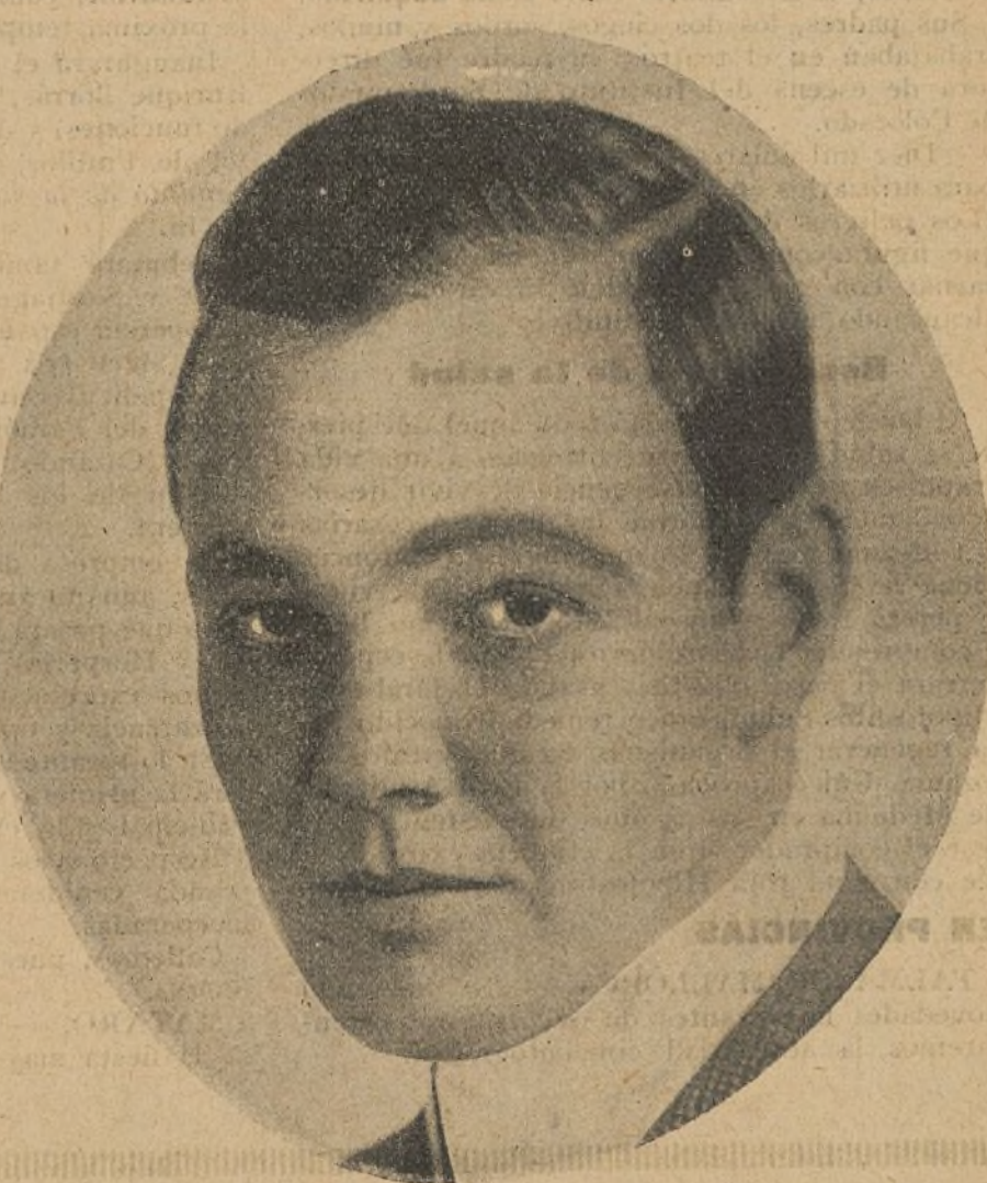
Charles Ray, al que hemos admirado recientemente en «La sombra del padre» y otras películas del Programa Ajuria

—El popular actor de las películas-series de