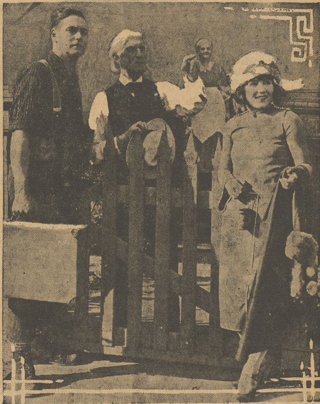
GLADYS WALTON IN "The LOVE LETTER" A UNIVERSAL-ATTRACTION

Una escena de la película «La Carta Amorosa»