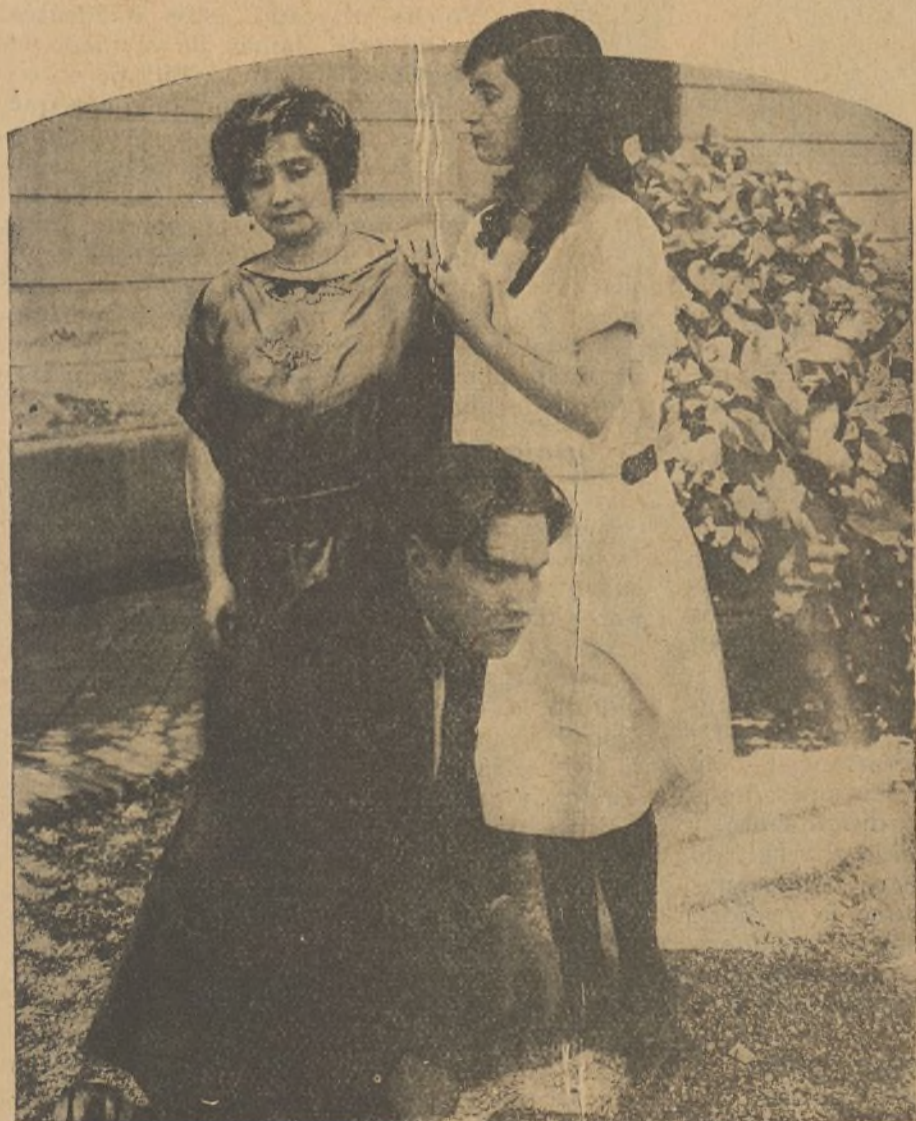
Algunas interesantes escenas de la película «Amor de campesino»

para salir en caravana y filmar las escenas exteriores aprovechando los paisajes maravillosos de nuestra tierra. Se titula la película ya terminada «Amor de campesino» y es un drama en cuatro partes en el que se revelan como estupendos artistas una porción de jóvenes de uno y otro sexo. Hemos visto fotografías que aun no dando una idea completa de lo que es la película que nos ocupa, sirve para demostrar plenamente que en orden a la mímica, al gesto, nada tienen que envidiar a los más celebradas estrellas de las grandes firmas.