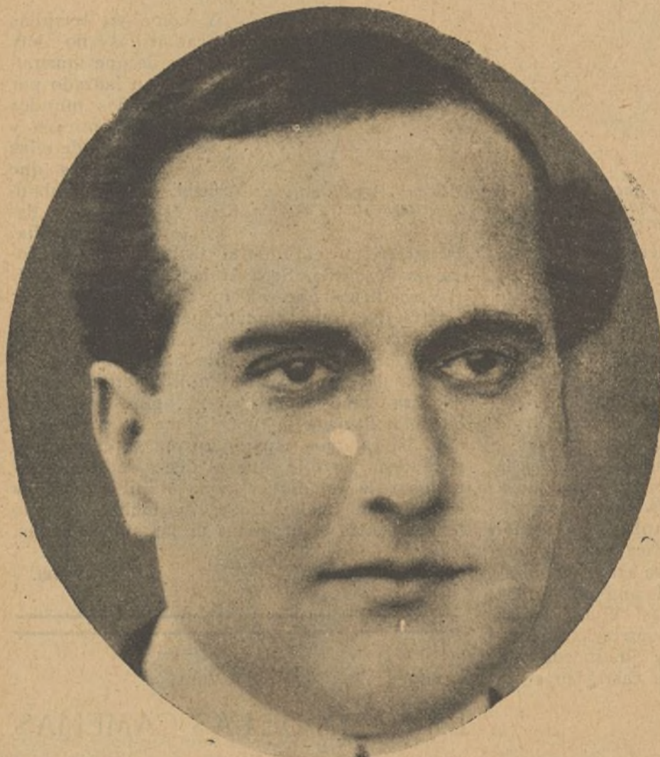
Gustavo Serena, quien, como es sabido, vuelve a trabajar para la pantalla

ca es la cinematografía norteamericana. Pero bien puede suponerse que no pasará mucho sin que en Italia, donde hubo un momento que funcionaron doscientos cincuenta estudios, con veinte mil artistas y empleados, vuelva a recobrar el séptimo arte el brillo que alcanzó entonces con Gustavo Serena, la Bertini, Hesperia, y tantos otros estrellas de glorioso recuerdo; así como es de presumir que Francia vuelva por sus fueros, para lo cual cuentan en general los países europeos con un valor imponderable que es la mayor sensibilidad de los autores de argumentos y la posibilidad por tanto de que las películas se acomoden más a nuestros gustos.