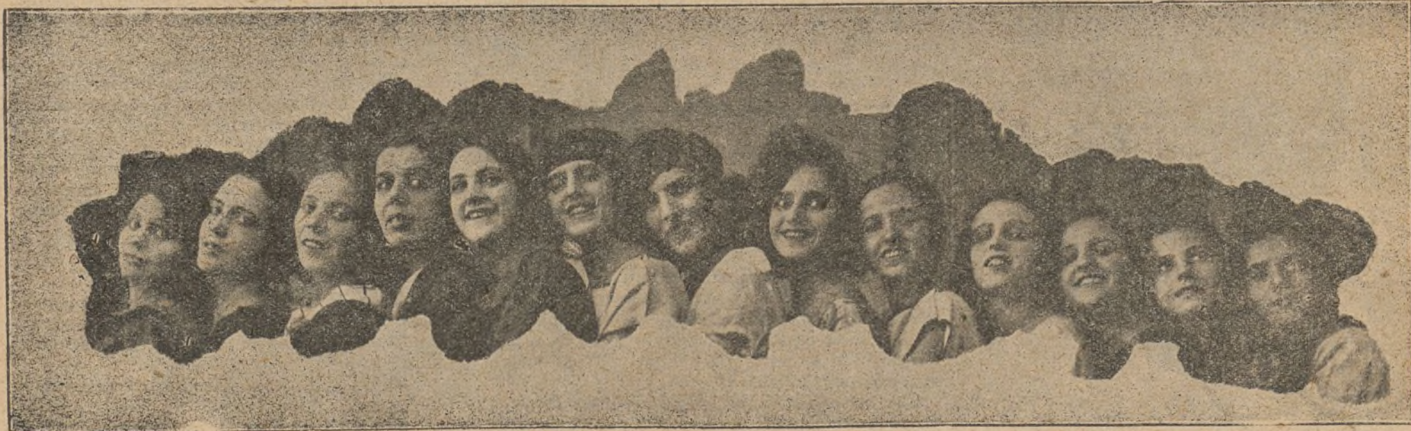
Cuerpo de baile de la Compañía de comedias líricas que actúa con gran éxito en el teatro Romea de Barcelona

Es lamentable que los que intervienen más directamente en el movimiento teatral hayan