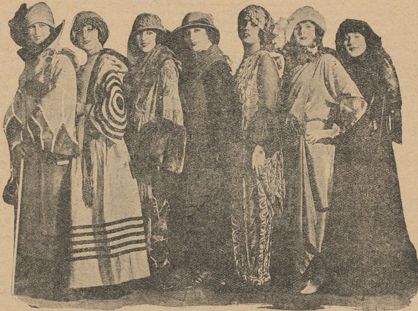
He aquí las siete mujeres que, con Gloria Swanson, figuran ser las esposas de Barba Azul. No es difícil comprender que Barba Azul las matara, si lo hizo para comérselas. Por que ¡cuidado que están ricas!

Por fin, como hemos dicho antes, al cabo de dos meses, tres días y dos horas, la colección de bellezas que debían tomar parte en la película «La octava es-