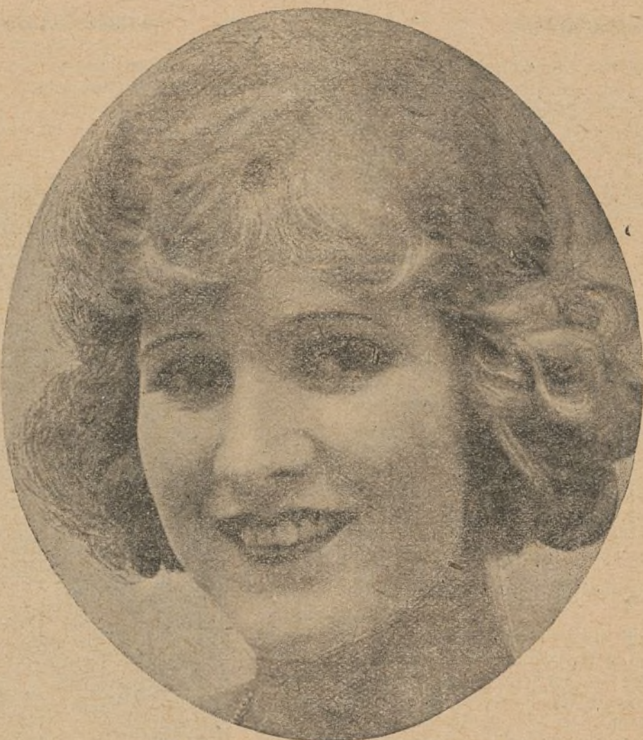
Mary Miles Minter, sobre cuyos apellidos se están haciendo tantos retruécanos en nuestro concurso de chistes

Fué el primer actor que la Famous Players envió a su estudio de Londres. No hace muchas semanas regresó a los Estados Unidos, ingresando inmediatamente en el cuadro artístico de los mencionados estudios en Hollywood.