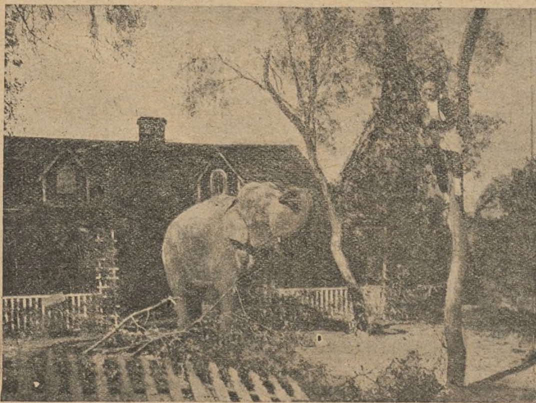
Una importante casa cinematográfica tiene encargada la custodia de sus estudios a uno de los elefantes de la «menagerie», el cual hace pasar un mal rato a un chino moreador

a nuestra mesa de trabajo. Producción inspirada, de estilo pulido, revela en sus estrofas una pluma de enjundia, profundo conocimiento de los preceptos de la Retórica y sobre todo un gran corazón de poeta, que comunica una cálida emoción al lector.