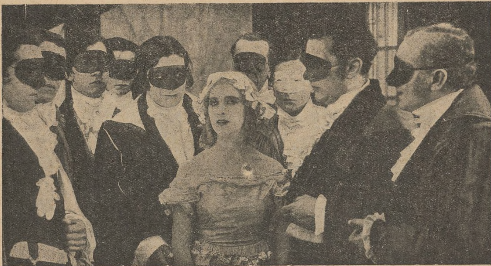
Una escena de la película «La hija de los traperos»

Blanche Montel, la monísima estrella de los teatros Gaumont, interpreta magistralmente el papel de «Marieta», la hija de los traperos.