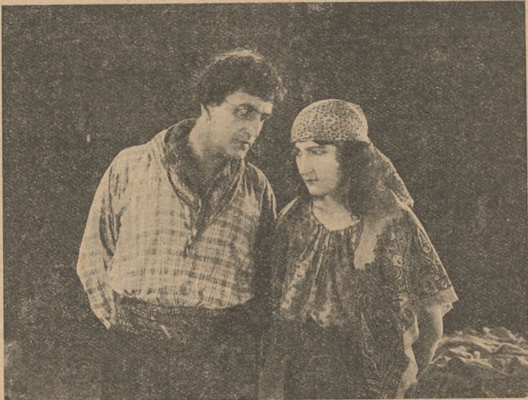
Una escena de «La Reina de los gitanos»