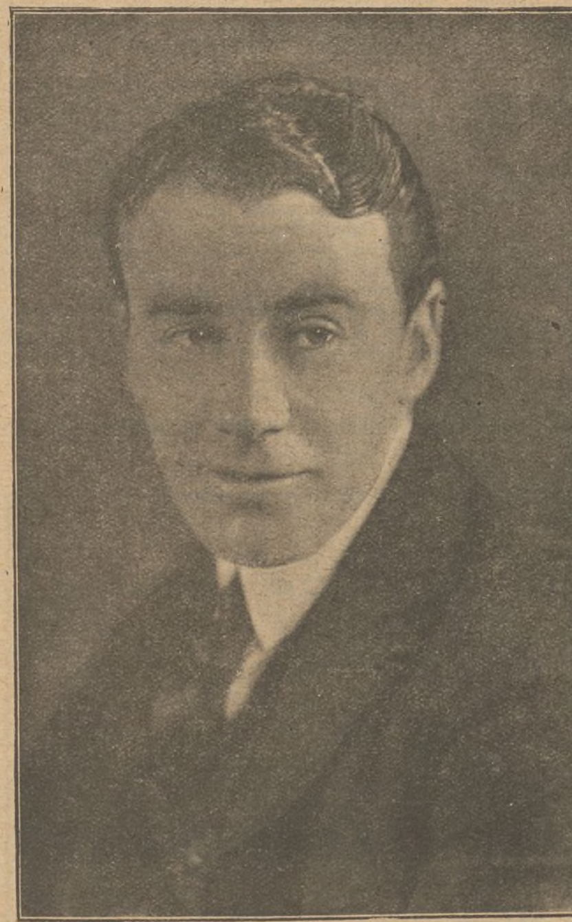
Tom Moore, el gran artista americano, protagonista de notables películas

—¡Encima de pisarme y de darme un trazo con esa porquería de sombrero, me suelta una grosería! ¡Pues vaya una señora mal educada!