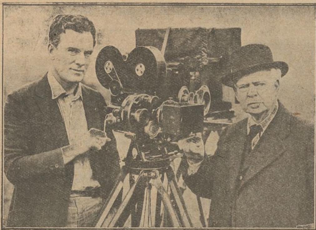
Thomas Meighan, el eminente primer actor, hizo recientemente una visita a su anciano padre, en Pittsburg y en la fotografía aparecen momentos después de filmar el eminente primer actor una escena de la película «De vuelta a casa sin dinero». Bien se advertirá que el título de la film no guarda relación con la verdadera posición de Meighan

En París funcionan actualmente varias agencias de excursiones a las regiones francesas devastadas, las cuales llevan a sus numerosos clientes, generalmente extranjeros, en grandes autocars, desde los cuales pueden contem-