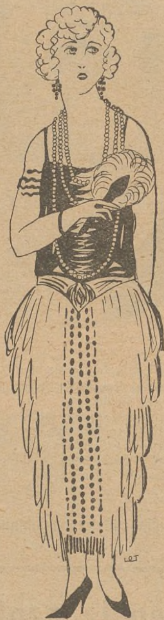
Una hermosísima señora, llovida de las nubes...