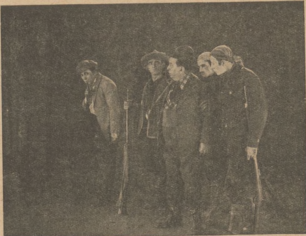
Otra interesante escena de «La Reina de los gitanos»