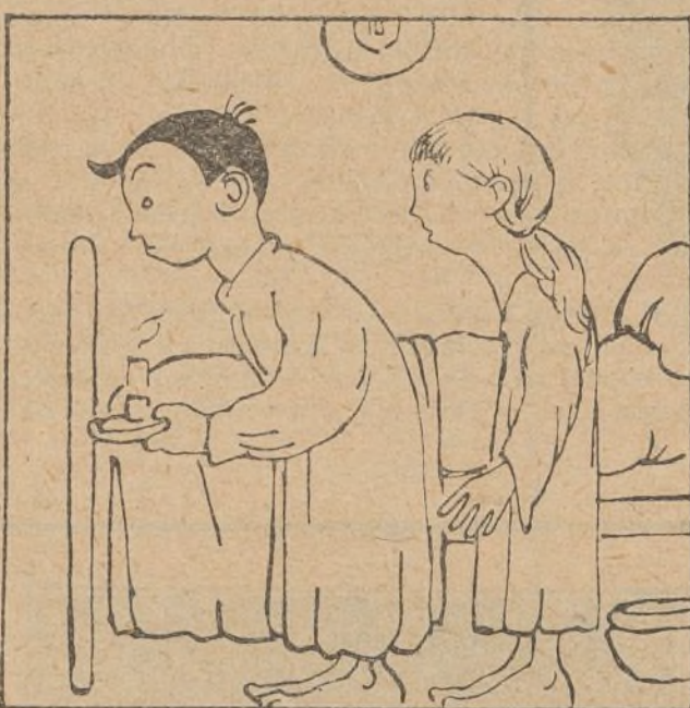
8. Polito y Teresita, que estaban en el lecho, al escuchar el ruido se ponen en acecho.