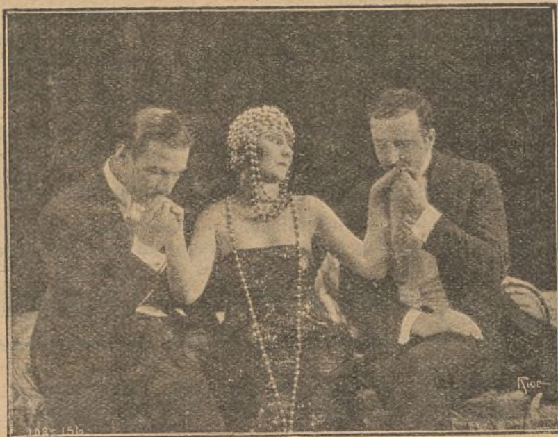
Una escena de la cinta «Eugenia Grandet»

LOS nombres de los INTÉRPRETES, el del DIRECTOR y del AUTOR de la obra, son garantías más que suficientes para que el público inteligente esté convencido de que va a ver una verdadera joya cinematográfica, de las pocas que sin necesidad de «reclame» ni adjetivos, constituyen un triunfo y dejan un recuerdo grato e imperecedero.