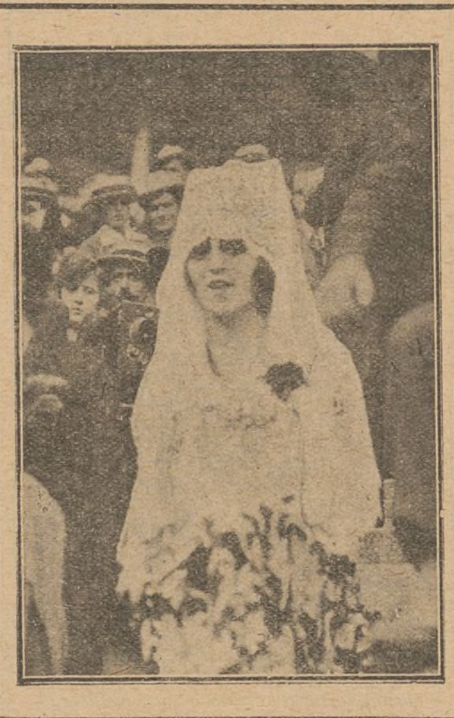
Maria Jacobini, bellísima actriz cinematográfica que está filmando en la actualidad una interesante película. Tocada con la clásica mantilla española, la célebre estrella italiana se presenta con toda la elegante gracia de una andaluza