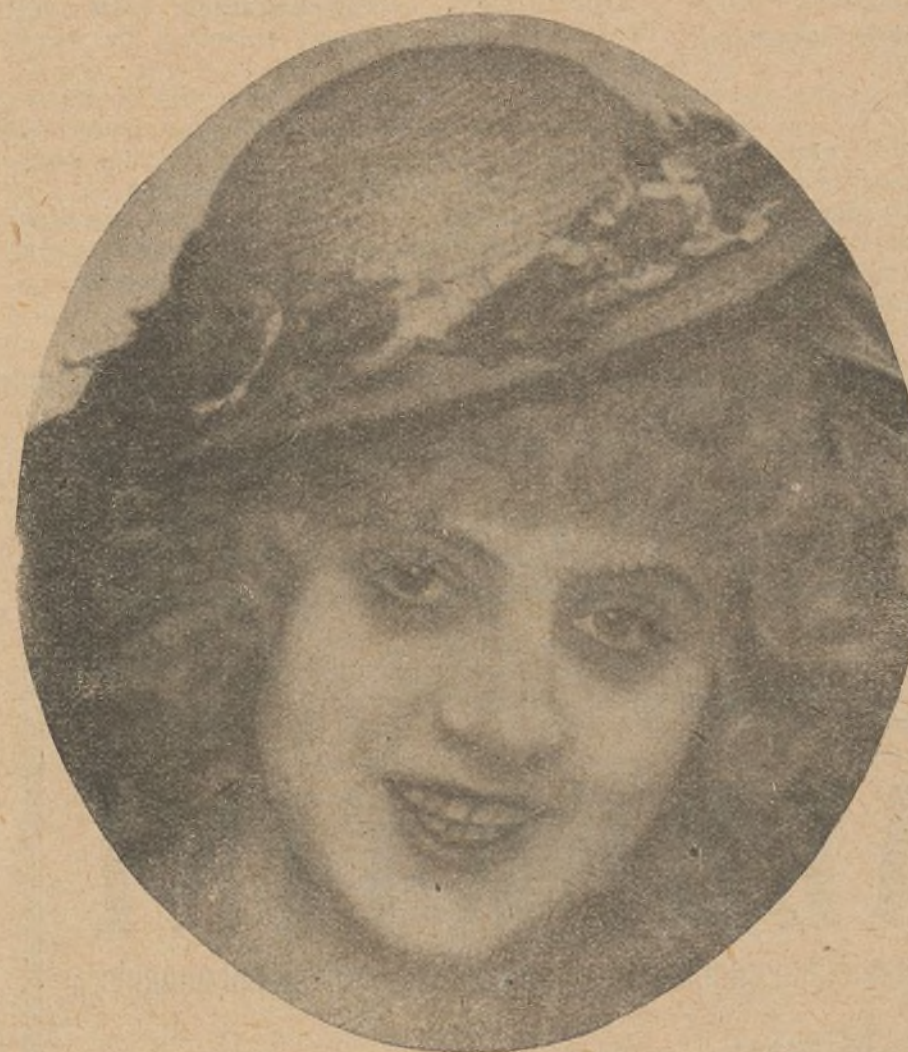
Ossi Oswalda, cuya extraordinaria belleza y arte exquisito podremos admirar nuevamente en algunas interesantes películas

Este arrojado y famoso artista, tiene un concepto grande de la realidad en los films. Sus arriesgadas ascensiones por cables y cuerdas, sin importarle para nada el peligro, dan buena prueba de ello.