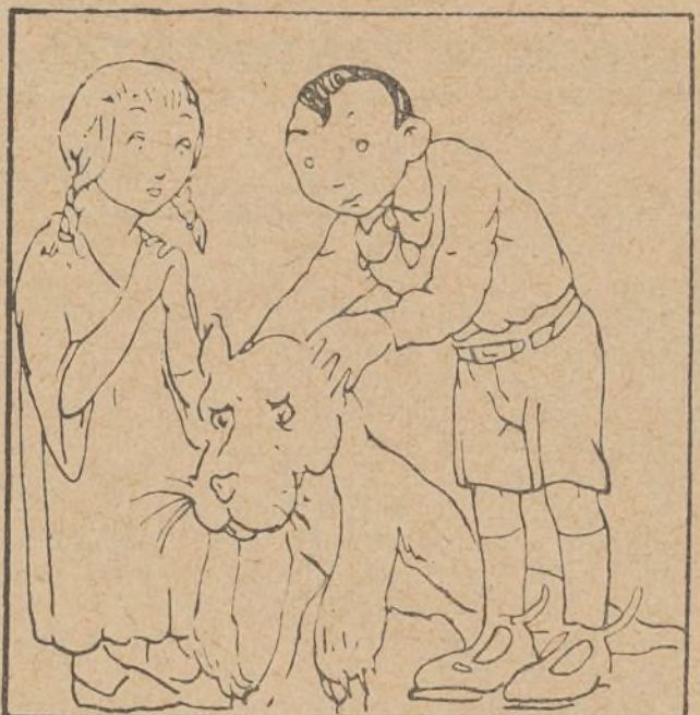
10. Con la piel de leona que su cuarto ornamenta, el perro toma el aire de una fiera cruenta.