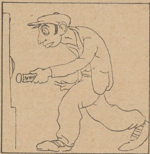
7. La casa de Polito ha asaltado un ratero con el intento alevé de llevarse el dinero.