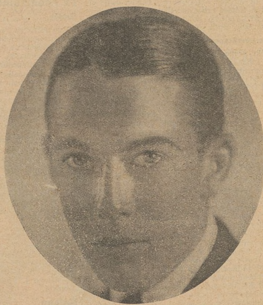
Jack Pickford, que demuestra una vez más su arte en la notable película «El desquite de Garrison», de la casa «Artistas Asociados»

El sábado se estrenó en el Kursaal otra nueva película de singulares méritos, titulada «La reina de la moda», que es, en el