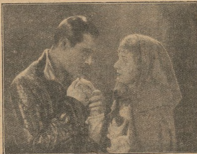
Una escena de la cinta «Eugenia Grandet»

donde se está exhi- biendo dia- riamente, ha constituido el mayor y más indis- cutible éxito de la temporada