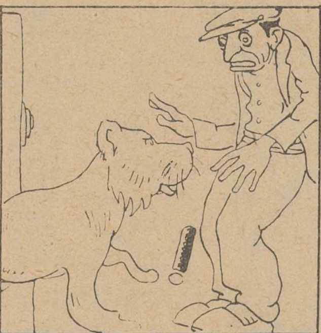
11. Y a su vista el ratero se queda de una pieza como Charlot al darle un palo en la cabeza.