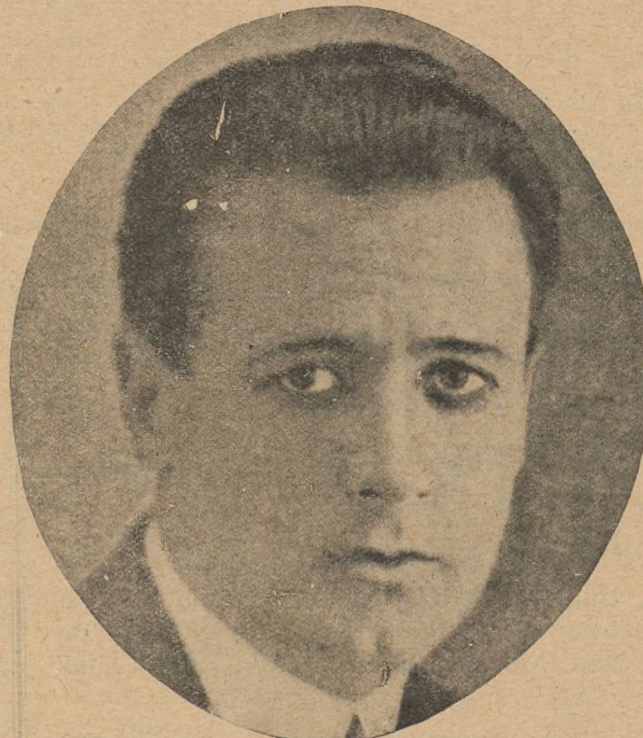
El excelente actor cinedramático T. Carminati

«El crimen de Millefleurs-Palais», es una película de atracción. Posee un argumento interesante y sugestivo, una presentación irrefutable, y la actuación de Maciste, simpá-