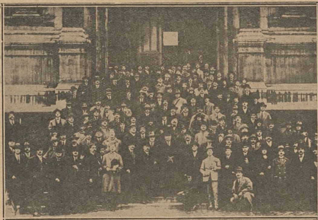
PARÍS.—Grupo de delegados extranjeros en el Congreso Internacional de Cinematografía, reunidos en el «Conservatoire National d'Arts et Metiers» rodeando a Mr. Lumière, inventor del cinematógrafo (X) al que hicieron objeto de un cariñoso homenaje

¿Habrá alguna rectificación a la noticia dada por un diario francés, que atribuía el record de la paternidad a un padre con 39 hijos?