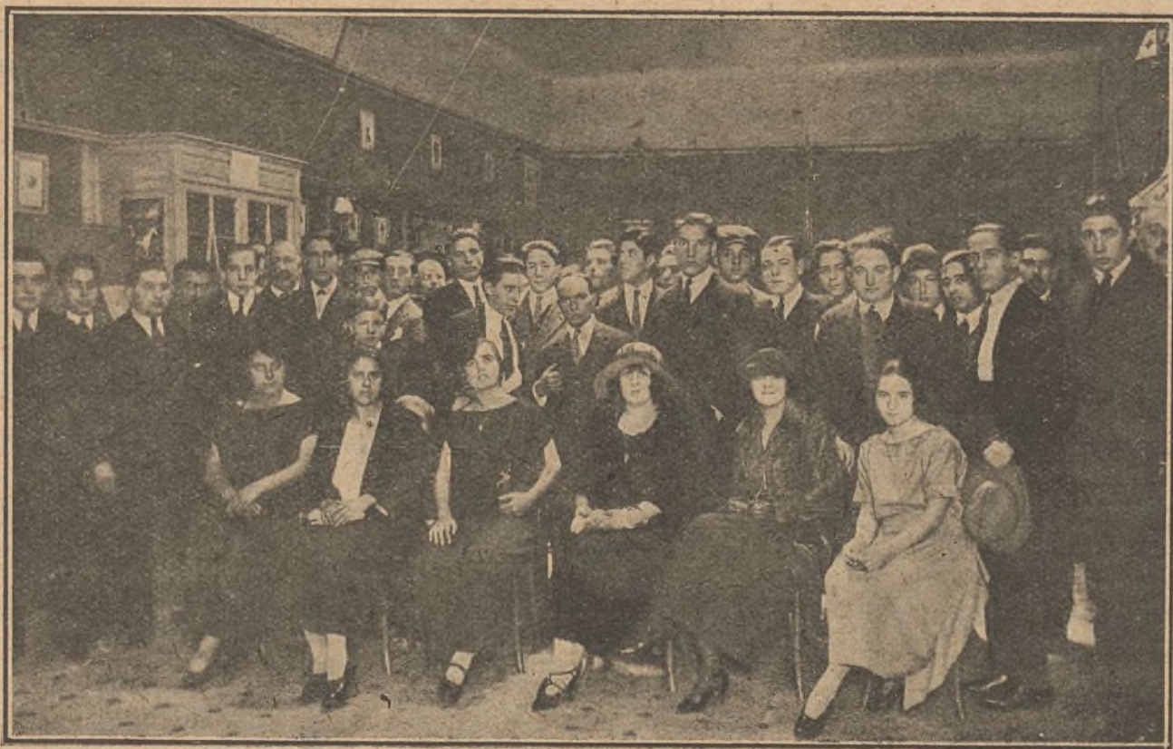
Grupo de concurrentes a la primera reunión celebrada en el Teatro Goya, de Barcelona, para tratar de la constitución de la «Sociedad Española de Amigos del Cine».

La correspondencia debe dirigirse al Director de EL CINE con el epígrafe «Para la Sociedad de Amigos del Cine».