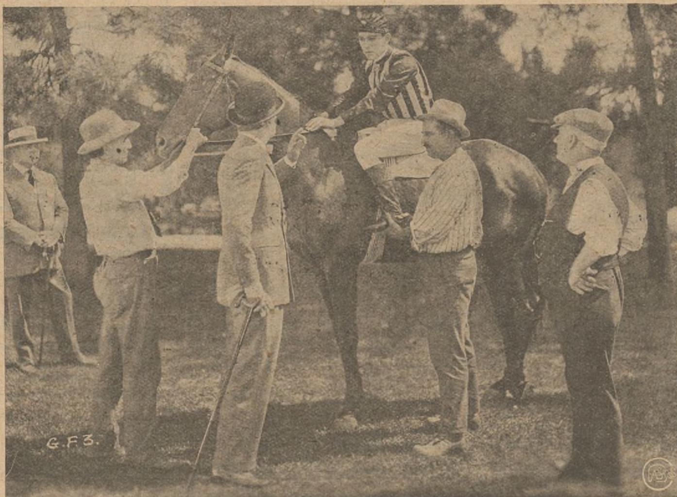
Jack Pickford en «El desquite de Garrison», interesante película de los «Artistas asociados», que se ha pasado últimamente con resonante éxito en el Salón Cataluña, de Barcelona

William, se presenta en su casa un agente de policía con el fin de prenderle por la denuncia criminal que Penech ha presentado por tentativa de asesinato. Nora al conocer los propósitos de Penech, temiendo por la vida y la fortuna de William, se persona en las oficinas del agente y le amenaza con un proceso si no depone su actitud perversa. Allí es sorprendida por William, que interpretando torcidamente la presencia de Nora en casa de