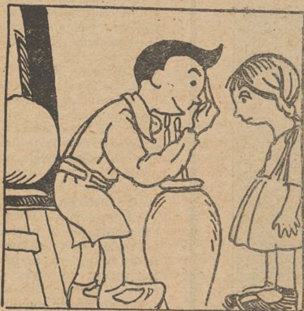
16. ¿Qué hacer? Su duda dura apenas un momento, que es Polito muchacho ágil de pensamiento.