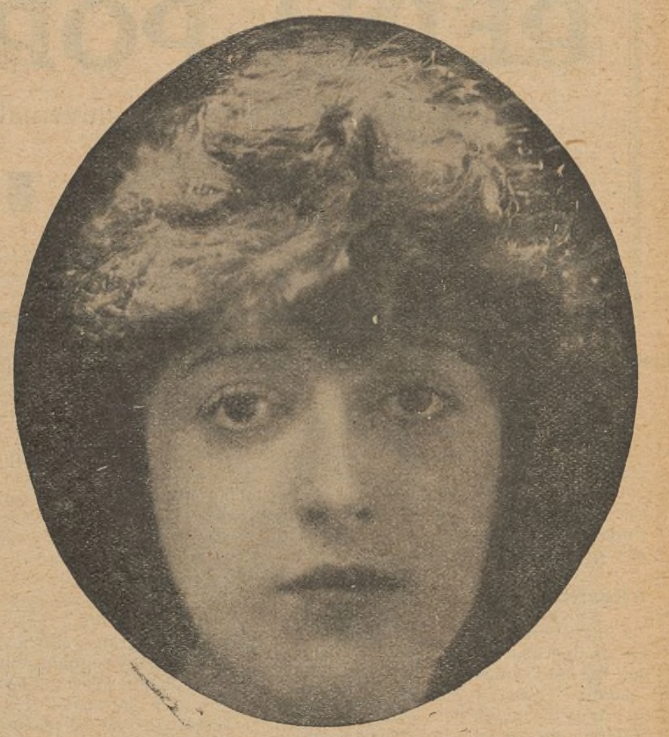
Mabel Normand, la deliciosa ingenua americana

Otra de las notas simpáticas de esta producción, es que constituye un documento de gran valor, pues figuran en ella bellos panoramas de los que tanto