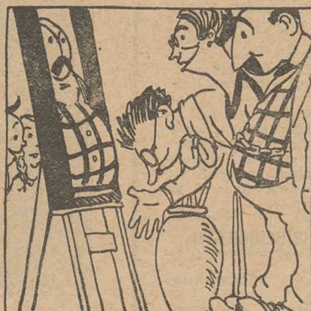
18. Y luego, ante el retrato, no es elogio el que llueve para el tío, que pinta que parece relieve.