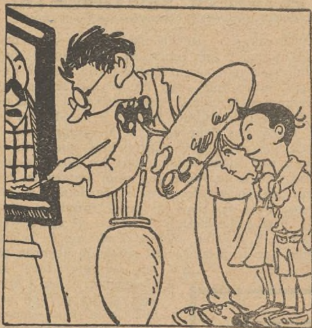
13. El tío de Polito, que es pintor afamado, en su taller trabaja y un cuadro ha terminado.