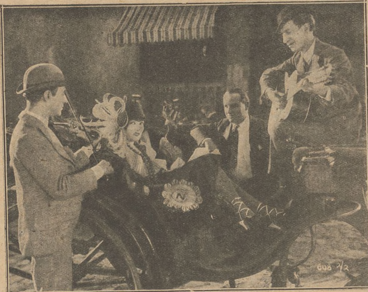
Durante un intermedio en la realización de la película «Zazá», Gloria Swanson da un paseo en coche, entretenida con las bromas de algunos compañeros

callejera». Han sido construídos 40 decorados diferentes, entre ellos tres magníficos castillos de la época de Isabel de Inglaterra. El joven y célebre «metteur-en-scène» Marshall Neilan que ha dirigido varias de las mejores producciones de la gentil Mary Pickford, ha sido contratado como «metteur-en-scène» para dirigir «Dorothy Vernon de Haddon Hall».