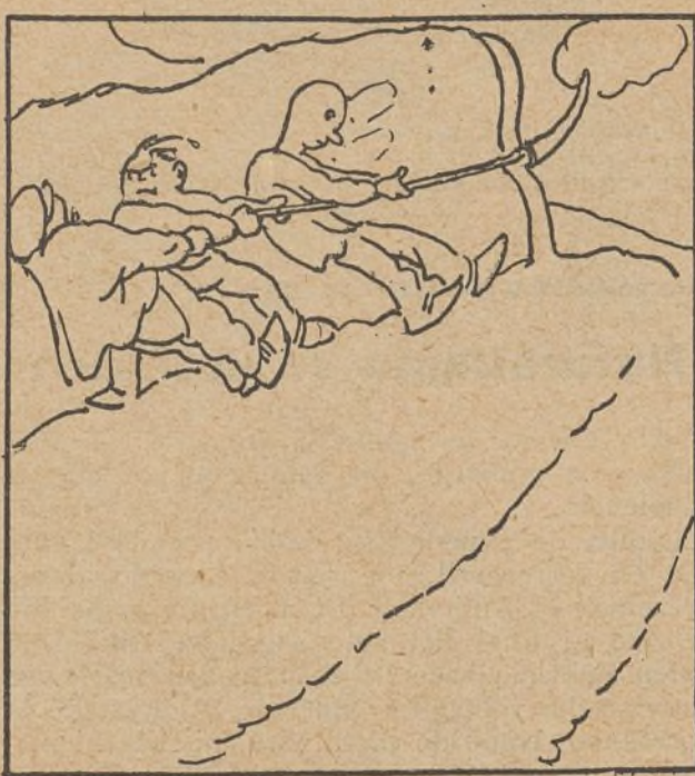
5. Y sacando reservas de fuerza, los mastuerzos unen en uno sólo sus máximos esfuerzos.