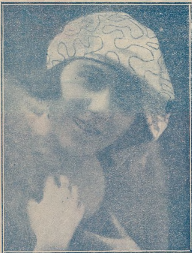
Una nueva peliculera

Ojos castaño claro cabello castaño os- curo, estatura 1'57.