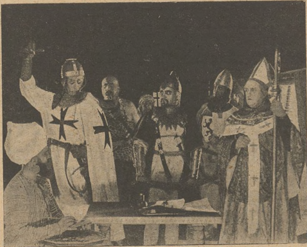
Una escena de «Nathan el Sabio»