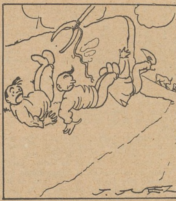
6. Los valientes se caen... de espaldas. A lo lejos nuestros amigos ríen con risa de conejos.