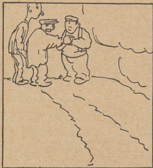
4. Por lo cual nuestro hombre acude a unos colegas los cuales dos deciden ayudarle en la brega.