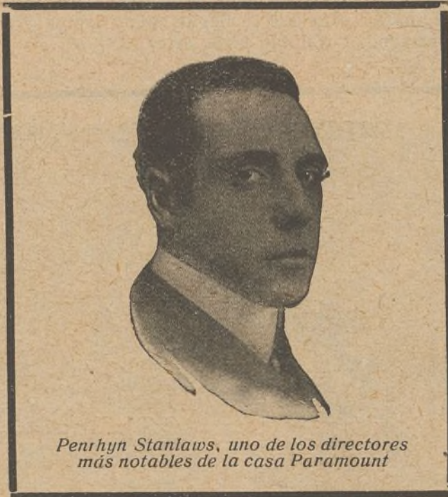
Penrhyn Stanlaws, uno de los directores más notables de la casa Paramount

F. Marion Crawford daremos próximamente «En el palacio del Rey», de la época romántica española; de Vicente Blasco Ibáñez, «Los enemigos de la mujer», representando los principales papeles Lionel Barrimore y Alma Ru-