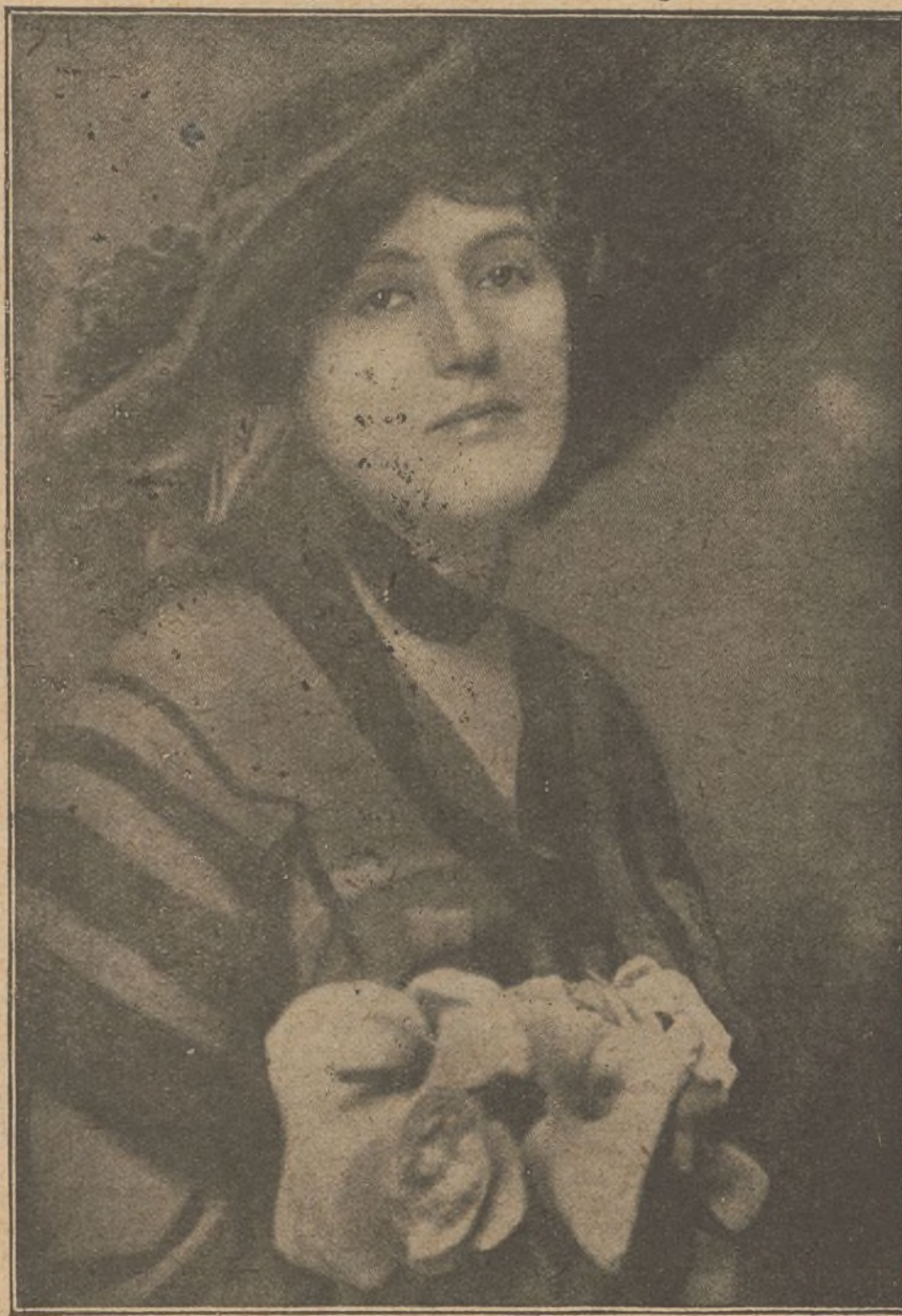
Hesperia, la genial estrella italiana protagonista de «La hora terrible»

Los millones del tío han normalizado la situación de los Villa, devolviéndoles el bienestar. Los talleres Villa están en su apogeo, y en la familia reina, con la opulencia, una relativa felicidad, porque Marina, desde la muerte