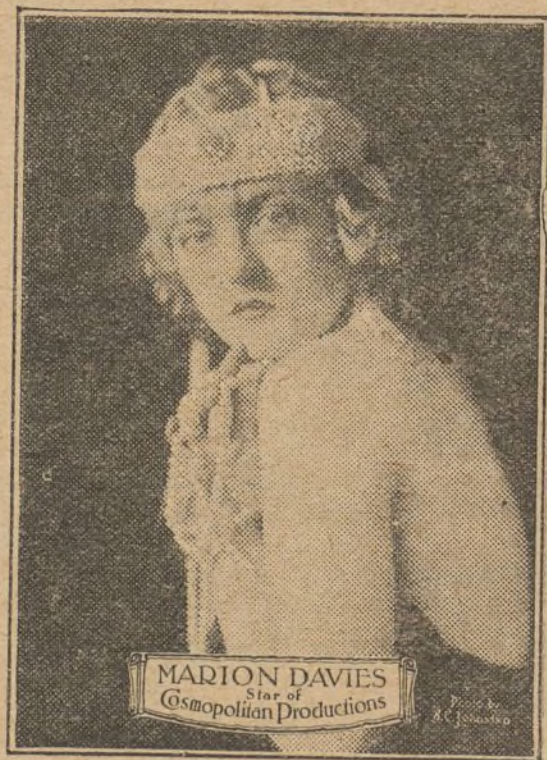
Marion Davies, una de las jóvenes estrellas de la Paramount

Cine La Protectora. — También ha sido pró-