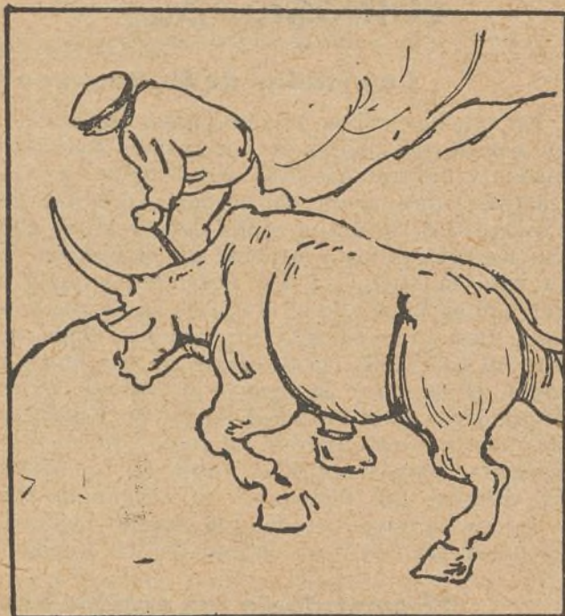
1. Un payés lleva un día una vaca al mercado. Uno y otro caminan con un andar pausado.