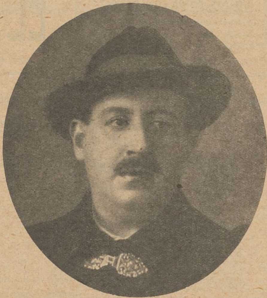
«EL CABALLERO AUDAZ»

—Si no lo sé. Ellos alegan que la película es irreverente y resulta todo lo contrario: un