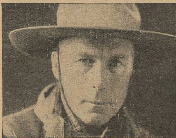
...Y he aquí eternizado también el incopiable gesto característico de William S. Hart

Estaba de expedición; había pasado la noche en ferrocarril, me sentía cansado al representar el Aníbal de El Aventurero . Sabido es que al final del acto segundo, Aníbal, a quien Fabricio hace beber para sonsacarle, se emborracha y luego se duerme. Representé la borrachera como de costumbre, ni más ni me-