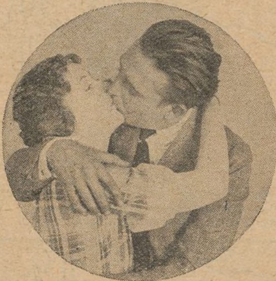
El cinematógrafo como ningún otro arte eterniza los más bellos momentos plásticos. He aquí el infortunado Wallace Reid dando un beso inacabable a Lois Wilson

Como decimos más arriba, asistió a la reunión «El Caballero Audaz», autor de la película «La sin ventura».