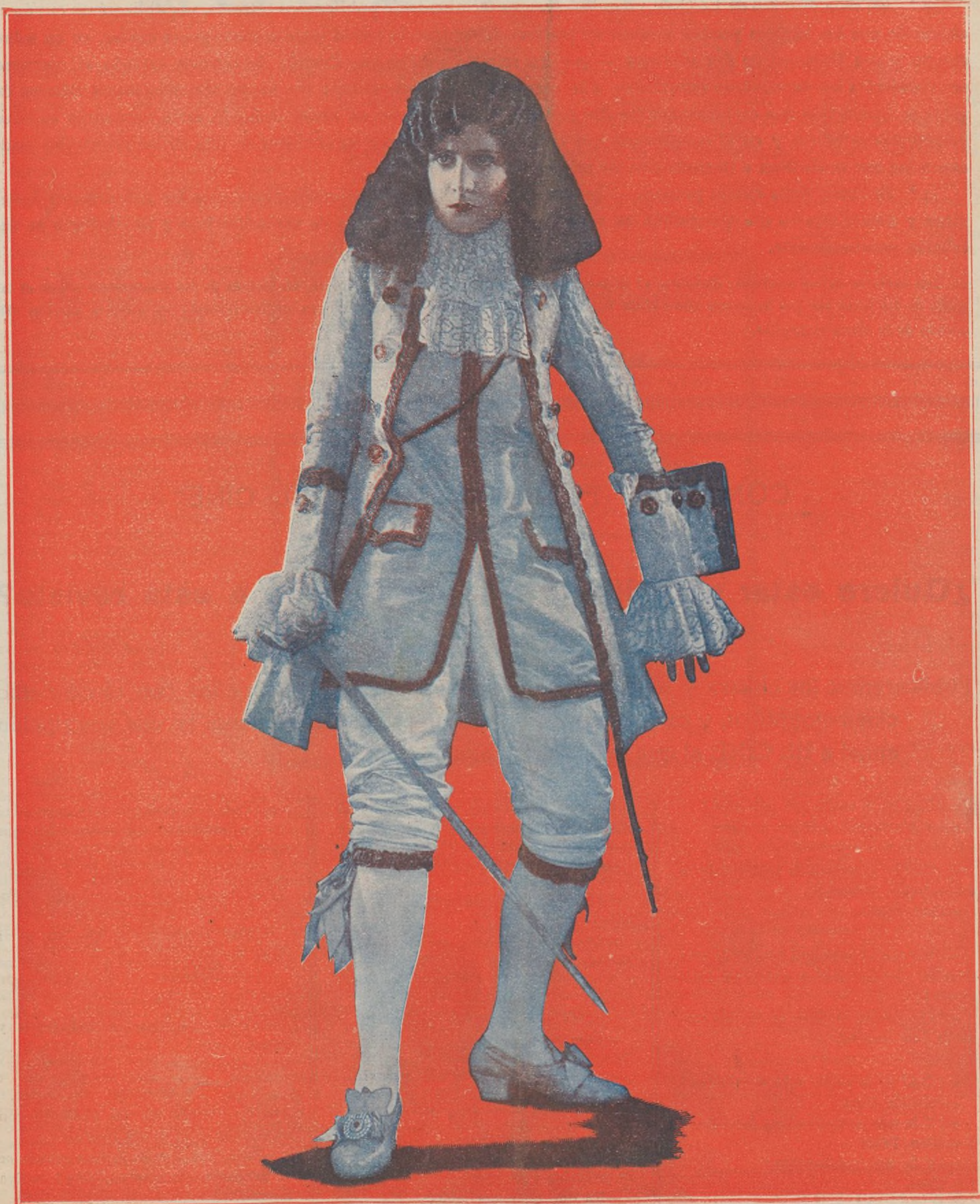
VIRGINIA VALLI, una de las más rutilantes estrellas de la constelación de la UNIVER- SAL, en una interesante escena de la hermosa Super-Joya de la referi- da marca «Una dama de calidad», próxima a ser estrenada en España