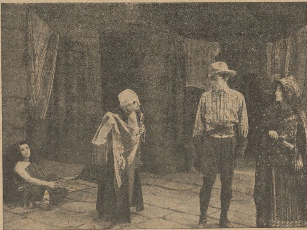
Una escena de «La Reina de los gitanos»

Llama la atención de Vidocq un extraño conciliábulo que el marqués de la Roche-Bernard sostiene con un hombre vestido con un dominó rojo y, cual no será el asombro de Vidocq al ver, a través de una ventana que da al jardín, al marqués introducirse en el gabinete de trabajo del señor de Camptocé abrir el secreter, examinar el contenido de una cartera y cerrar el mueble sin tocar nada. En este momento Coco Lacour penetra bruscamente en la habitación gritando: ¡al ladrón! ¡al ladrón!... Alarma; escándalo... Coco acusa enérgicamente al marqués delante del señor de Camptocé y de sus invitados, mas Vidocq interviene y afirma