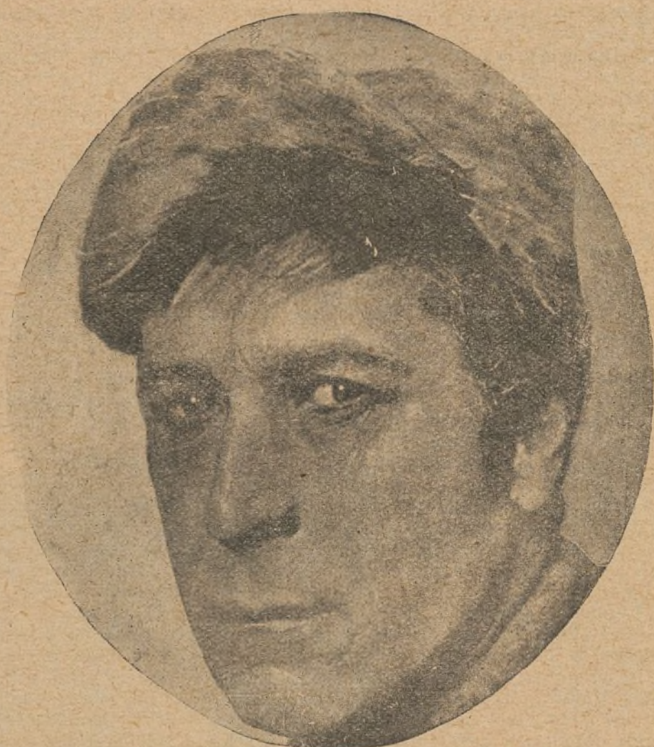
William S. Hart, insuperable protagonista de las películas de aventuras

El sport es uno de los medios hoy recomendado para la reconstitución física; el aire, el sol y la actividad constituyen un buen tónico; pero cuando el enervamiento, la inapetencia, los desarreglos del organismo y la neurastenia no ceden, hay que ayudar a la naturaleza con un tónico que le haga recobrar las fuerzas y la plenitud de la vida. Entre todos los conocidos y el que se considera más eficaz y de éxito inmediato, es el Jarabe de Hipofosfatos Salud, único aprobado por la Real Academia de Medicina con sus 32 años de existencia. Todo frasco legítimo ostenta con tinta roja las palabras «Hipofosfatos Salud» en su etiqueta exterior, pues es de advertir que con frecuencia se ofrecen imitaciones.