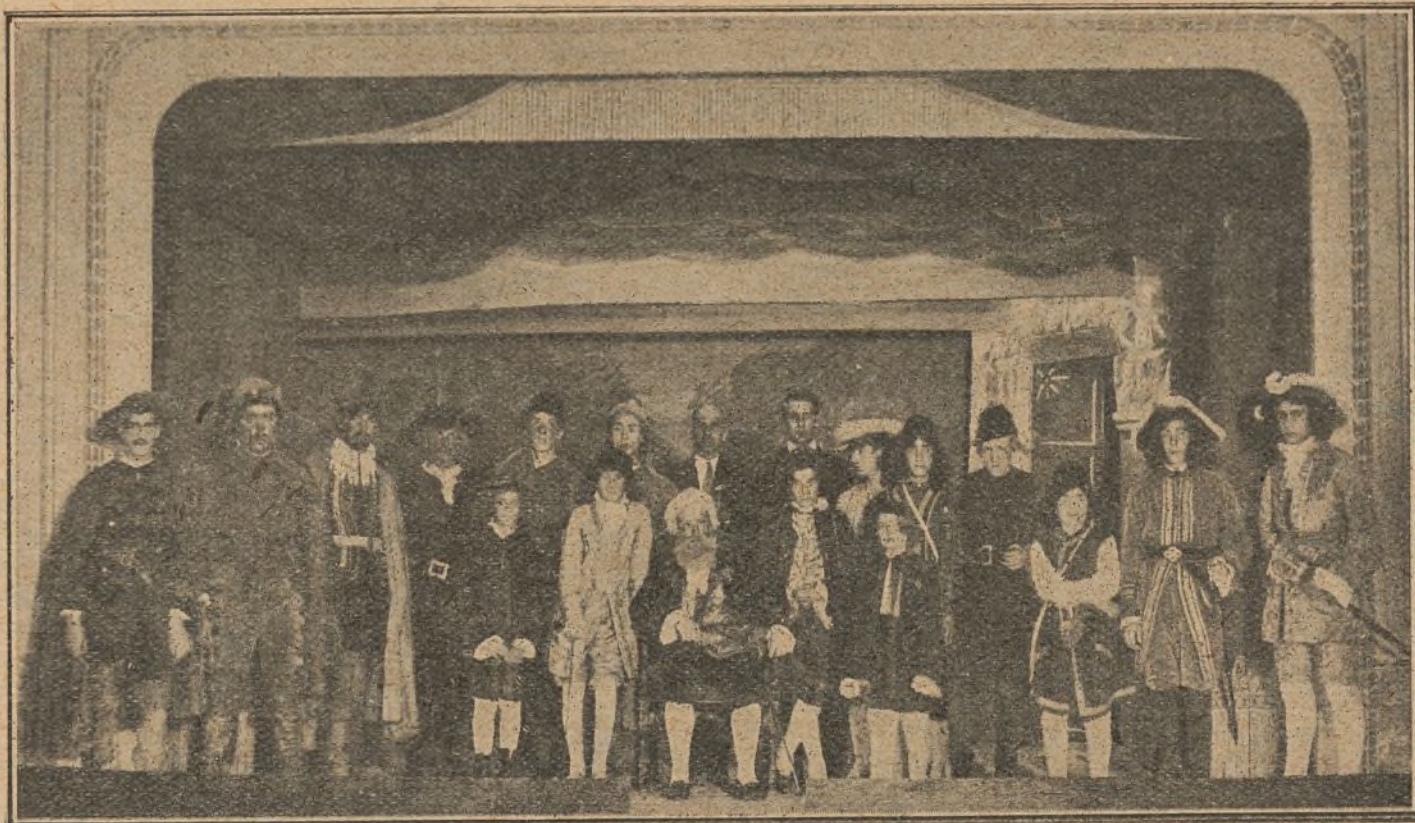
El grupo artístico del Círculo Católico, de Villanueva y Geltrú, que ha estrenado con gran éxito la popular rondalla «El mes petit de tots»

Hábilmente intercalado en la opereta la empresa nos ha presentado un cuadro plástico titulado «Una fiesta en Versalles», que es un prodigio de corte, de fastuosidad y de buen gusto.