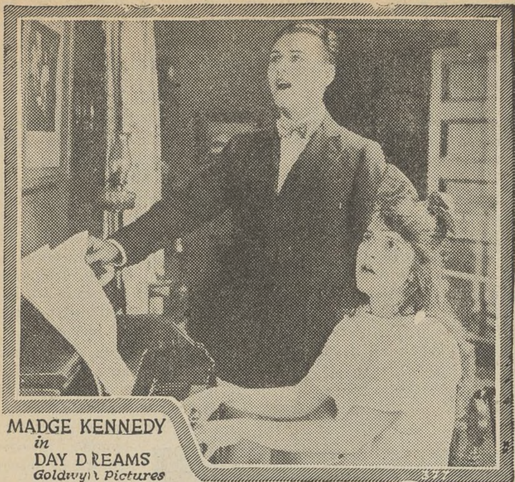
MADGE KENNEDY in DAY DREAMS Goldwyn Pictures

Una escena de la película «Sueños de juventud»