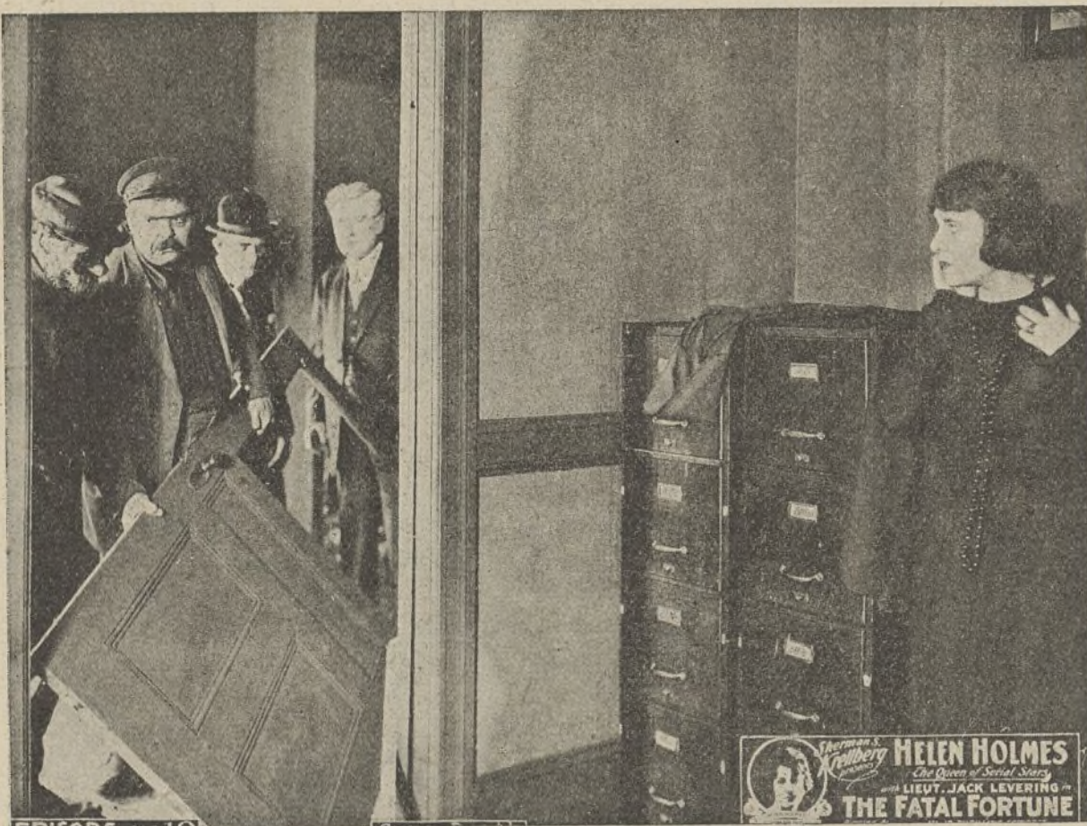
Una escena de la película «Fortuna fatal»

En tanto, «El Rostro Invisible» huía con Elena a toda velocidad de su auto; tras él marchaban otros dos coches, uno con Tom Warden y otro con «El Lobo» y sus amigos. Un policía, al ver huir al enmascarado, le persiguió con su moto,