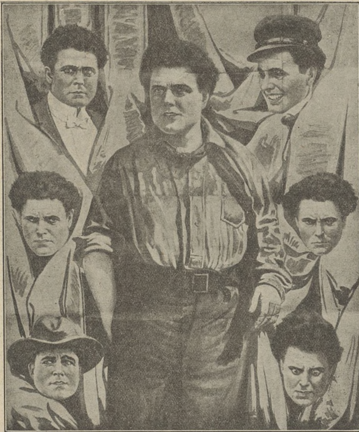
WILLIAM FARNUM Protagonista de «Los Miserables»

Julio César . — «Cual de las dos», graciosa comedia de la casa Christie, «El jinete fantasma», hermoso drama de 1.500 metros, y «El marido de su viuda», interesante y graciosa comedia.