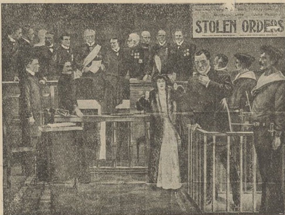
Una escena de la película «Ordenes robadas»

Y camino del Africa del Sud va Morgan con sus gloriosas y valiosas conquistas: su novia y un millón de dólares de recompensa.