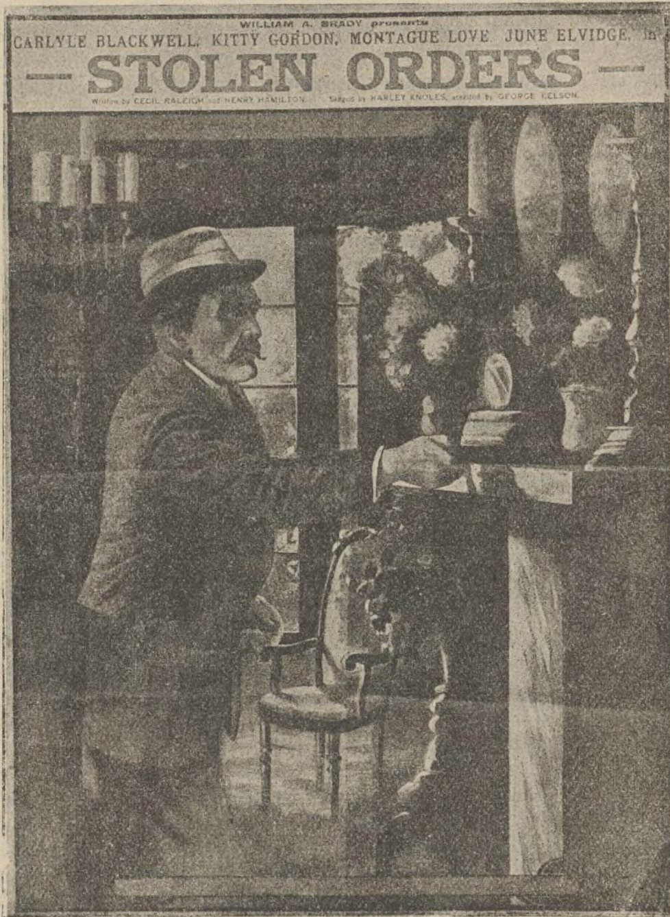
Una escena de la película «Órdenes robadas»

Elena salió por la ventana del encierro, anduvo por una cornisa y se introdujo por otra ventana que halló abierta. Mirando a la calle se orientó; estaba en la vieja casa de juego de Fainfield, en comunicación secreta con la morada de Warden. Entonces telefonó a su domicilio; su primo Pablo, que recogió la comunicación, avisó a Tom, y no tardaron en acudir ambos en socorro de Elena, entrando por distintos lados en la casa que suponían cárcel de la muchacha, para registrar más pronto y con más garantías de éxito las dos alas del edificio.