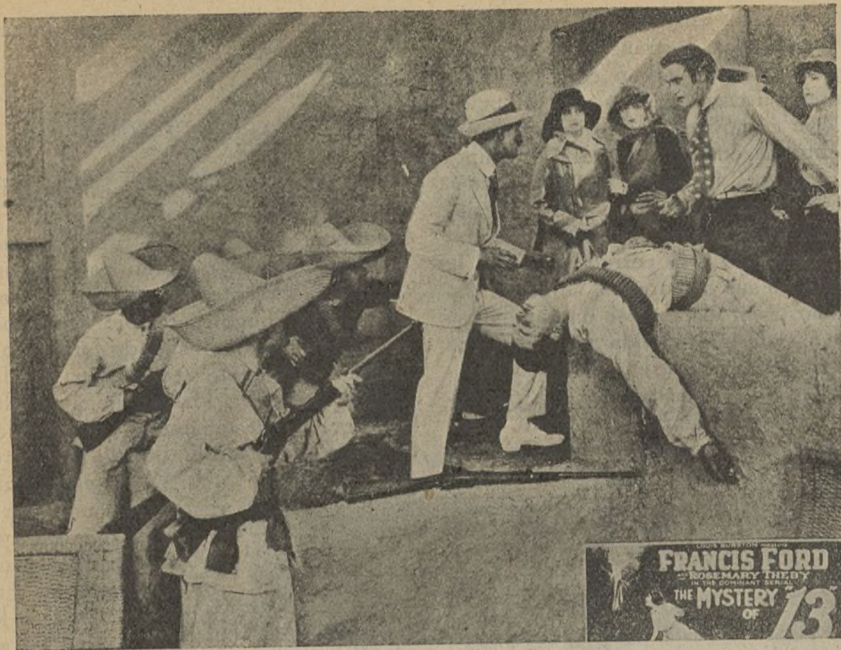
Una escena de la película «El misterio de los 13»

Pasan algunos días. Ching-Fu y Yang-Sé comparecen ante los tribunales y son condenados, cada uno, a quince años de prisión. Jack va a poder gozar en paz de las inmensas riquezas que debe a la más abominable de las perversidades.