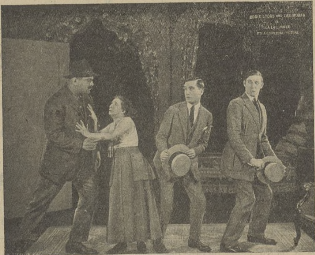
Una escena de la película «Divorcio de Lucile»

lada, libra encarnizada lucha con sus carceleros y busca la salvación en la envergadura del navío. Seguida por los ojos de sus imponentes enemigos que no pueden alcanzarla, gana la extremidad de una verga y una zambullida magistral la otorga, en premio a su arrojo, la libertad.