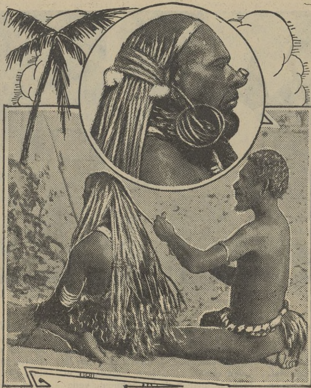
«Naufragio entre caníbales»

Al caer la noche, el astuto chino y su acólito preparan la muerte de aquel a quien consideran abominable sacrilego y cuando al alba llega Malvern a la mina para examinar el filón recientemente descubierto, se produce una violenta explosión en la que perece en el