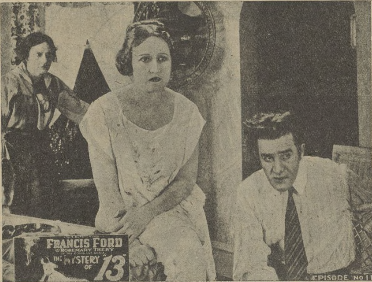
Una escena de la película «El misterio de los 13»

Afectadísimo por la muerte trágica de su joven esposa a la que adoraba, Harry se entrega a la más profunda desesperación y los consuelos de su primo Selwyn no logran devolverle el alegre humor de antaño.