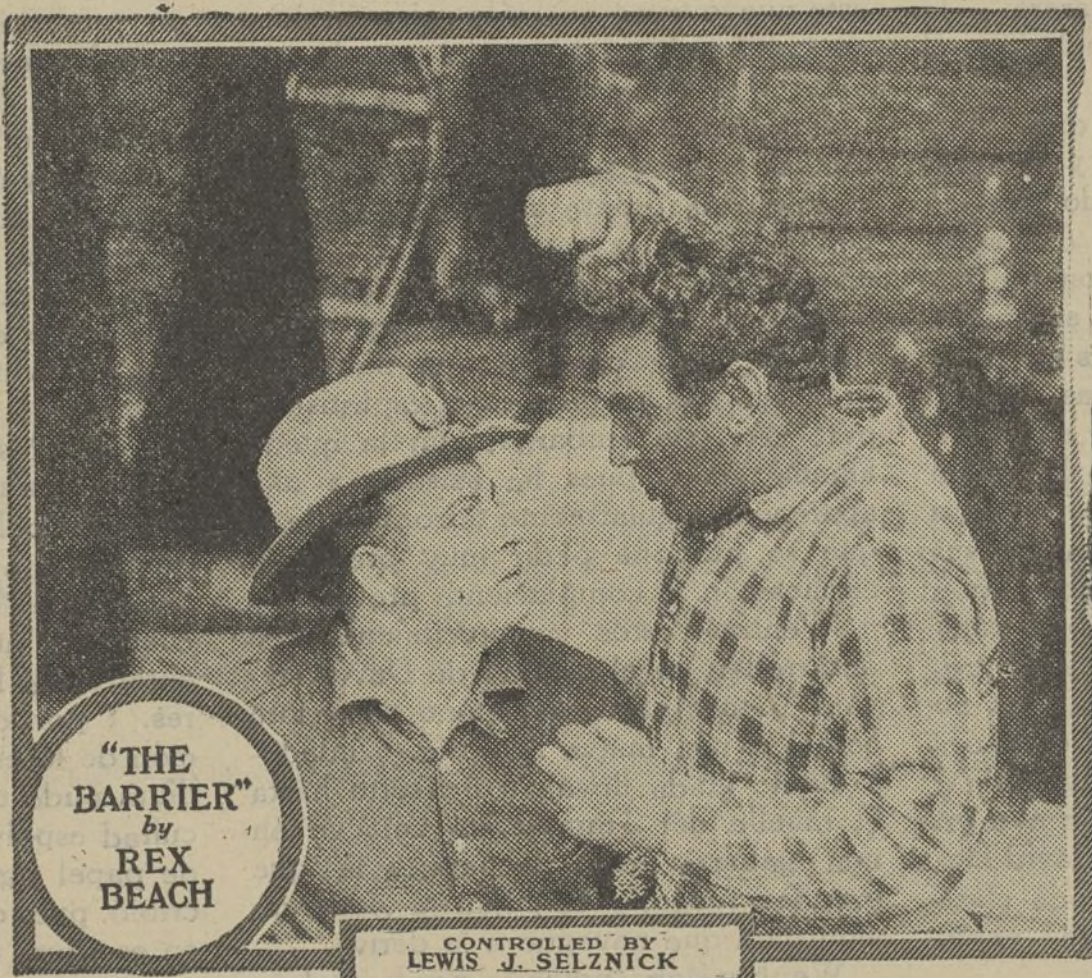
Una escena de la película «La barrera»

Desde ese día, Bob Evans y Webb son los mejores amigos del mundo, hasta el extremo de que hoy han convenido ir juntos en socorro de Frisette, quien tiene empeño en penetrar sola en la «Casa del Misterio», y que antes de franquear la entrada ha creído prudente telefonar al detective para que vigile los alrededores del cuartel general de Ching-Fu absteniéndose de intervenir.