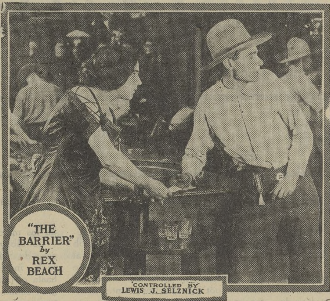
Una escena de la película «La barrera»

Helen, documentos en mano, afirma la existencia de Suzy y ruega a Cottolbey que busque a la joven quien debe