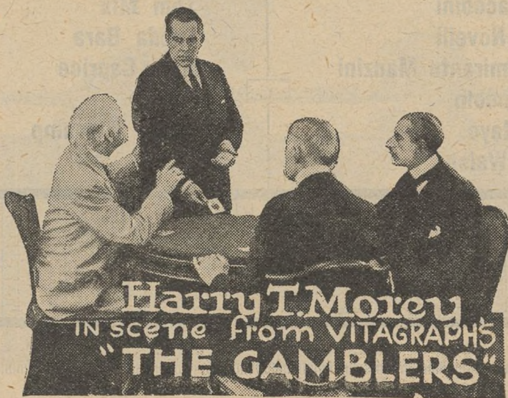
Una escena de la película «Por una jugada»

arrastrar por los dictados de su corazón generoso, dispónese a acudir de nuevo en auxilio de la joven.