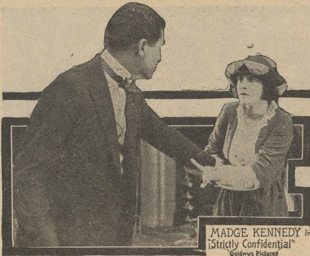
Una escena de la película «S. M. la Librea»

—No intentes averiguar porque el morir tú significa para nosotros la venganza: has de saber tan sólo, que con