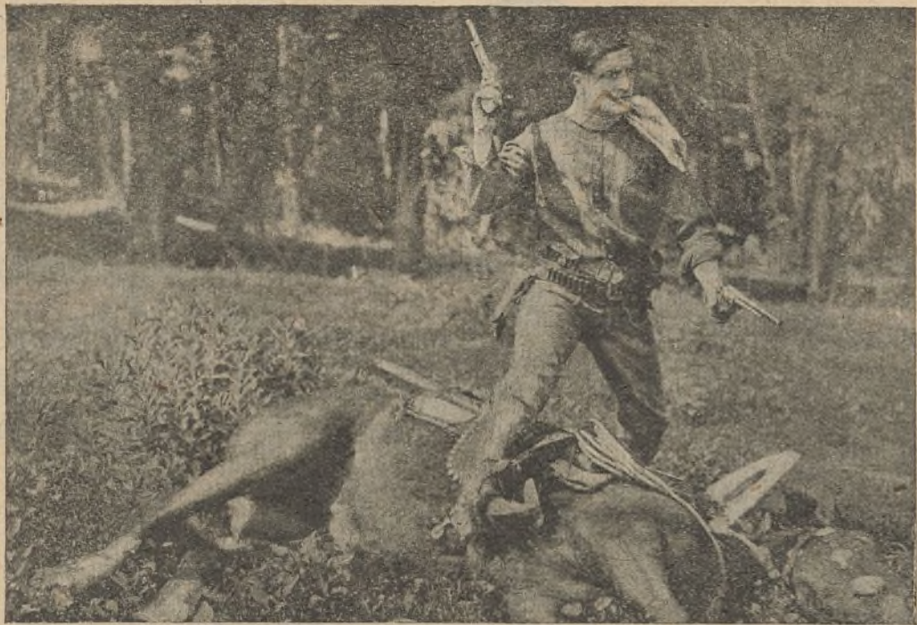
El célebre artista Tom Mix

—Nuestro padre ha sido acusado de haber asesinado a un hombre a la puerta de nuestra casa. El cadáver llevaba clavado en el pecho un puñal que en el nácar del puño tenía grabado el nombre de «Nin»; alguien ha debido robarlo durante la noche, para que la sangre del asesinado caiga sobre nuestro