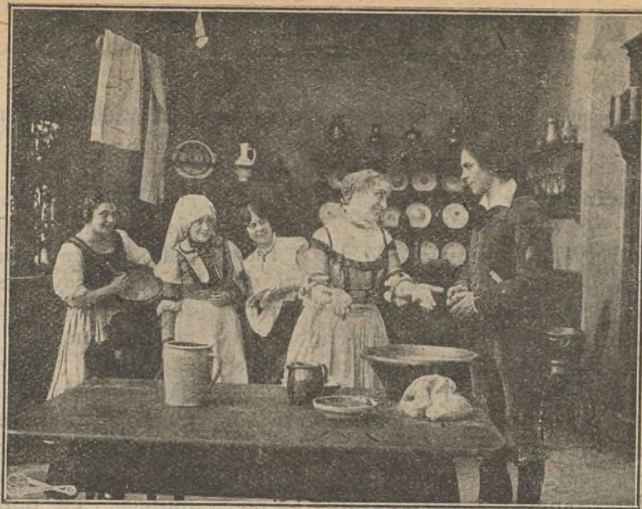
Dos escenas de la película «Madrigal de amor»

cia, donde los más apuestos galanes asediaban a la gentil cortesana, diciéndola, lisonjeros: