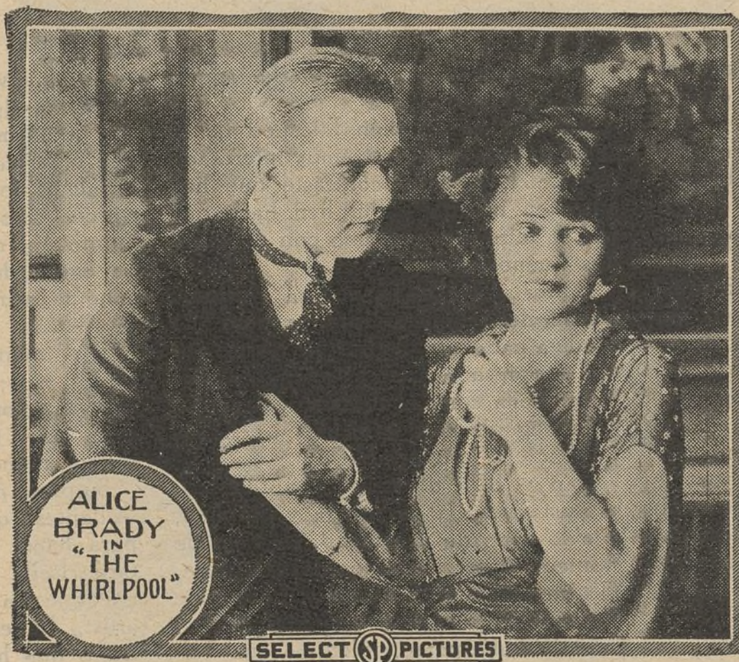
Una escena de la película «El Remolino»

A partir de aquel instante, buscó por todas partes el contagio, y cuando sintió invadido su organismo por los gérmenes del mal, encaminóse a Floren-