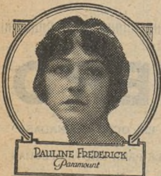
PAULINE FREDERICK Paramount

M. F. Esquer. — Tiene 29 años. Es de origen inglés, y sobre su anterior medio de vida corren diversas versiones sin que se pueda saber nada concretamente. No creemos que el que dispone con la mano izquierda sea origen de ningún defecto físico y sí solo una costumbre. El número de artistas es imposible precisar pues se renuevan de continuo.