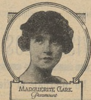
MARGUERITE CLARK Paramount