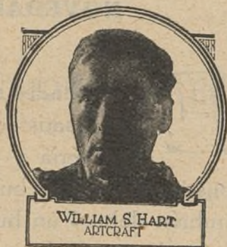
WILLIAM S. HART ARTCRAFT

Si el interés de los tres tomos restantes no decae, cosa que no esperamos, «Trabajo», será una de las mejores creaciones de la cinematografía francesa.