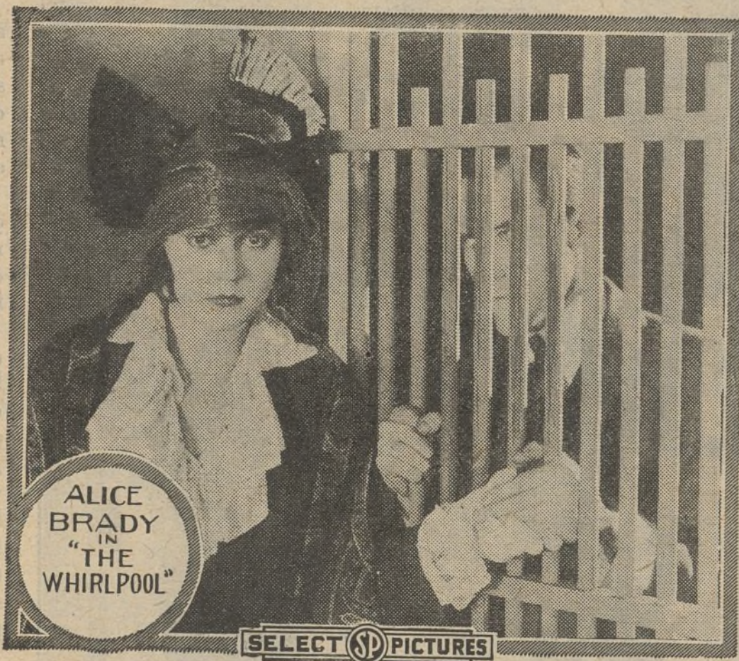
Una escena de la película «El remolino»

sus trajes. Roberto Underwood hace amistad con la misteriosa muchacha que ocupa el lugar de su esposa. El niño Bobby cae enfermo y Marcela se ofrece para cuidarlo, no dejándolo un solo momento hasta que se repone.