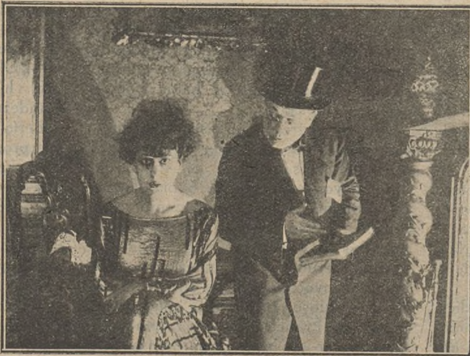
Una escena de la película «Hedda Gabler»

Dan un baile de máscaras al que Leila asiste vestida de Julieta y Sutphen, que lo sabe de antemano, se viste de Romeo. Porter, a ruegos de su esposa, se viste también de Romeo; pero hace un triste papel como el héroe del inmortal Shakespeare, mientras que Sutphen está excelente. Sutphen habla mucho con Leila, y finalmente le confiesa su amor, al que ella corresponde,