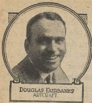
DOUGLAS FAIRBANKS ARTCRAFT

bría perdonado, sino que él se habría dado la culpa a sí mismo de todo. Ahora comprende que nunca conoció bien a su marido a pesar de los años que llevan de matrimonio.