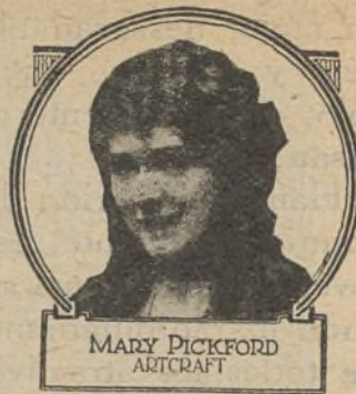
MARY PICKFORD ARTCRAFT

Marcela y Underwood se ven al fin libres de todos sus enemigos.