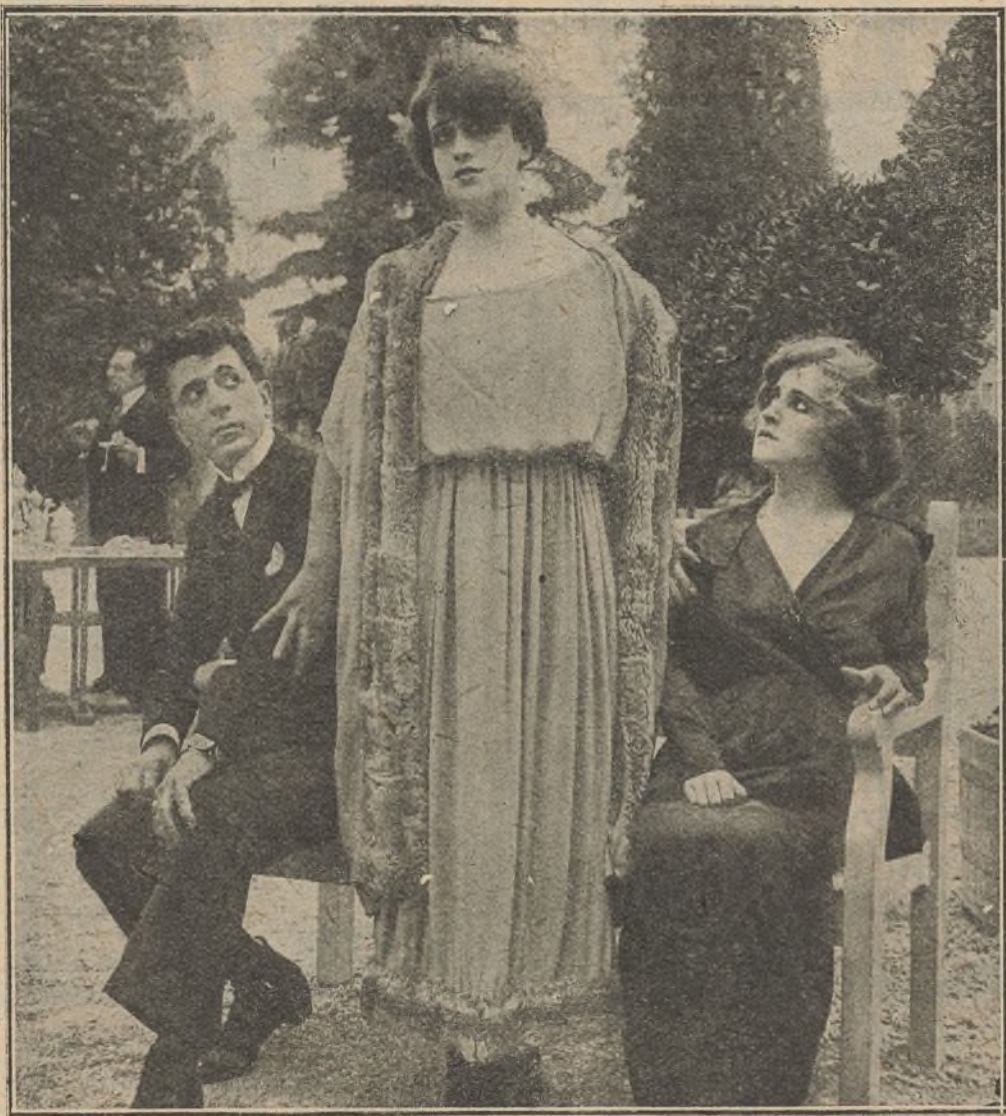
Una escena de la película «Hedda Gabler»

favor hacia Krogstad. Cuando la señorita Linden habla con el prestamista, este ya ha escrito a Torvaldo Helmar explicando todo y amenazándole con hacerlo público si no le vuelve a admitir en el Banco. El efecto que estas noticias causan a Helmar es desastroso. Se indigna contra su esposa y declara que es indigna de ser la madre de sus hijos. Ella quiere explicarle el motivo de su conducta, pero él no quiere oírla. Su proceder es una revelación para Nora, quien se había figurado que al descubrirse su acción y las causas que la motivaron, no solamente la ha-