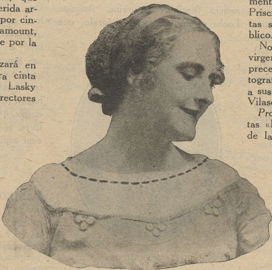
Henny Porten, del Programa Verdaguer

Seiscientos pacientes recibieron asistencia médica en los hospitales de la casa Paramount en el curso de tres meses. La manufactura de película resulta a veces tan peligrosa y es tal el número de personas que en ella toman parte, que la compañía de que hablamos decidió abrir una clínica en su estudio de Long Island, destinada a dar socorro inmediato a quienes lo necesitasen. La