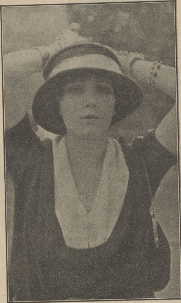
Ultimo retrato de Raquel Meller, hecho en Buenos Aires pocos días antes de zarpar con rumbo a España. Raquel Meller tenía compromisos adquiridos con varias empresas para actuar en diversas capitales sudamericanas desde Méjico a Chile, pero súbitamente ha tomado pasaje en el «Reina Victoria» que ya está a punto de llegar a Cádiz, y han quedado en América sus empresarios con dos palmos de narices. ¿Quare causa?

Montero, infatigable y de una curiosidad espiritual nunca saciada, se dispone a estrenar en Romea una obra de gran espectáculo titulada Per Catalunya . Esta obra lleva ilustraciones musicales y cuplés de Cándida Pérez, autora de Las caramellas y dicen los que aseguran estar bien enterados, que la empresa ha echado el resto y que las diez y ocho decoraciones que se estrenarán con la obra y el vestuario confec-