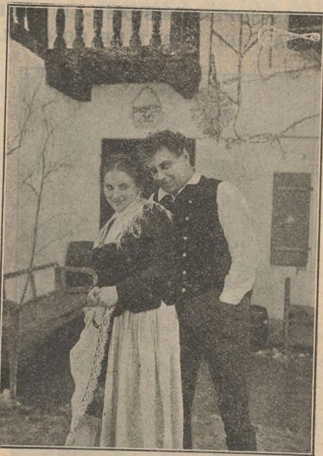
Henny Porten en una escena de la película «Las hijas del cervecero»

Después de trabajar por espacio de más de veinte meses en la producción de «Las damas deben vivir», la segunda hecha por el gran director señor George Loane Tucker para la Paramount, está ya terminada y pronto será enviada a Nueva York para ser exhibida privadamente.