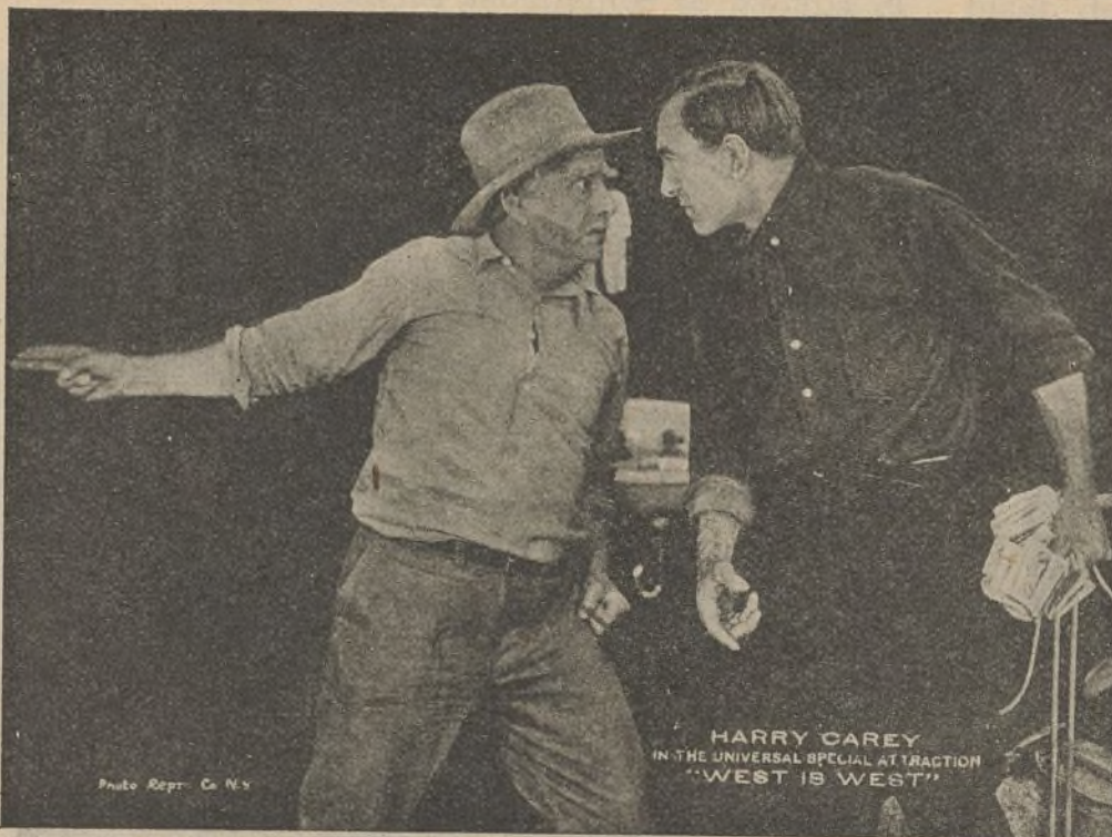
Una escena de la película «Hombre entre hombres»

Entre Maud y Madsen dieron sepultura en las rocas al cuerpo de Kien-Lung y después de haber cumplido con este último deber, se internaron a través de un túnel que atravesaba el macizo volcánico del Jura. Lenta y penosa fué la marcha, pero al final de ella, como una visión de ensueño, magnífica en el crepúsculo de la tarde, se alzó ante ellos OPHIR LA CIUDAD SANTA DEL PASADO.