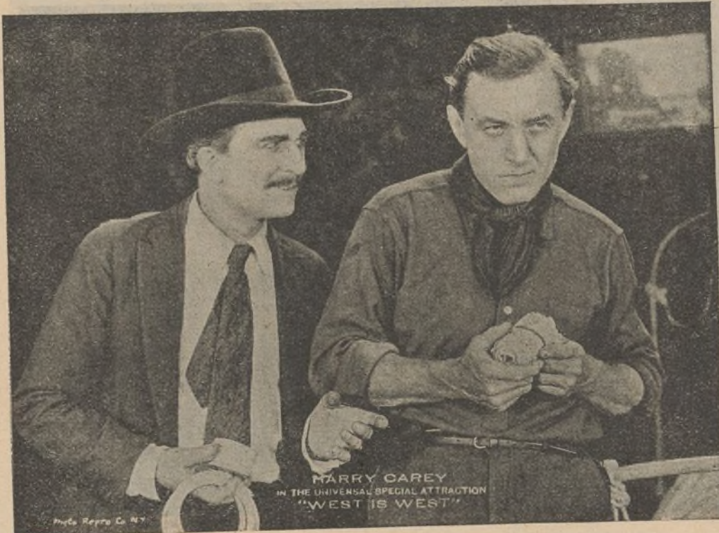
Una escena de la película 'Hombre entre hombres'

Habitaba en Kuan-Fú un anciano misionero llamado el padre Ambrosio, alma de santo, presto siempre para acudir a los sitios en donde hacía su nido el infortunio. Era su palabra, palabra de paz y bendición que parecía descender del cielo. Lo mismo sanaba las heridas del alma y consolaba al afligido, que administraba cocimientos de