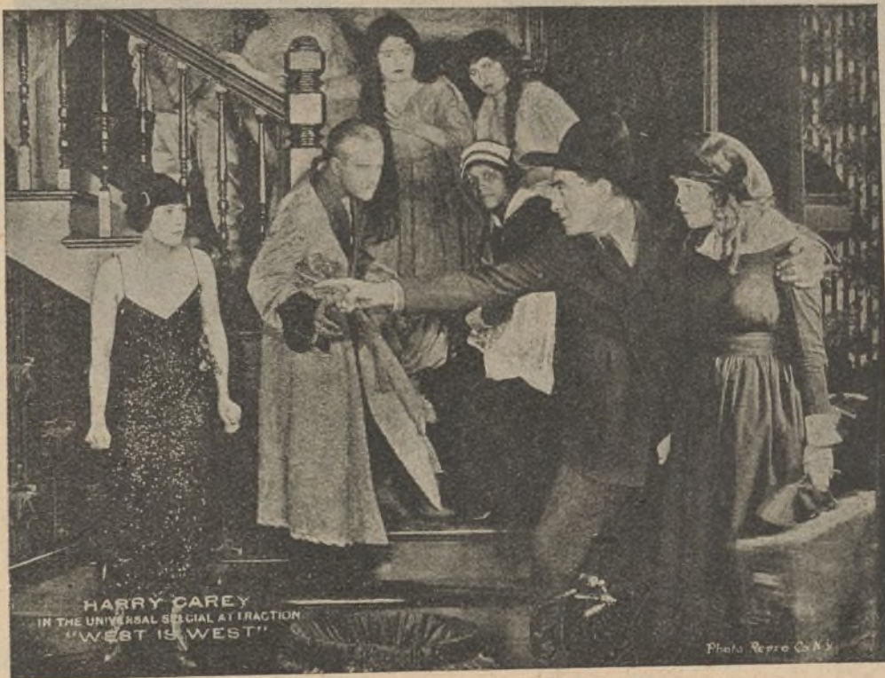
Una escena de la película «Hombre entre hombres»

dominios — respondió Makombe — y temo a la cólera de mis dioses si sus pies profanan esta selva sagrada.