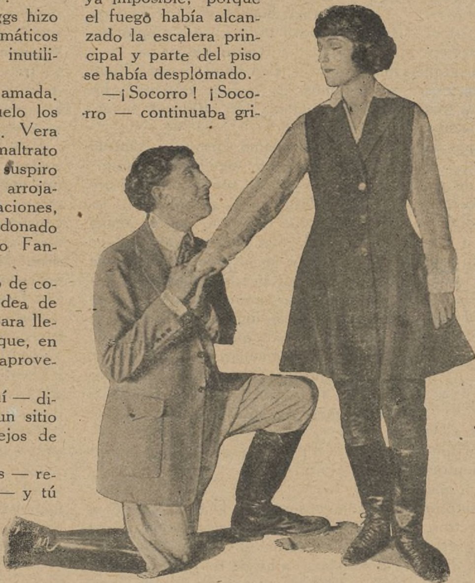
«El rey de la audacia»