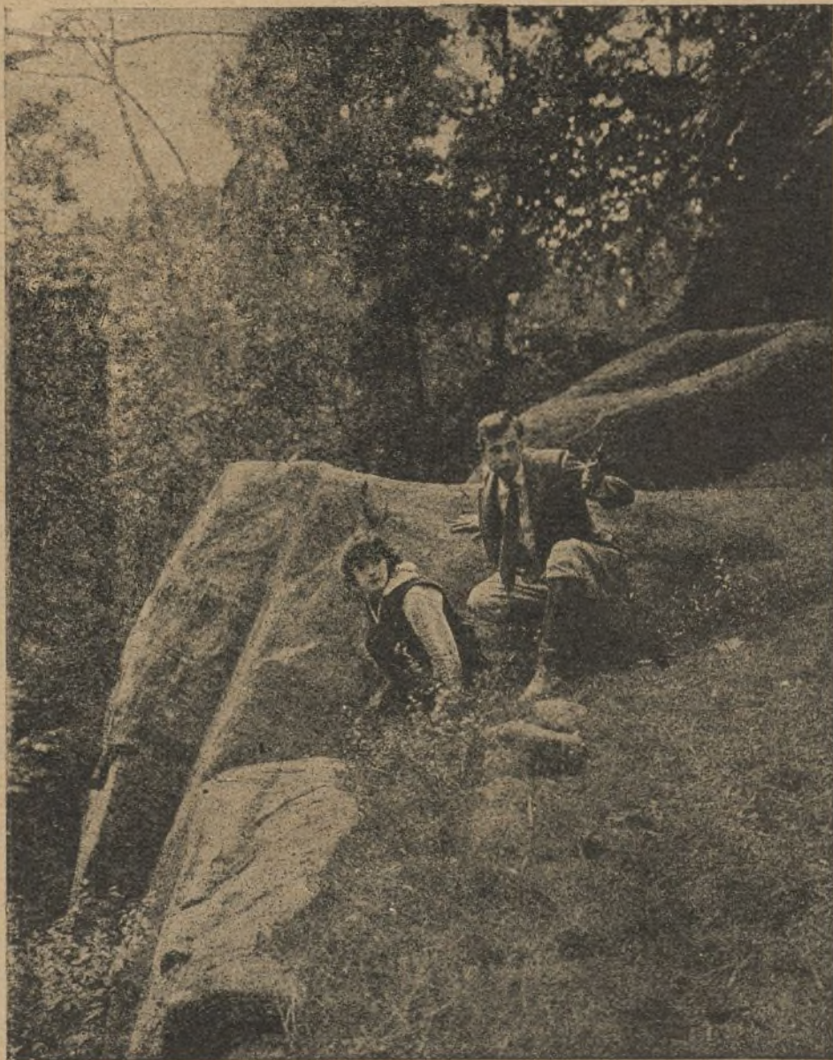
«El rey de la audacia»

El colorido de la decoración del cabaret se hizo en negro y oro. El fondo es una masa sólida de tela dorada, con enormes columnas rematadas en cúpu-