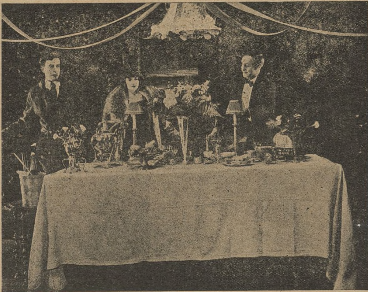
«El rey de la audacia»

Este, ahogándose en el humo infernal de un habano falsificado, la abruma con frases entrecortadas.