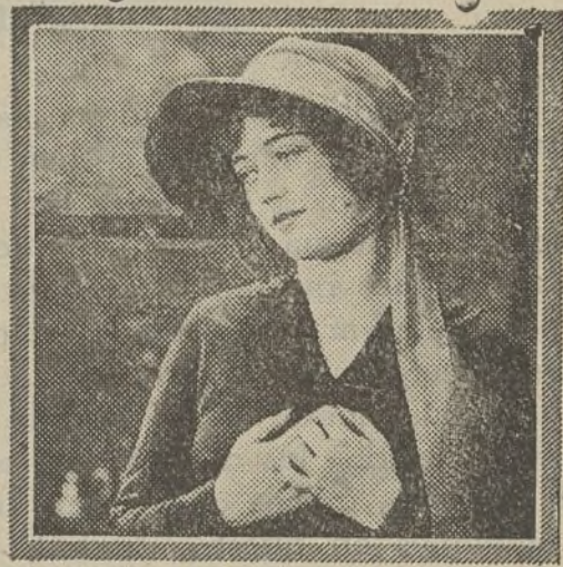
MARION DAVIES "THE BELLE OF NEW YORK"

El alegre Broadway está en estas noches con el nombre de Charlie en los labios. Todos dicen que el célebre cómico se dispone a contraer nuevas nupcias y lo que es mejor, afirman que la