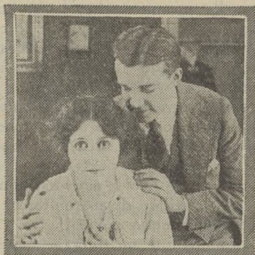
CLARA KIMBALL YOUNG