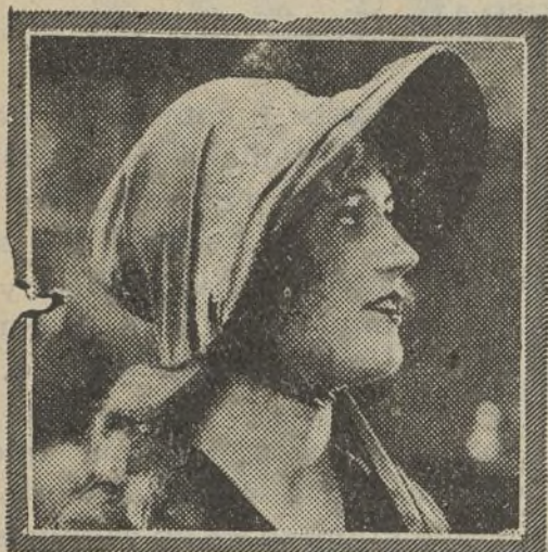
MARION DAVIES "THE BELLE OF NEW YORK"