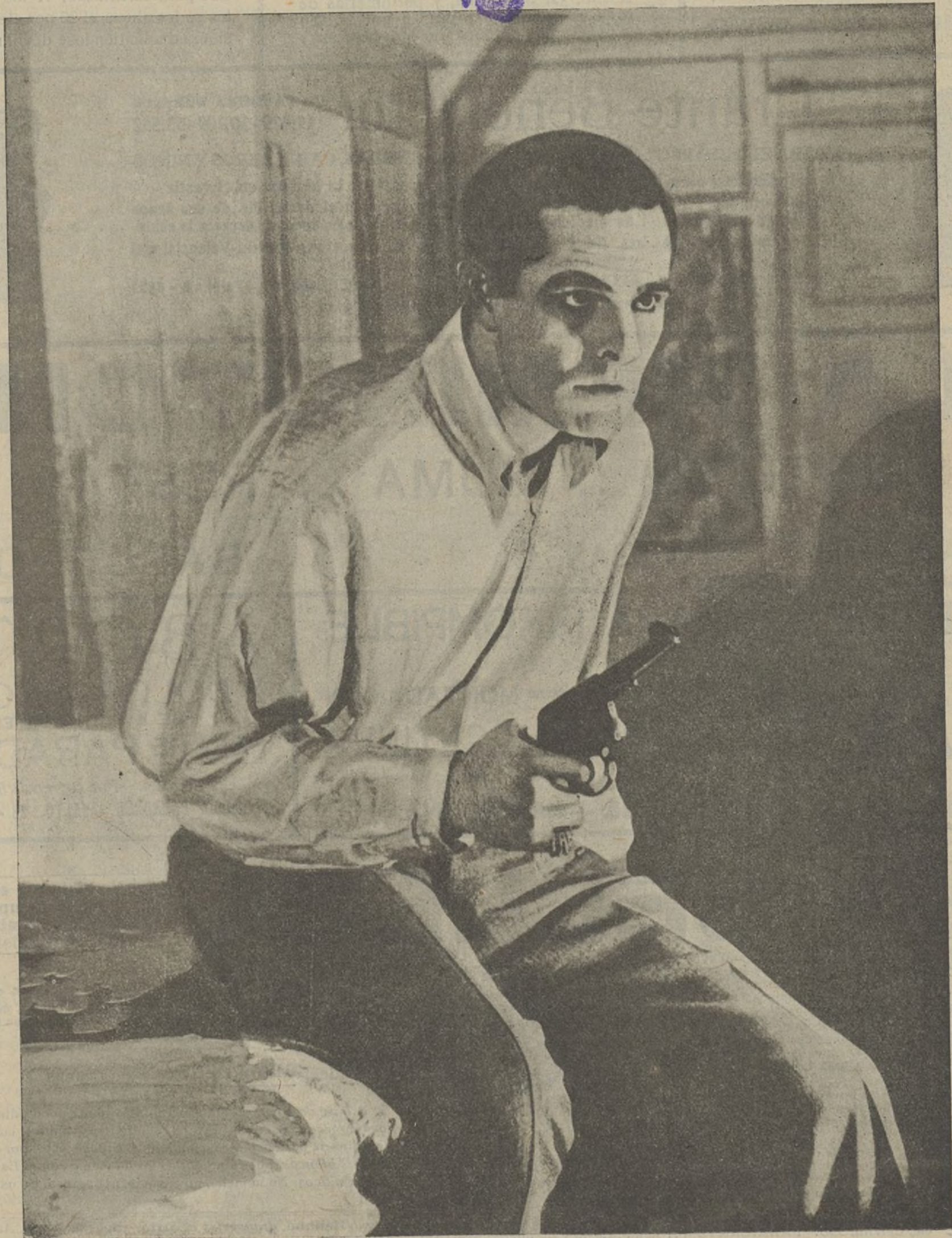
ANTONIO MORENO POPULAR ARTISTA CINEMATOGRAFICO