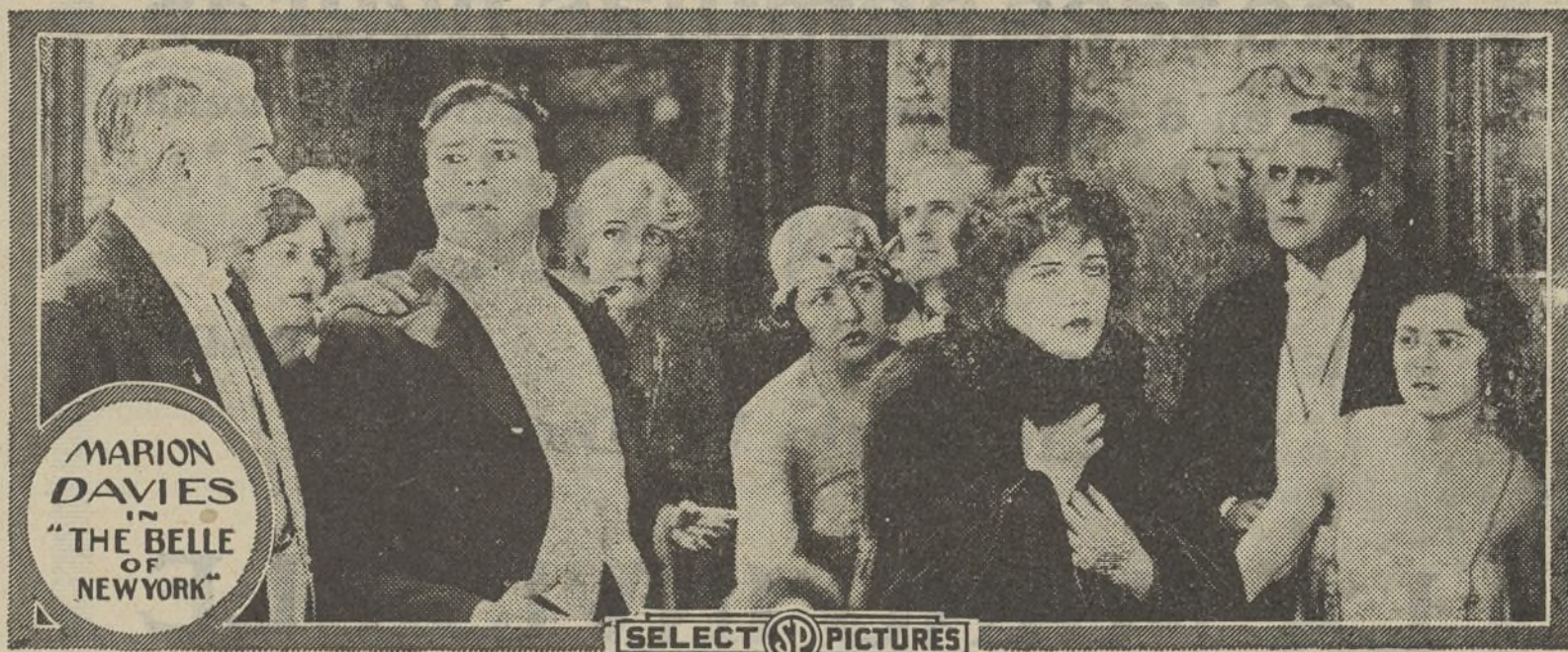
«La bella de Nueva York»

Renard comprendió, demasiado tarde, que Kali había caído bajo la influencia hipnótica de Dupont y trató, con todas sus fuerzas, de arrancar de su cuello congestionado, las manos como tenazas del pigmeo.