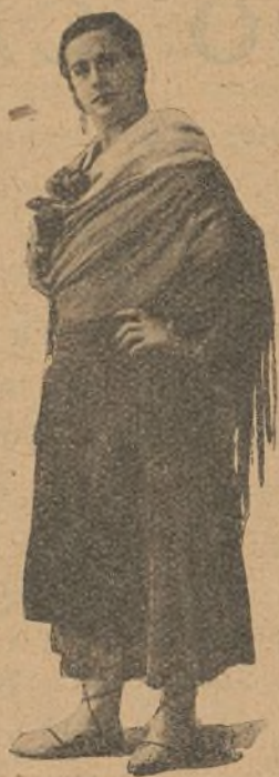
GLORIA DEL EBRO