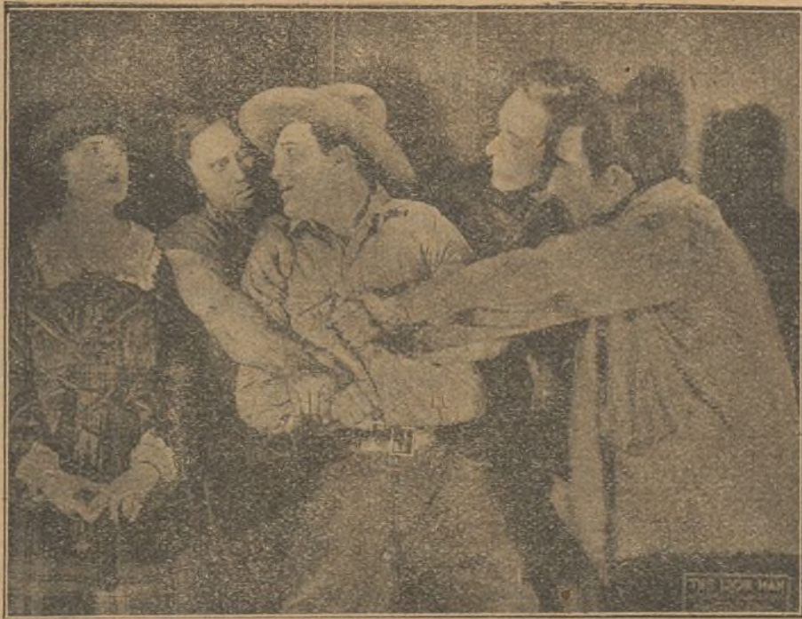
«El hombre león»

cas horas de haber sido lanzado a la vía pasó un tren. Jack se incorporó y yendo el tren en marcha se encaramó a él.