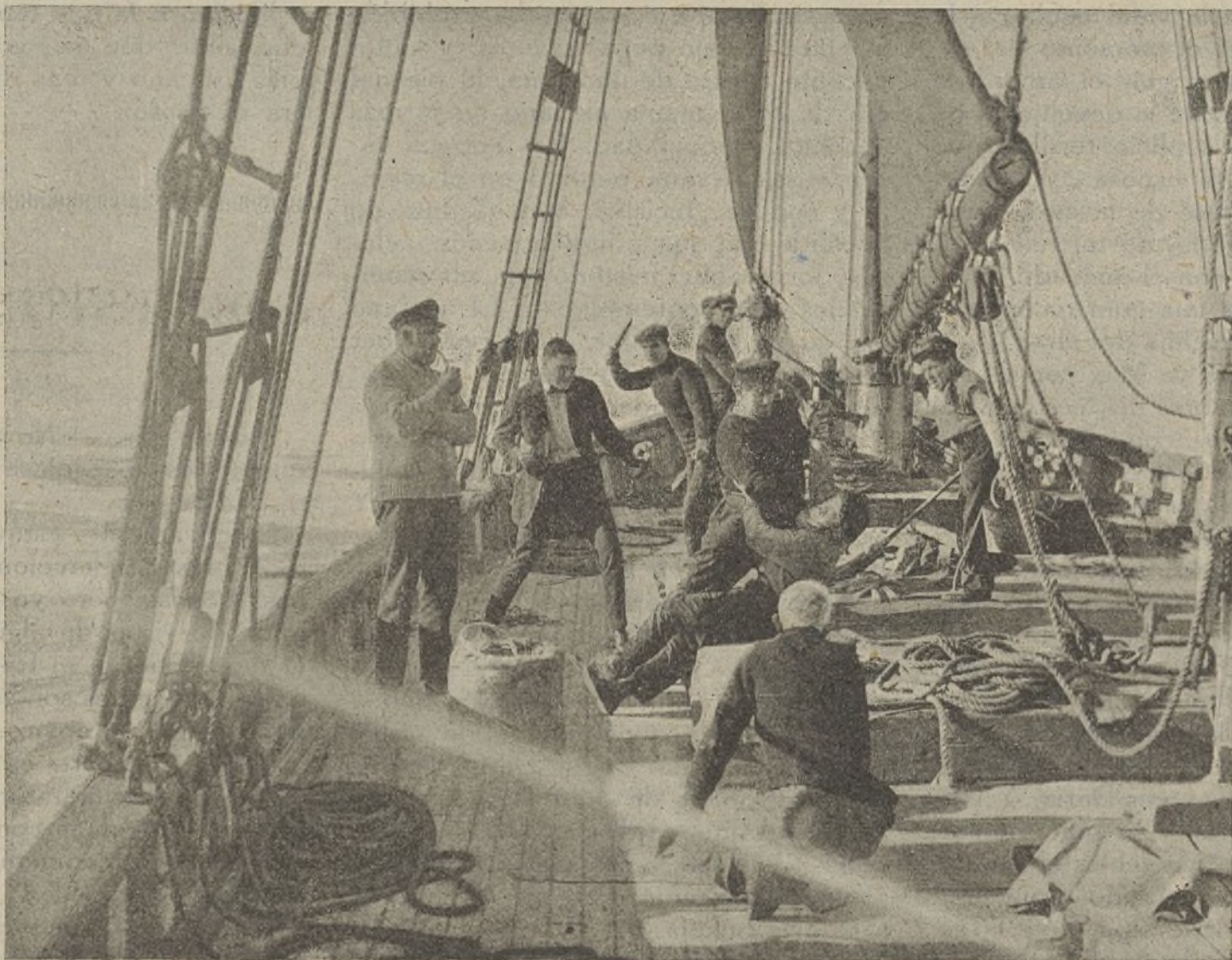
«Vivo o muerto»

do a mi hija al cuidado de mi fiel Kabyr, que actualmente me sirve. El brahmán Maharah nos recibió hostilmente, maldiciéndonos por la audacia de mancillar con nuestras plantas la morada de la deidad; pero la belleza de Georgina le impresionó hondamente... Días después, su vendedor llegaba a nuestra casa a ofrecer su mercancía y miraba a nuestra hijita, que dormía en su cuna, concentrando en ella todo el odio ancestral de su raza a la raza europea. Este mercader, llamado Bankor, y su hija Nirvana, sacerdotisa de Siva, eran protegidos de Maharah. Nirvana había recibido ultrajes de un europeo, vicioso y pendenciero, Cirilo Max, que frecuentaba en Benarés un lugar de libertinaje. Hasta el brahmán