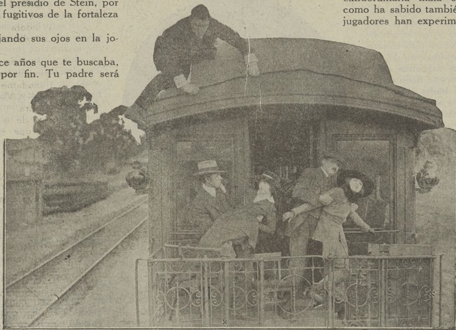
«Vivo o muerto»

Durante la mañana Pescade ha oído contar lo sucedido la víspera en los salones del Círculo, es decir, tiene noticia de una serie inverosímil de encarnados que había causado numerosas víctimas, entre las cuales se citan principalmente a Sarcany y Silas Toronthal. De aquí deduce que su conversación debe girar en primer término sobre tan extraordinaria mala suerte. Además, como ha sabido también que estos dos jugadores han experimentado pérdidas