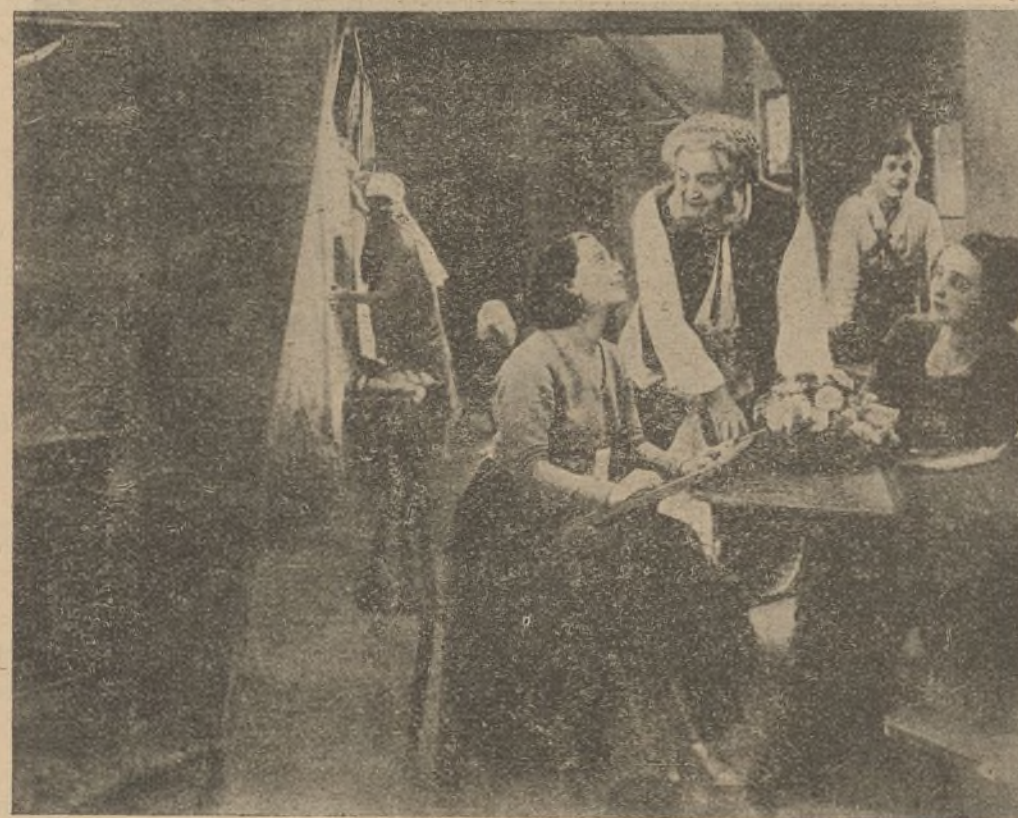
«El Alcalde de Zalamea»

Como observará el inteligente lector, la mayoría de las cualidades que acabamos de enumerar corresponden a la vida privada o íntima del actor o actriz. El lector curioso que pasee la vista por estas líneas, tal vez tendrá otros motivos, muy respetables por cierto, para querer a esas estrellas y a otras de la Paramount, que no mencionamos, motivos basados, no en sus