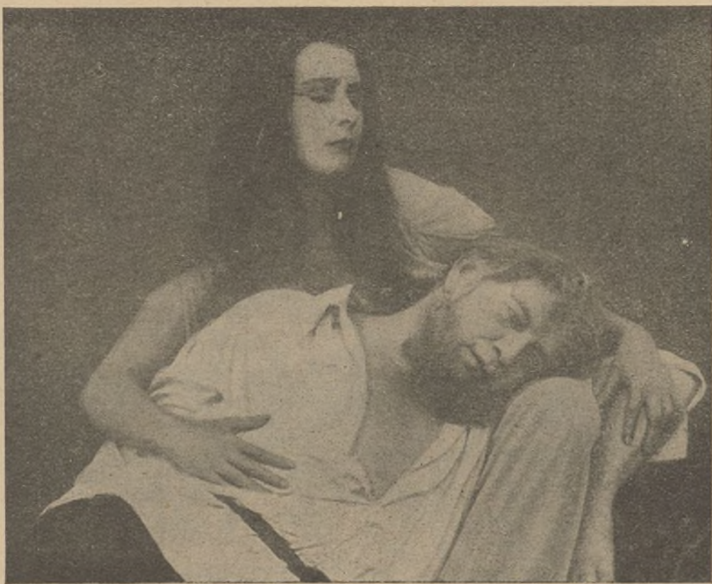
«El Alcalde de Zalamea»

Pero El Torbellino se hallaba por allí cerca, montando su motocicleta, y logra salvarla, arrebatándola de la silla. Una inmensa gratitud invade el alma de Elena; pero su compromiso con Carley le impulsa a no dejarse llevar