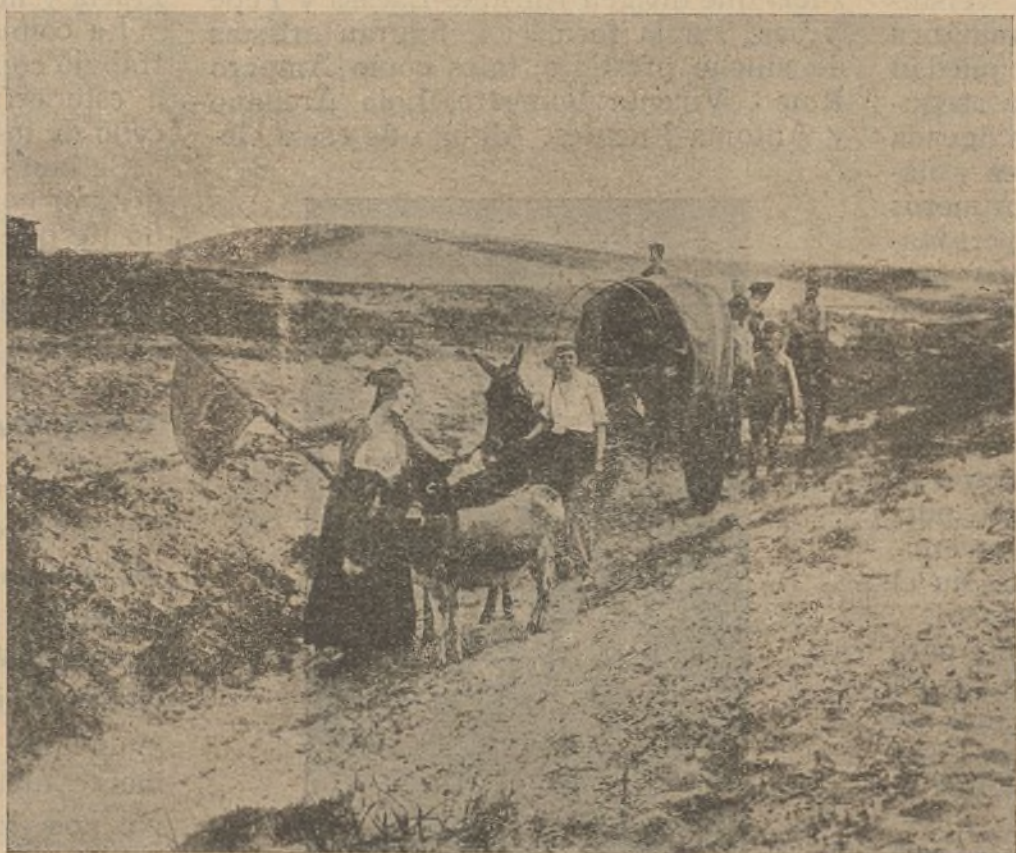
«El Alcalde de Zalamea»

Louise Lovely, artista que debutó en los producciones Universal y que per-