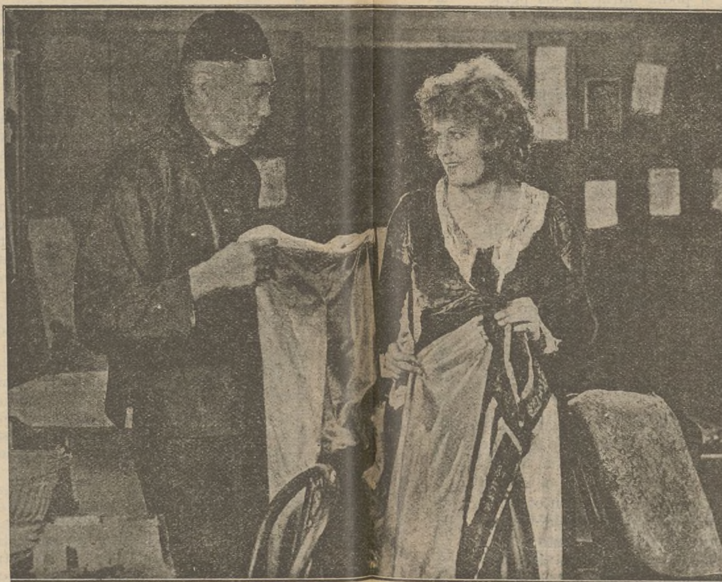
«El hombre león»