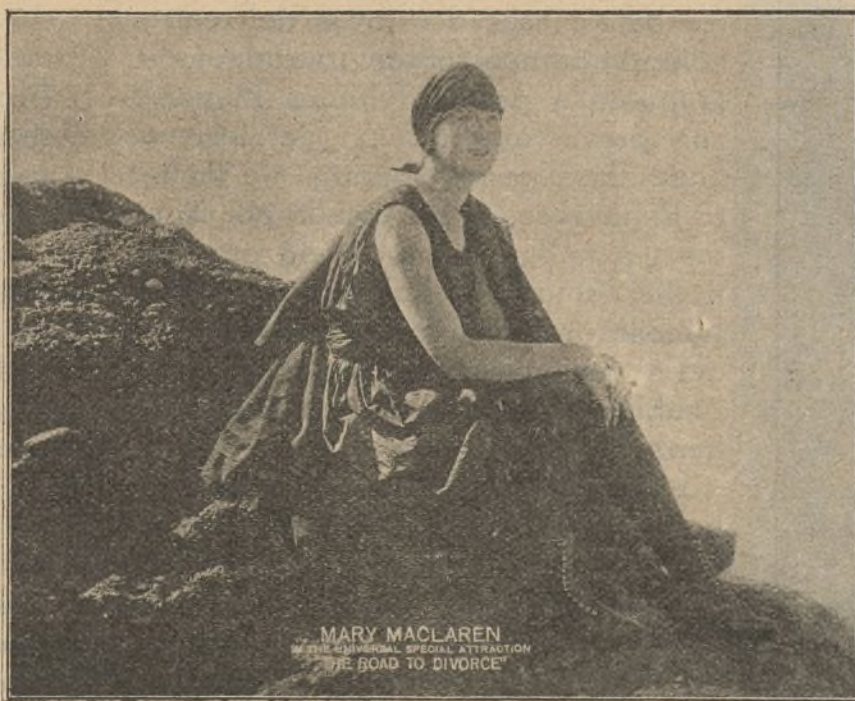
«La senda del divorcio»

Dando por bien empleado el incidente ocurrido con sus guardias si logra divertirse como Bob le ha referido se dirige a la plazuela donde juegan los pilletes más revoltosos de Londres y al leer en su cara la timidez que le domina le levantan en brazos y lo arrojan al río donde se da un baño con el que no contaba. Cuando revelando su elevada alcurnia quiere hacerse respetar, sólo consigue que arrecien en sus burlas y sus pesadas bromas, los que él suponía compañeros de sus soñadas di-