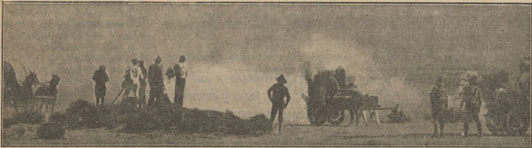
Un huracán artificial en la Ciudad Universal