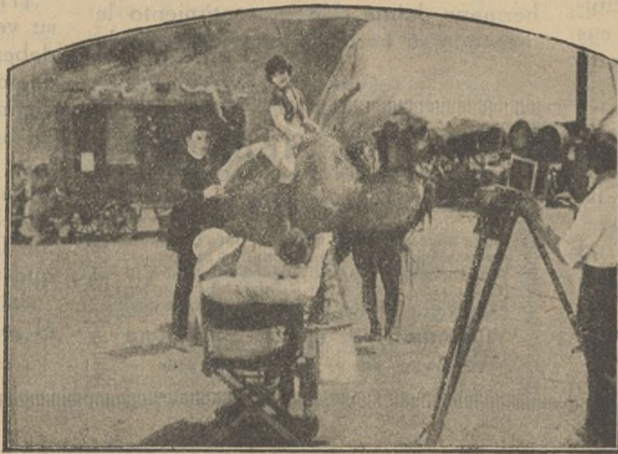
Cómo se filma en la Ciudad Universal

—Por lo que veo, se le ha metido en la cabeza a ese maldito polizone echarme el guante.