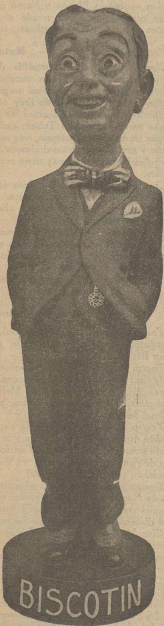
ESTATUA DE BISCOTIN 10 pesetas

les deseo un feliz y próspero Año nuevo, a lo que con- tribuirán gustosamente mis dos ahijadas