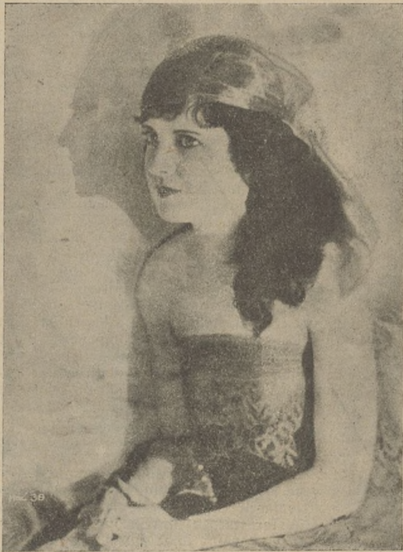
May McAvoy, llamada la «muchacha prodigio», que cuenta con una legión de admiradores en todo el mundo interpretando películas de la Realart

Su película inicial para la Realart se titula «Un escándalo privado», con argumento escrito por Hector Turnhull, uno de los escritores cinematográficos más notables de los Estados Unidos.