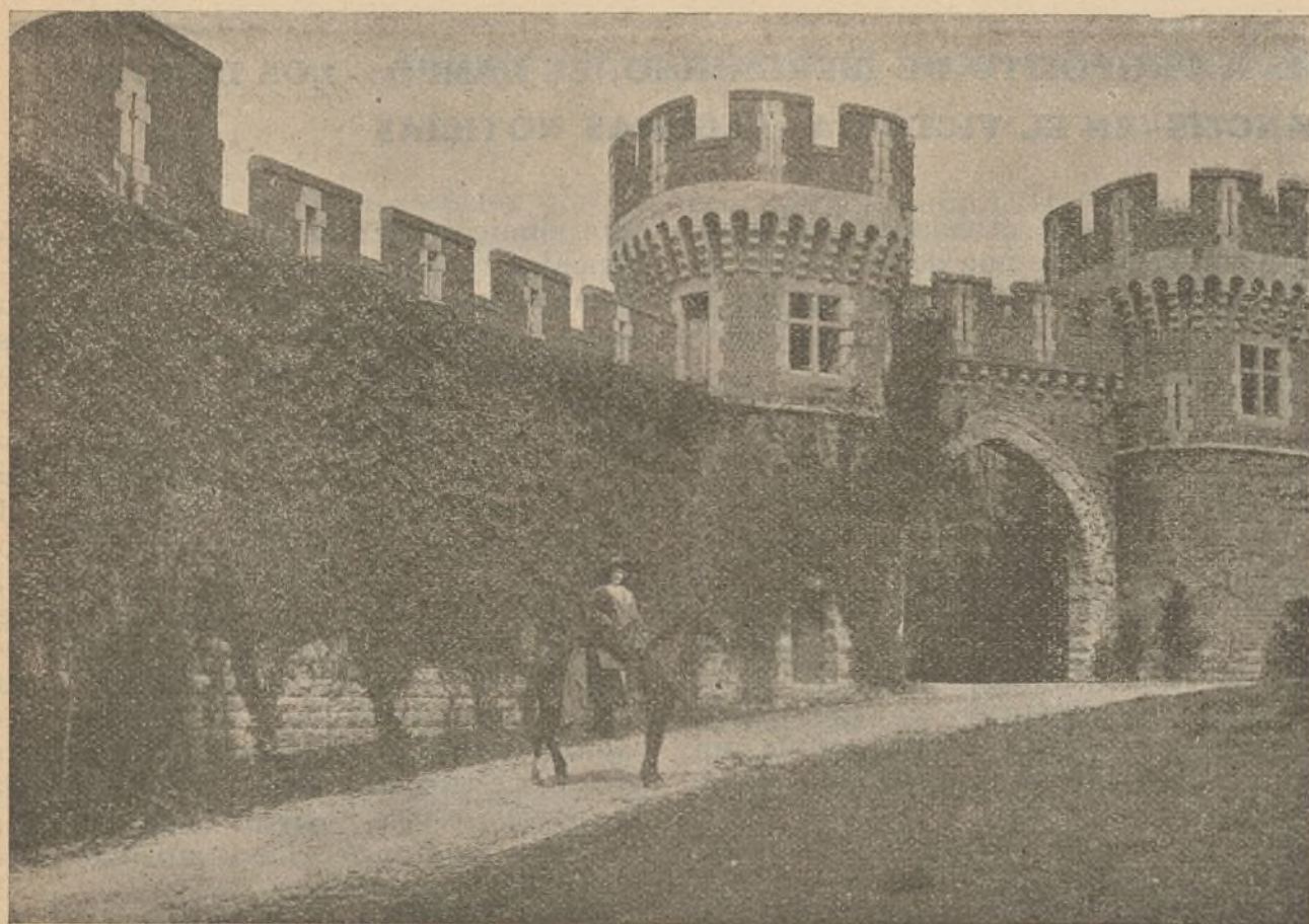
«Los Tres Mosqueteros»