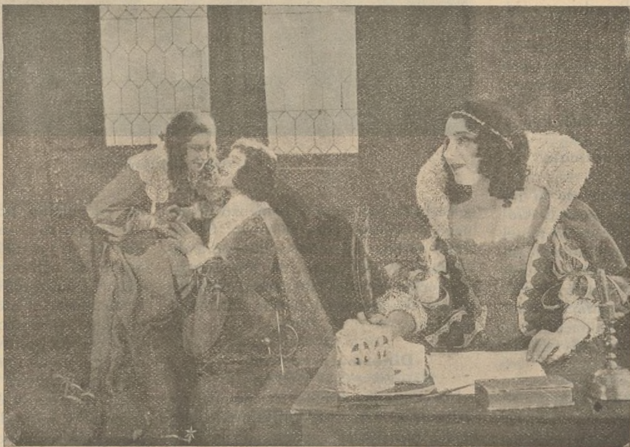
«Los Tres Mosqueteros»

En cuanto llegó a la aldea se dirigió al mercado, pero su madre no reconoció en él al hijo que había perdido ha-