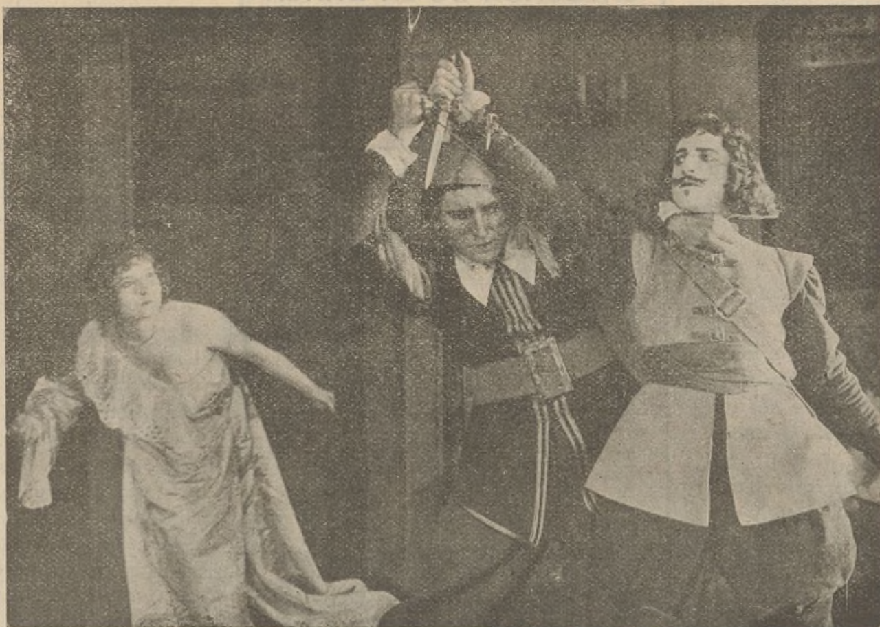
«Los Tres Mosqueteros»

fué conducido al benéfico establecimiento por el misterioso personaje de la motocicleta. Durante su permanencia en el hospital el viejo payaso del circo hace sensacionales revelaciones a Elena acerca del nebuloso pasado de Eddie Polo, contando sucintamente a la joven los sucesos ocurridos en el circo la noche trágica de la muerte del padre de Polo, víctima de una bala homicida disparada a mansalva por el