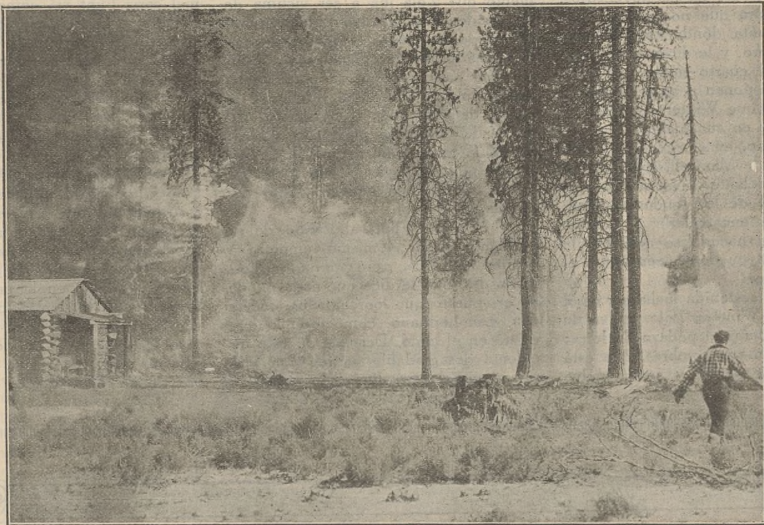
«El domador de salviaes»