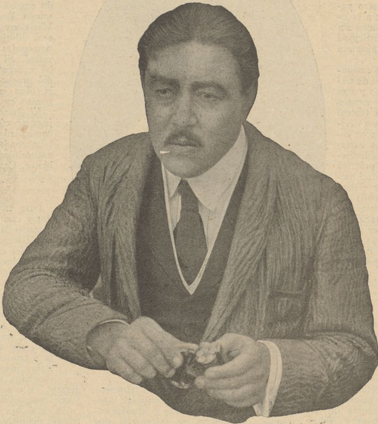
Warner Oland en «Los ojos del mal»

Polo en «El atleta invencible» continúa entusiasmando a sus múltiples admiradores con sus heroicidades, en las pantallas del Cine Ideal, Cinema X, Proyecciones y Cine Hispano-Francés. En el coliseo citado primeramente se proyectaron además bellas cintas como «Déjalo para mí» y «El caballero batallador» ambas interpretadas por