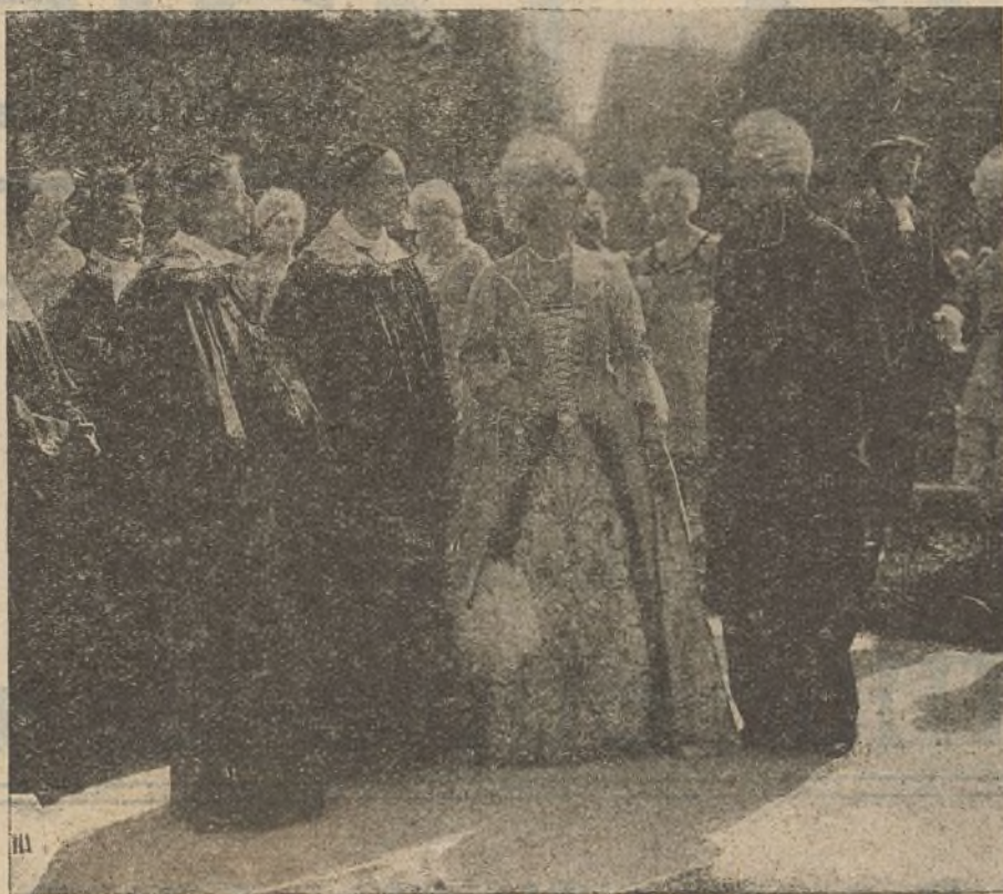
«Cherchez la femme!»

Quince años antes del día en que comienza nuestra historia, las laderas del paso del Muerto ofrecían el aspecto de hormigueros humanos, pues millares de hombres, procedentes de todos los países del mundo, estaban ocupados noche y día en escarbar febrilmente las entrañas de los montes, para robarles las riquezas que avaramente escondían. Mas un día la tierra se negó obstinadamente a dejarse robar de los hombres,