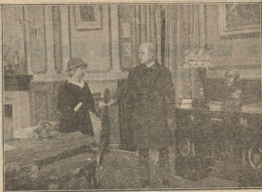
«El hombre de las tres caras»

condesa Leda Olonia, le presenta en sociedad bajo el nombre de conde Guido de Guglielmi, bajo cuyo aristocrático título, nadie puede sospechar que se oculta un evadido del penal. La simpatía que la condesa experimentó por el joven se ha convertido en amor y en su pasión, la hermosa dama le amenaza con que si algún día, olvidando su amor y los beneficios que de ella ha recibido, la olvida, lo entregará de nuevo a la Justicia para que le reintegre al presidio de donde ella ha conseguido librarle con su protección.