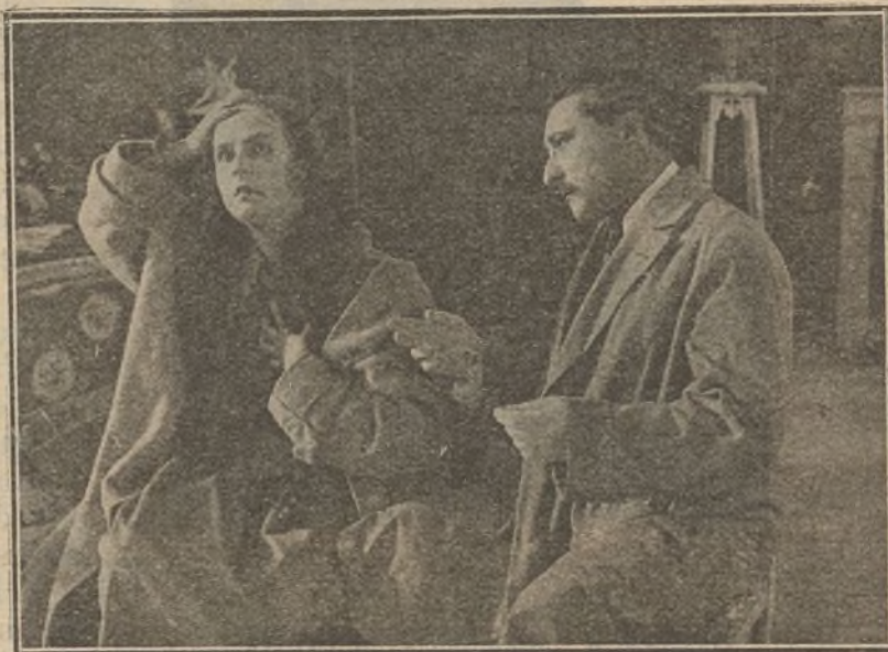
«El hombre de las tres caras»

Los americanos, que por ser casi todas sus más famosas actrices del cine inimitables ingenuas, son los que más cintas infantiles han producido. Sin contar las creaciones de Mary Pickford «La pobre rica», de Margarita Clarck, «Blanca Nieves», de Mae Murray, «El hada