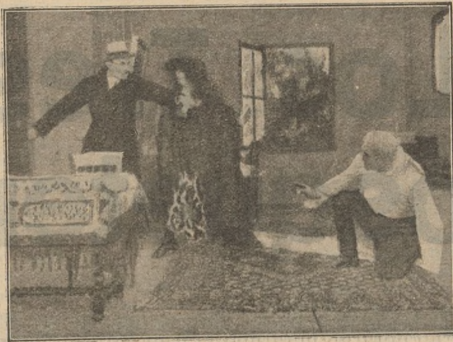
«El hombre de las tres caras»

La noche del día siguiente, cumpliendo su promesa, Mac Allan va al Circo, dispuesto a ponerse al habla con el atleta, pero le sale al paso una triste nueva: Bill Conner acaba de ser asesinado en su cuarto. Mas la imposibilidad del caso estriba en que otro Bill Conner está trabajando al mismo tiempo en la pista, el cual, tan pronto tiene noticia del crimen, huye precipitadamente. Y Mac Allan le sigue hasta que en el misterio de la noche desaparece el fantasma blanco. Al parecer, en todo ello, se mezcla un viejo naipe: EL DIEZ ROJO, encontrado por el detective entre la suela de un zapato de Bill Conner. Dicho naipe ostenta en su reverso, misteriosos signos. Y excitado el amor propio de Mac Allan por caso tan singular, emprende