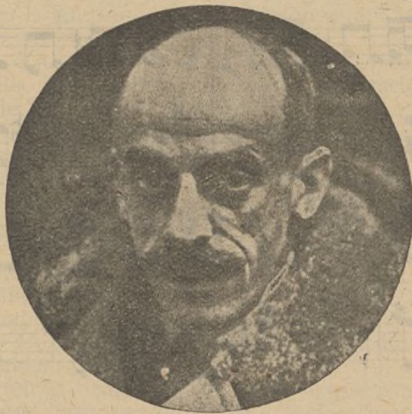
El insigne literato Gregorio Martínez Sierra, cuya voz profunda y clamorosa ha conmovido a España, originando suscripciones, que crecen por momentos, en favor de la Rusia desamparada y hambrienta.

Ha sido preciso que el arte anime con palabras bellas, sinceras y claras la piedad manante del corazón nobilísimo de un poeta, para que nos sintamos sacudidos, inquietos, penetrados de la realidad