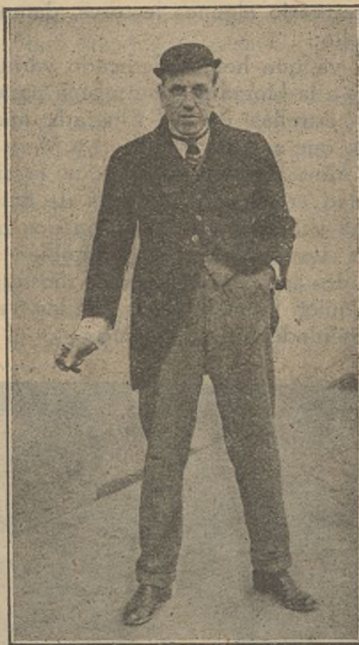
El notabilísimo artista Pepe Santpere en la genial creación que hace del protagonista del gracioso vodevil en tres actos Una dona en comandita , que acaba de ser editado.

Obras de repertorio — La tempestad , La Mascota , El maestro campanone ... — han defendido en compañía de Glorias del pueblo el cartel del Tívoli, mientras se ensayaba la zarzuela de Peña y el maestro Granados La ciudad eterna . Esta zarzuela es uno de los entusiasmos