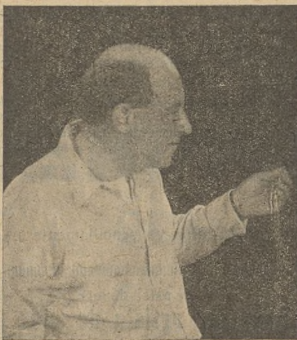
Cecil B. de Mille, el más famoso de los directores de películas de la Paramount

En cambio, hay películas cuyo coste de producción es relativamente económico y los resultados de taquilla obtenidos con ellas no pueden ser más halagüeños. «Humoresque» pertenece a este género de películas. Pocos «films» se