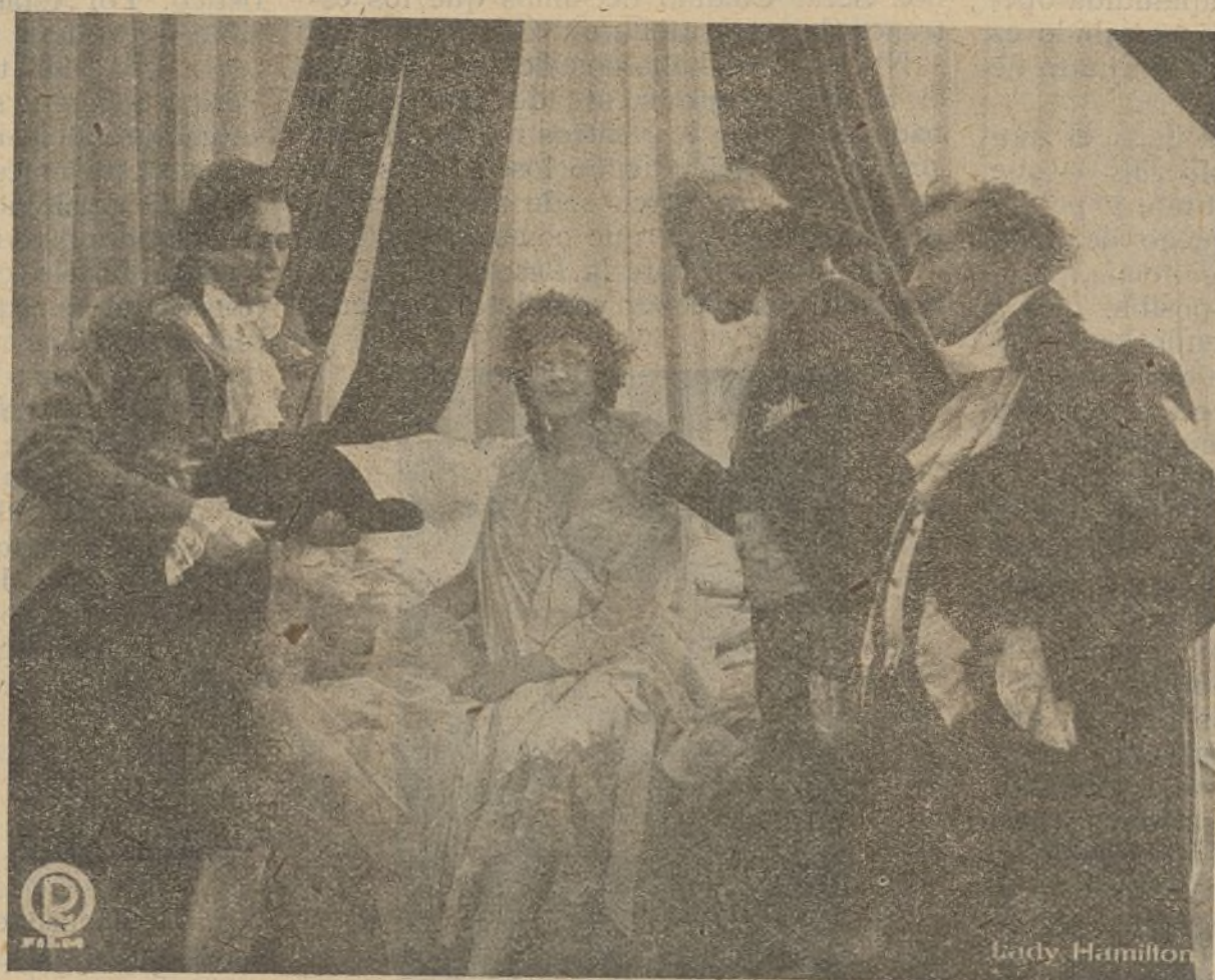
«Lady Hamilton o el alma de Nelson»

Mildred Harris de Chaplin, como pomposamente se hacía llamar, la que fué esposa de Charlot, se presentó ante