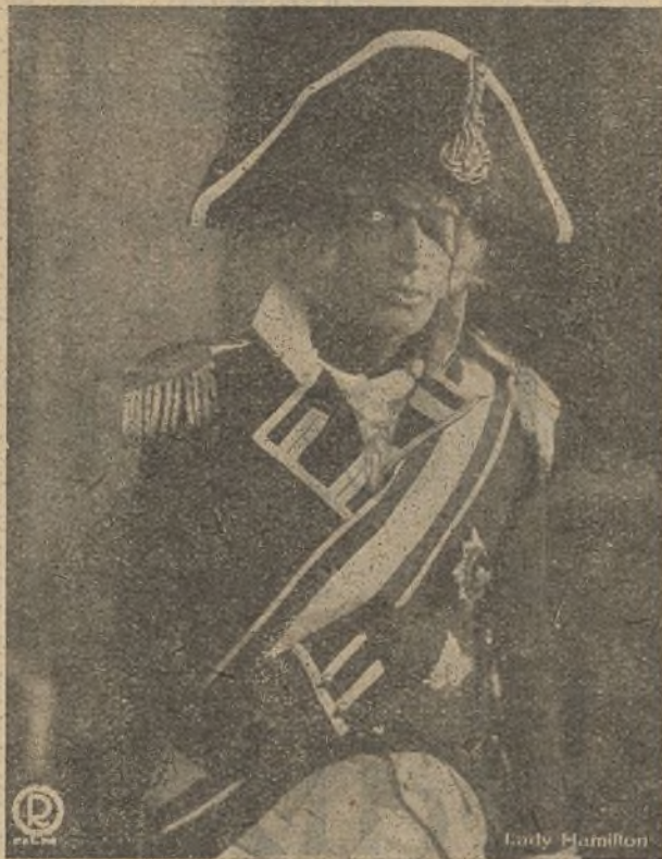
Conrado Veid, intérprete del Almirante Nelson en la película «Lady Hamilton»

mi padre recibió un certificado... el sobre, sólo contenía una hoja de palmera. De la impresión recibida ha quedado como sin sentido... El médico diagnosticó que padecía un fuerte ataque cerebral... De todos modos, yo supuse que había alguna relación con el extraño envío, cuando ayer, estando sentado en el comedor vi espiando en la ventana el rostro espantosamente contraído de un hombre de color... Estoy