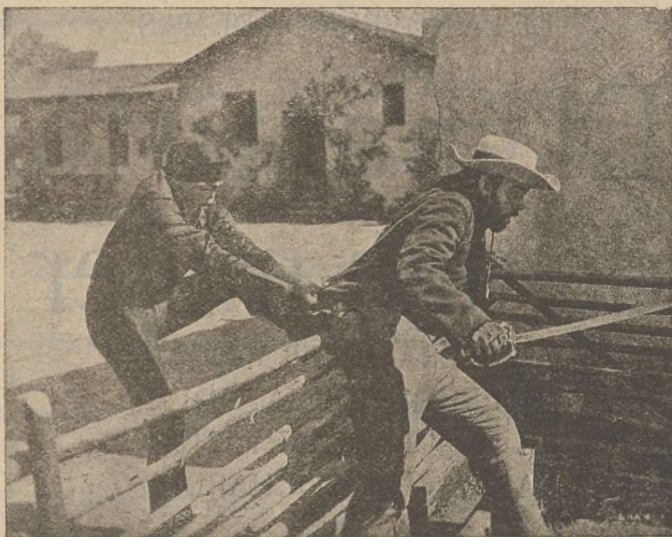
«El signo del Zorro»

Una vez casada a su hija, el conde encarga de la dirección de sus negocios