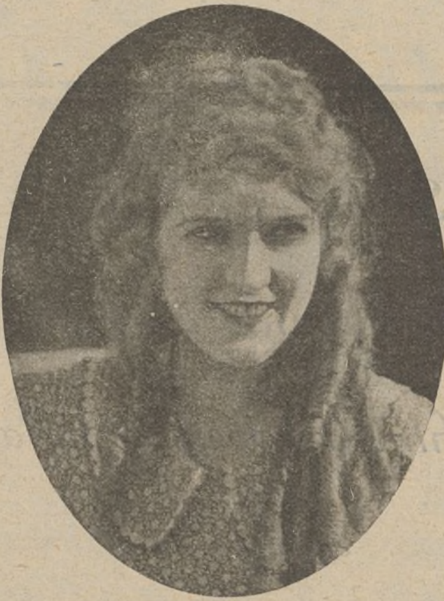
Mary Pickford en «Pollyanna»

la joven, saca de entre los pliegos de su chilaba un finísimo puñal, con el que intenta asesinarle, pero éste se defiende y durante la lucha resulta herido en un brazo, y mientras aquél procura huir, la joven, que salió en busca de los gendarmes, se da cuenta de lo ocurrido, entablándose una encarnizada persecución, hasta que al fin el culpable es detenido. A partir de este momento, el