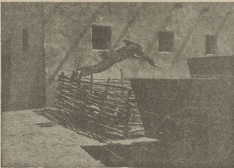
«El signo del Zorro»

mado Pablo Frosac, el cual se había encargado de la asistencia facultativa del anciano marqués. Ciegamente enamorado de Susana de Queyrás, jamás se hubiera atrevido a decírselo; pero,