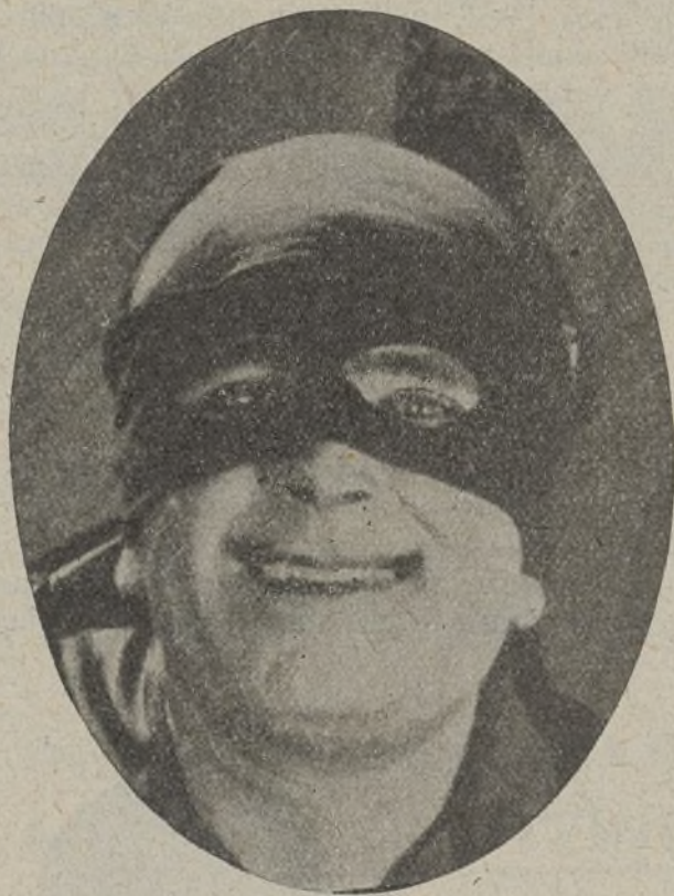
Douglas Fairbanks en «El signo del Zorro»

Campanada que acaso hubiérase evitado con aquella labor de verdadera crítica, que echamos de menos. Porque si el día que este actor debuta, la crítica dice la verdad y le trata como a quien es (con todo respeto, pero señalando la osadía de llegar a ese tablado, a un cómico de la legua) ese cómico no hubiera llegado a lo que llegó. Pero como el ser actor es cosa ya de suyo propensa a la más exaltada vanidad (hasta el punto de que muchos de esos que se llaman eminentes, cuando luego leen el suelto de contaduría se pavonean como si el calificativo fuese desinteresado) y ese actor se ve bien trata-