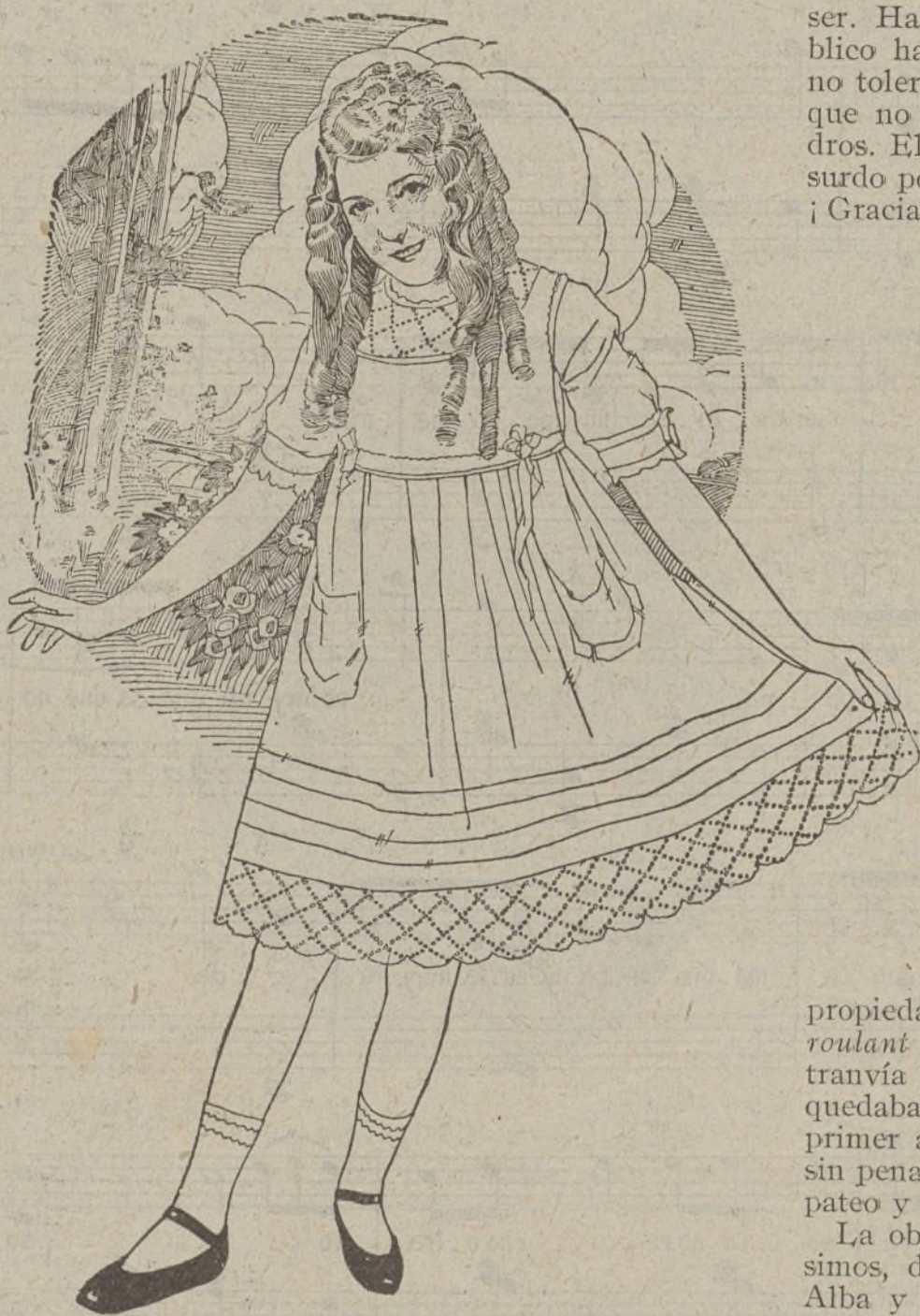
Mary Pickford, en «Pollyanna»

Los estrenos de la semana han sido casi todos una desdicha. El mejor — por lo que promete — ha sido el de La perla