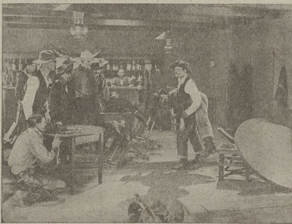
«Un gallina... valeroso»

Muerto el Rey, el pueblo aclama al Príncipe Danilo, como heredero del Trono, pero el joven Monarca, en una alocución patriótica, renuncia solemnemente la Corona, y declara que, respetando la voluntad popular, será el primer Presidente de la República de Rugaria.