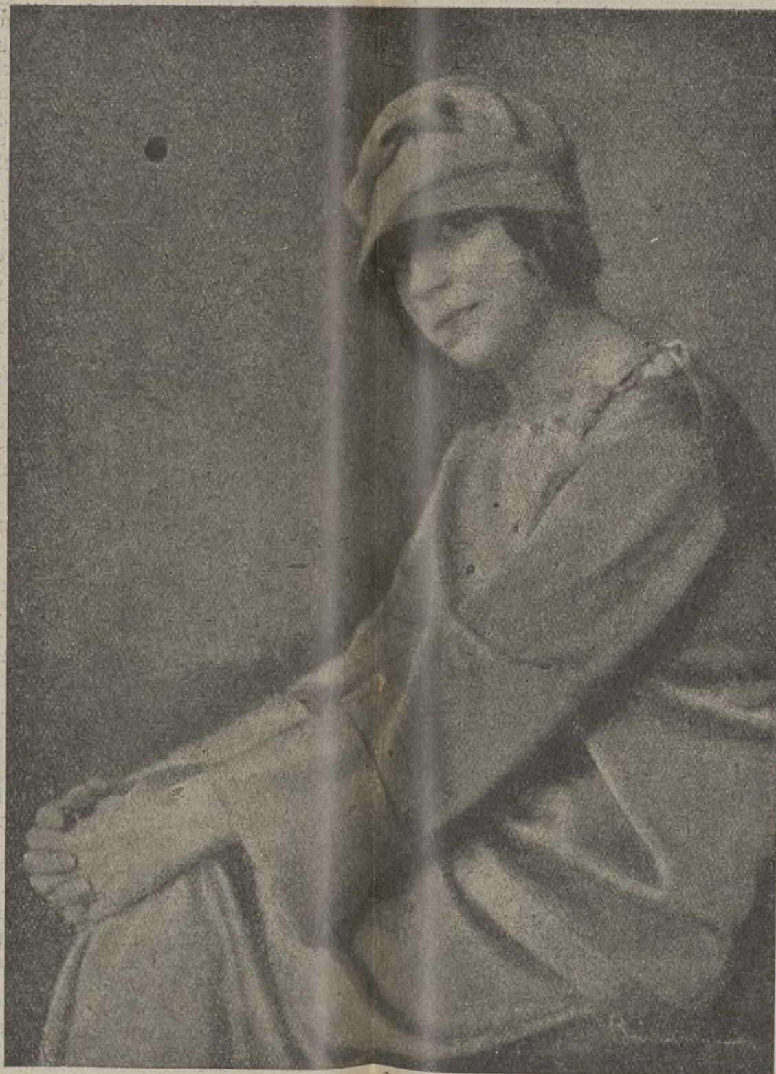
Asta Nielsen, admirable trágica intérprete de la interesante película «La venganza del Conde Sylvain»

paso de gigante con la edición de esta cinta, que a pesar de lo costoso de su presentación, no ha omitido ningún gasto para presentarla con todo lujo de detalles.