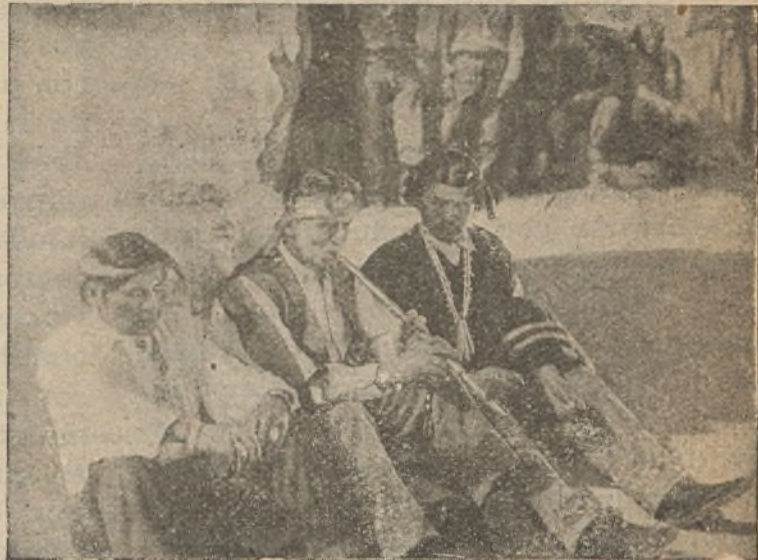
«Un gallina... valeroso»

Y la película, que, como decimos, tenía poco interés, quedó filmada con la escena del accidente, que resultó «muy propia», y que produjo emoción en el público, que creía que estaba incluida en el cinedrama.