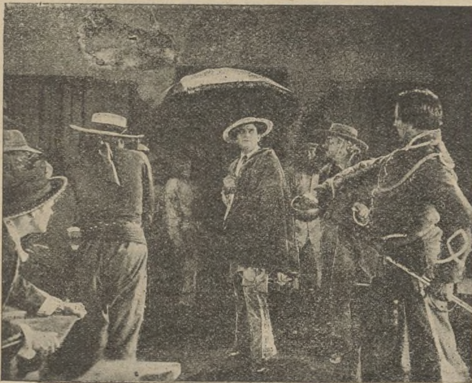
El signo del zorro

bellos completamente iguales a los suyos; y más tarde, una puerta cerrada con un pesado cerrojo, prohibiéndosele de la manera más terminante que la abra. Violeta entra en sospechas y le refiere el caso a Sherlock-Holmes. El famoso detective entra en el acto en campaña, y no tarda en descubrir que Rucastle tiene una hija encantadora, la cual ha heredado una cuantiosa fortuna con la condición de que debe ser administrada por su madre hasta el día en que la joven contraiga matrimonio. Con estos antecedentes, fácil le es a Sherlock-Holmes reconstruir los hechos y venir inmediatamente en conocimiento de lo que había ocurrido; y, para comprobar sus suposiciones, dirige a la casa de los esposos Rucastle, don-