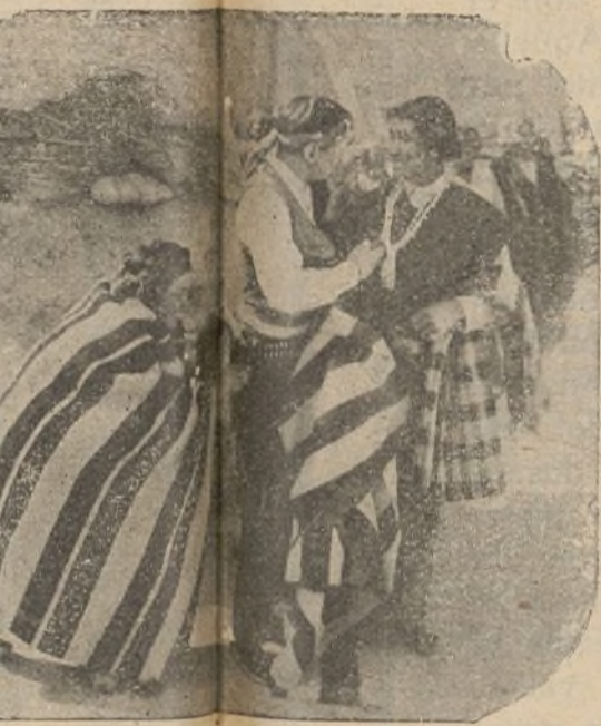
«Un gallina... valeroso»

Muy bien de presentación y fotografía, y muy acertada la interpretación que corre a cargo de los renombrados artistas, Violet Henning, Wanda Hawley y Theodore Roberts, que han logrado hacer de «Toda mujer», una cinta verdaderamente notable.