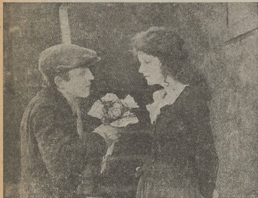
«La calle de los sueños»

ñas de París», «Nube en la felicidad», creación de Enna Saredo, «A 45 minutos de Broadway», interesante cine-drama americano, maravillosamente interpretado por Charles Ray, perteneciente al Programa Circuit, «La catástrofe automovilista de Tarragona», de palpitante actualidad, «Sisebuto deportivo», «Sueño de opio», y «La llama sagrada»; obtuvieron el beneplácito de los asiduos al Real Cinema, Príncipe Alfonso, Salón Doré y Cinema España.