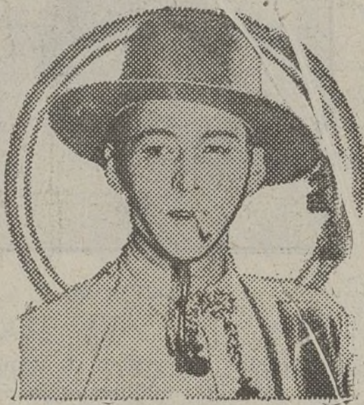
« Los cuatro jinetes del Apocalipsis »

Nosotros recibimos muy pocas cartas porque nosotros tenemos el vicio de contestar a una mínima parte de esas poquísimas que nos trae el correo. Claro es que el defecto de no escribir cartas no tiene una significación de falta de consideración personal hacia los que nos