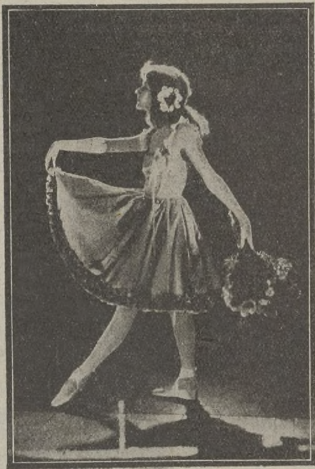
Mary Pickford en «La calle de los sueños»

na al estampido del cañón, y criado entre la metralla de Fleurus, prefería a los azares de la guerra la vida ociosa de París alegre, y su madre lo disculpaba ante el mariscal con un encantador grafismo, hijo de su amor ciego: «¿Es culpa de nadie que él no haya nacido con el corazón velludo y la piel dura como tú?»