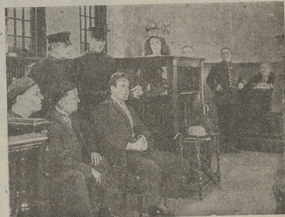
«La calle de los sueños»

«Como se comprenderá — habla mister O'Higgins, — hay que tratar a cada tipo de acuerdo con su particular idiosincrasia. Sería conveniente, sin embargo, que la mujer moderna, para serlo en toda la extensión de la palabra, trocarse la mirada lánguida y el movimiento rítmico del «shimmy», por un